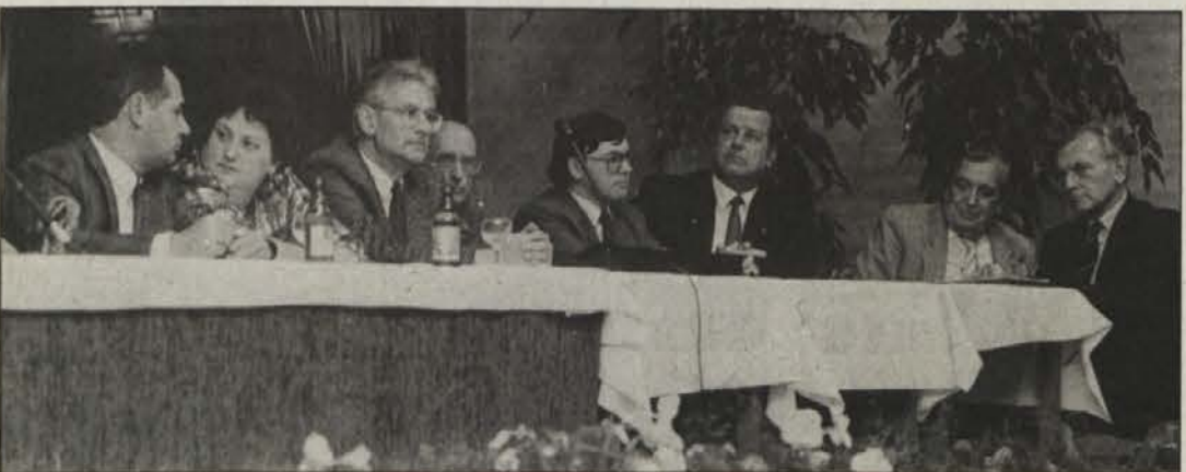
Na podiju so podali svoje mnenje strokovnjaki, politiki in zastopniki narodnostnih skupnosti.

principu namreč prebivalci druge narodnosti ne dobijo mest v javnih službah in stanovanj iz socialnega sklada. Državni svet v Rimu je odločil, da „drugih“ ni mogoče izključevati iz principa sorazmernosti, verjetno bo za ureditev zadeve določil komisarja. Toda stranke se ne morejo sporazumeti.