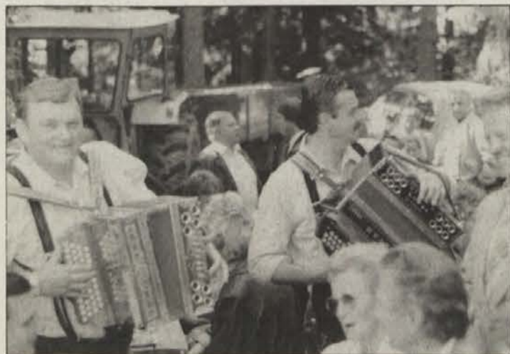
Za dobro voljo so skrbeli harmonikarji...