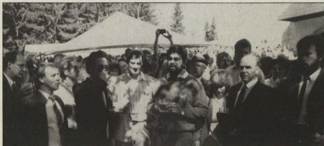
... in pevci, ki so pod zaščiteno lipo prepevali slovenske narodne pesmi.