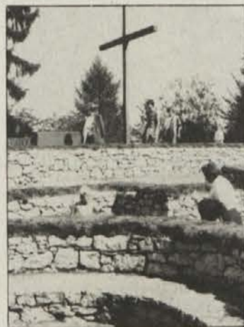
Z dvema jezikovno ločenima mašama na zgodovinskih tleh se je žegnanje začelo.