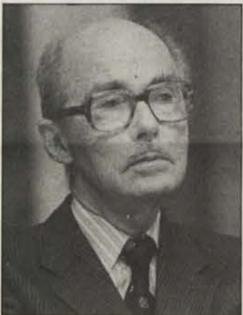
Dr. Otto Habsburg, sin zadnjega avstrijskega cesarja in član evropskega parlamenta