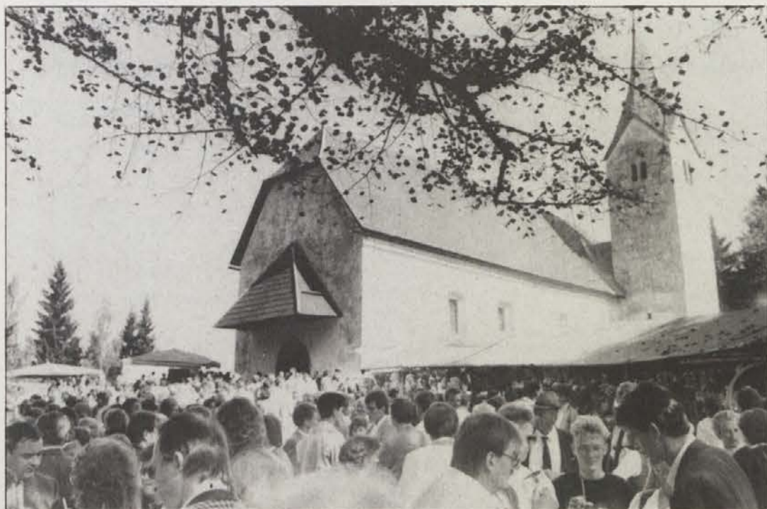
Okoli 5000 ljudi se je zbralo na Rozalskem žegnanju na Hemi.