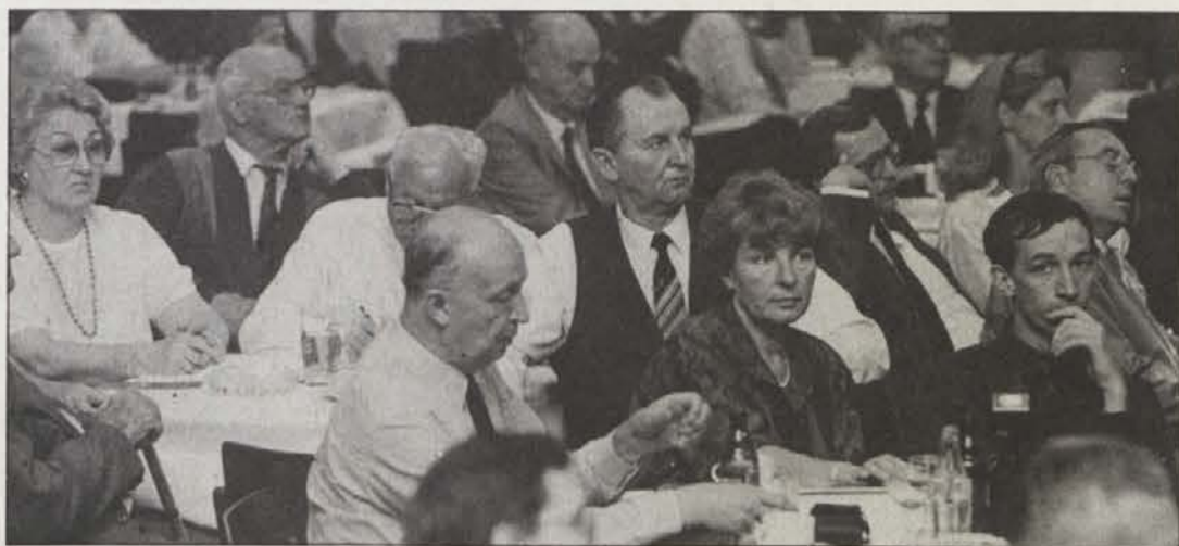
Publika je z zanimanjem poslušala referate predavateljev in forumsko diskusijo.