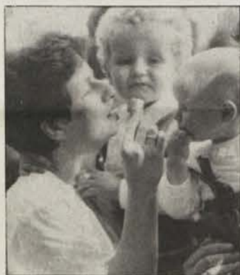
Prigrizek na prostem.