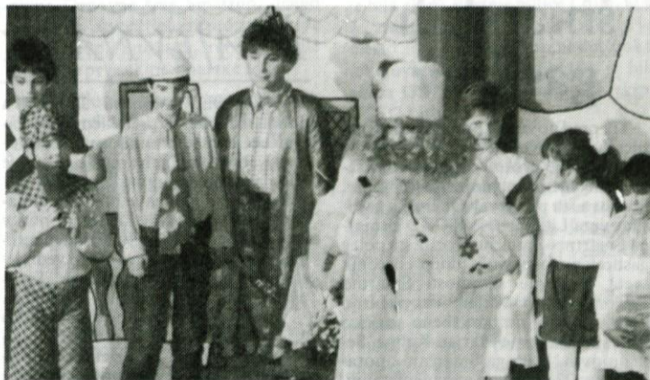
Po lutkovni predstavi skupine LI-LU in igrici skupine OŠ Litija je vse otroke obiskal in seveda tudi obdaril dedek Mraz.

Brez obilice dobre volje in prizadevnosti mladih Enajstošolcev prireditve sploh ne bi bilo. Sploh pa brez denarnih sredstev in praktičnih nagrad pokroviteljev: IUV-TOZD Usnjarna Šmartno , Predilnica Litija , Iskra Delta in Lesnina , TOZD Prodajna mreža iz Ljubljane, OK ZKS Litija , OS ZSS Litija , OK ZSMS Litija , Zveza ORGANIZACIJ za tehnično kulturo Slovenije, Zveza kulturnih organizacij Litija , OŠ Dušan Kveder Tomaž Litija , Zavod za izobraževanje in kulturo Litija ter seveda generalni pokrovitelj DNEVNIK iz Ljubljane.