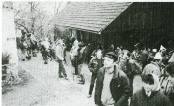
Tisje. V vasi je bila okrepčevalnica, tudi kontrolni in drugi žigi so bili pod podom. Od tu so imeli pohodniki še slabo uro hoje do končnega cilja v Veliki Kostrevnici.

Na Tisju je bila tudi skromna proslava, ki pa je bila za to priložnost povsem primerna! Nihče na 3 do 4-urni poti ni bil žejen ne lačen, saj sta bili organizirani dve okrepčevalnici, na cilju v Zadružnem domu v Veliki Kostrevnici pa je bila organizirano vse tako kot običajno — prijetno in primerno. Litij-