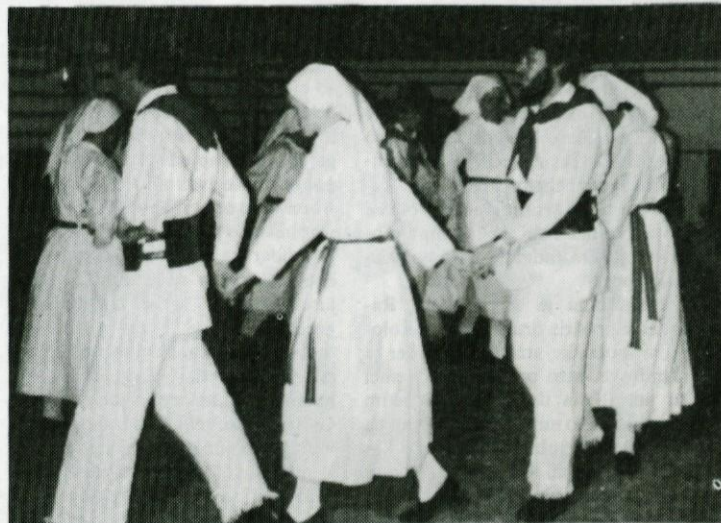
Edina folklorna skupina iz naše občine — F. S. Javorje se je predstavila z belokranjskimi ljudskimi plesi.