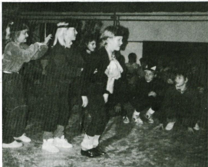
Najmlajši Rondočki so navdušili z rock and rollom, sicer pa plesna skupina Rondo praznuje letos svojo 5-letnico delovanja.