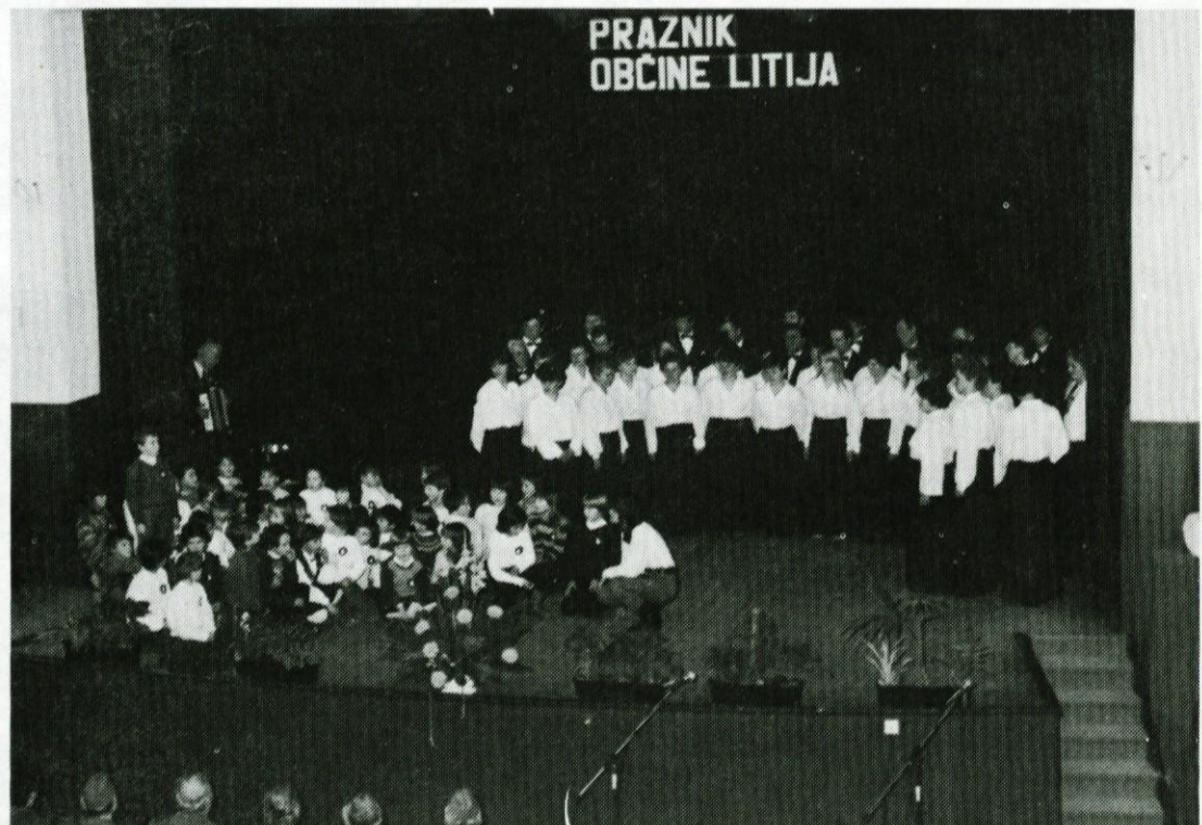
V kulturnem programu na osrednji proslavi ob občinskem prazniku na Stavbah so nastopili učenci Osnovne šole Franc Rozman-Stane iz Šmartnega in pevski zbor Zvon iz Šmartnega. Tako kot proslava je bil tudi kulturni program prijeten, sproščen in aktualen, aplavz polne dvorane je to v celoti potrdil.