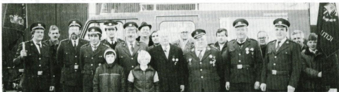
Šmarski gasilci s svojim novim vozilom.