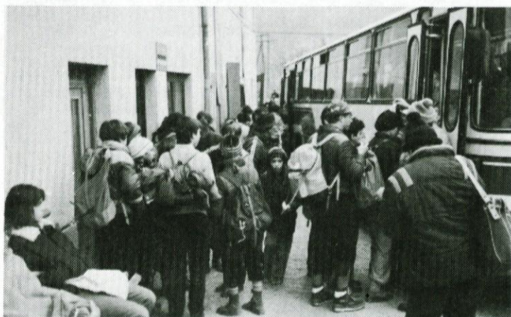
Tokrat je bilo vreme lepo, tako da tudi pri vračanju z avtobusi iz Velike Kostrevnice ni bilo gneče. Udeleženci pohoda so se zaradi tega tudi malo dlje zadržali pred domom.