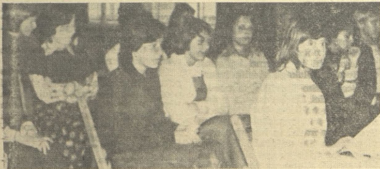
Precejšnja udeležba mladih na »Dnevih mladine«