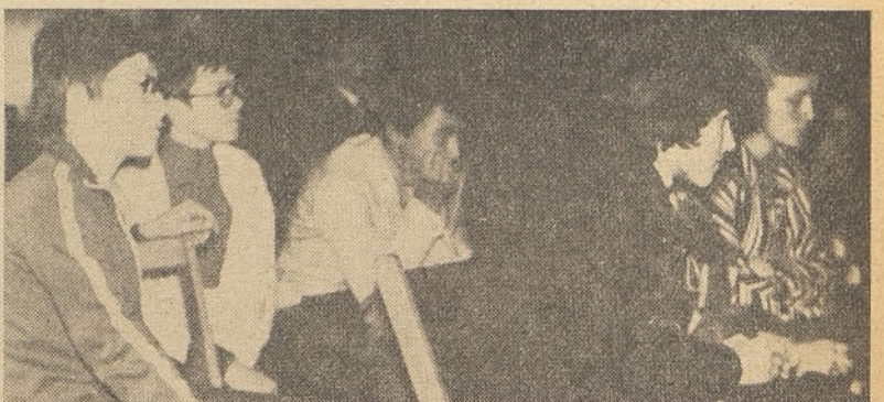
Aktivno sodelovanje mladih na javni tribuni