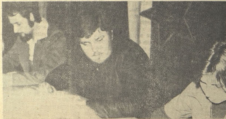
Delovno predsedstvo na konferenci KS ZSMS Steklarne Hrastnik

Še nekaj o delovanju z ostalimi DPO. Kar se tiče ZK je sodelovanje na zavirljivi ravni, vendar je potrebno še več mladih (aktivnih) vključiti v ZK. Pogostni pogovori s sekretarji so le še dodatek tesnejšemu sodelovanju.