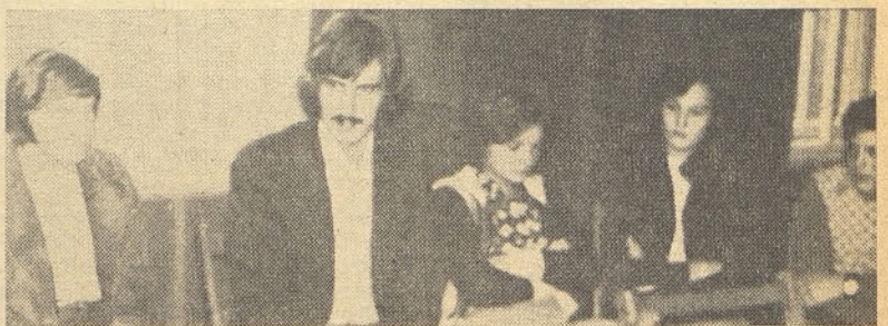
»Dnevi mladine« v Hrastniku — javna tribuna na temo »mladi in prosti čas — človek, delo in kultura«