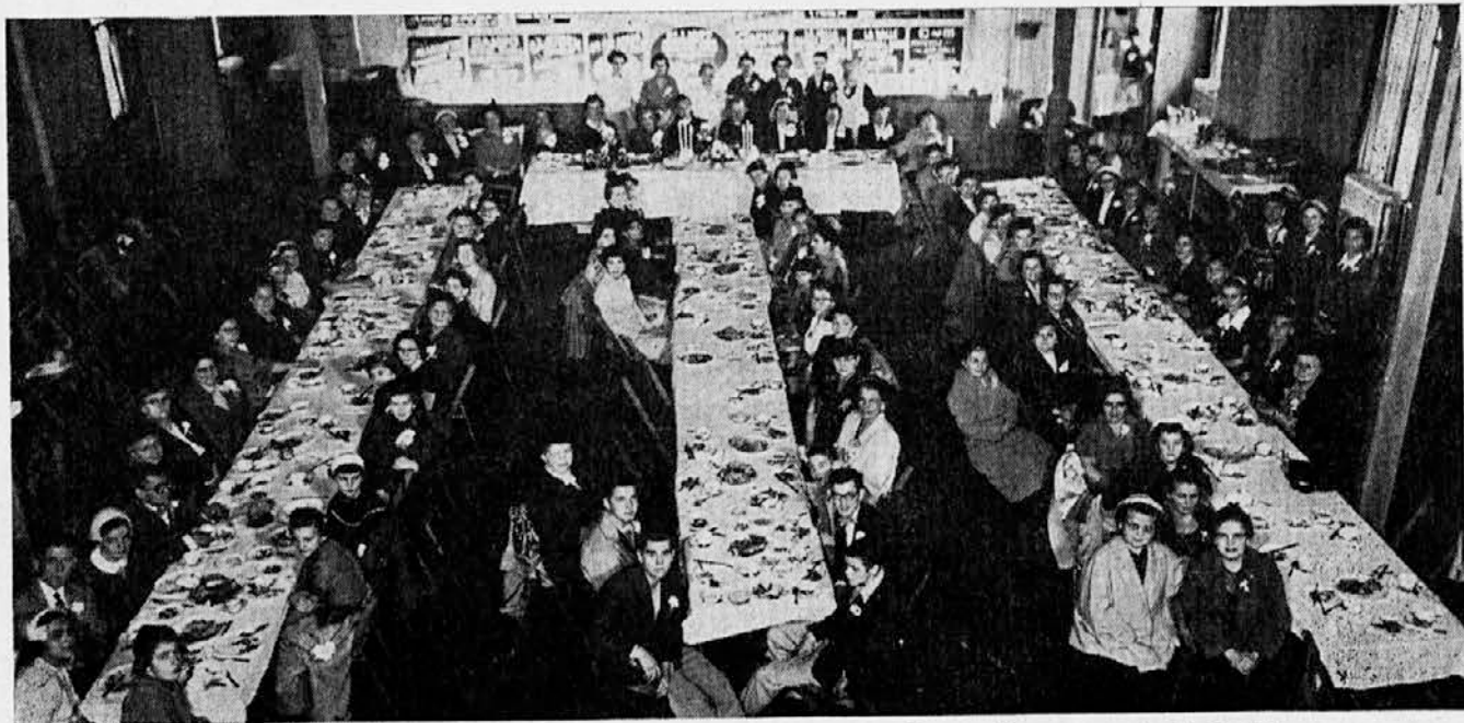
SLAVNOSTNI ZAJTRK OB PROSLAVI 25-LETNICE PODRUŽNICE ŠT. 24, LA SALLE, ILL.