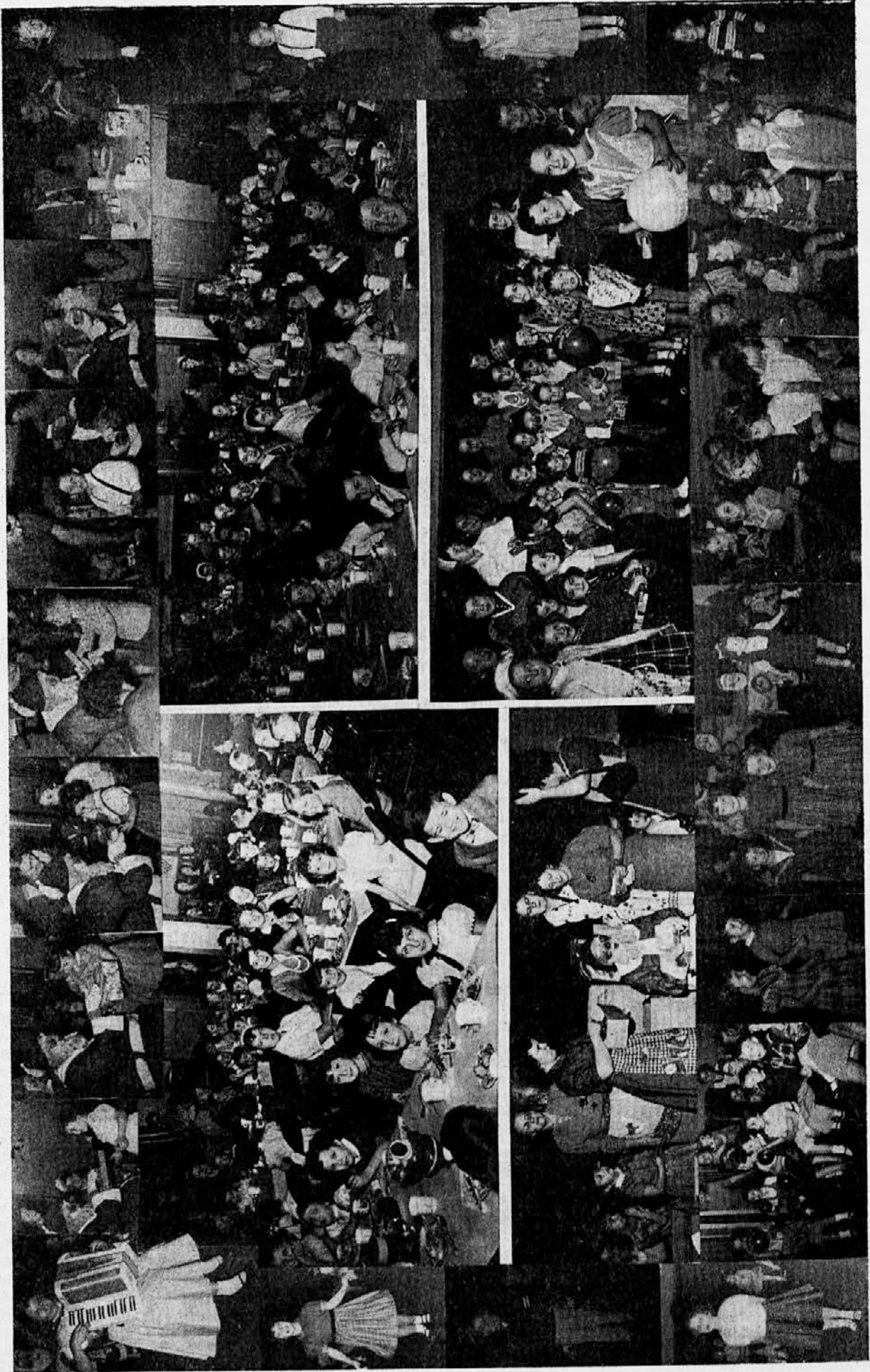
Branch no. 2, Chicago Juniors enjoy Christmas Party.