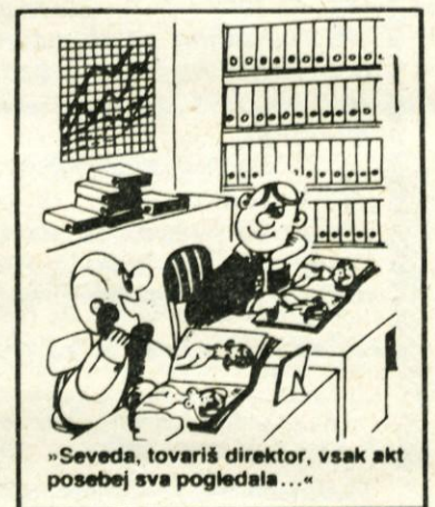
„Seveda, tovariš direktor, vsak akt posebej sva pogledala...“