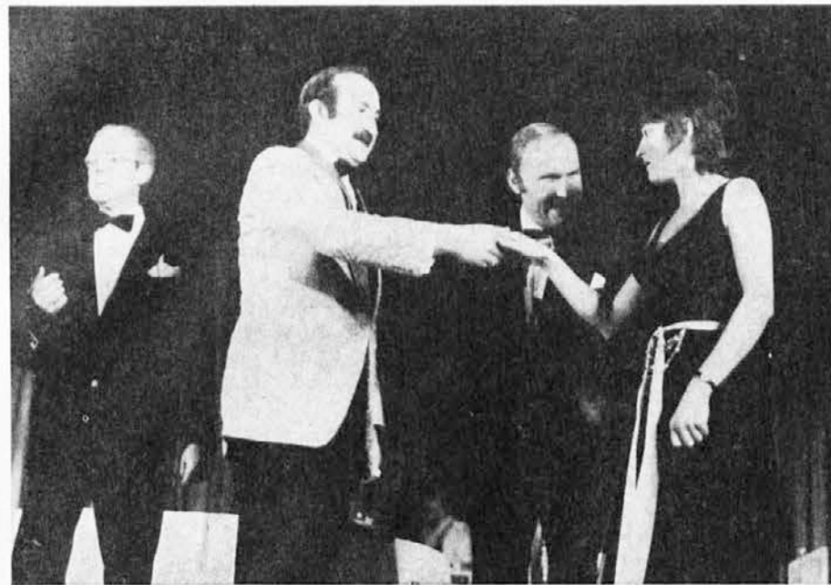
Prizor iz Cankarjeve igre »Za narodov blagor«, s katero je Prešernovo gledališče iz Kranja 4. in 5. novembra nastopilo z velikim uspehom v župnijski dvorani v Doberdolu in v Katoliškem domu v Gorici

Ob koncu pa še priznanje nekaterim ljudem, igralcem in neigralcem, ki so omogočili obstoj Olympije. Ti zanemarjajo včasih delo, razvedrilo, družino zato, da se delovanje društva ne ustavi. Paulo