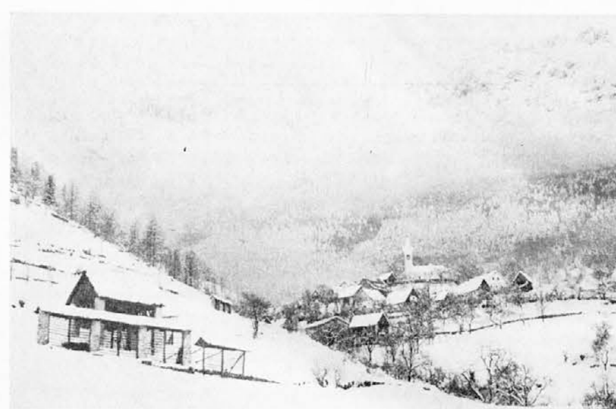
Rut (bivši Nemški rut) pod Črno prstjo v svoji beli opojnosti