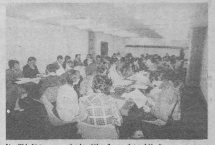
Na sliki: Ustanovna seja skupščine 3. mandata občinske samoupravne interesne skupnosti za kulturo.