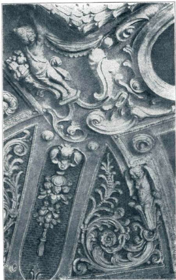
Maribor, grad, dvorana, strop s štukaturami (2. pol. 17. stol.)