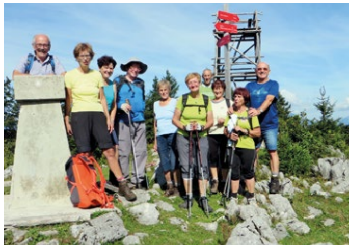
Skupinski posnetek na vrhu Vivodnika – ko je lepo, je res lepo