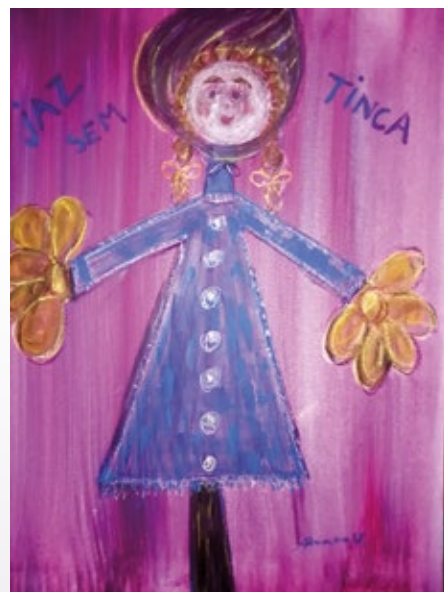
Moj hobi so lutke

se je pri gasilskem domu 12. septembra okrog 9. ure zjutraj zbralo nepričakovano veliko mladih in odraslih slikarjev, tako iz vodiške občine kot tudi od drugod. Po prijavi so prevzeli slikarska platna, se zaradi predpi-