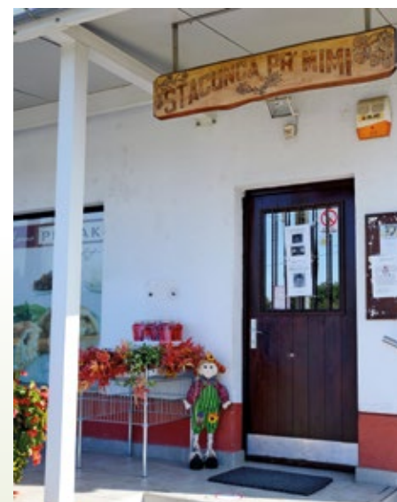
Lastnica trgovine Štacuna pri Mimi pravi, da so bili njeni kupci lepo disciplinirani in umirjeni med korono.

Izbruh koronavirusa po svetu za seboj pušča posledice tudi na gospodarstvu in mednarodnih trgih. Po ocenah Azijske razvojne banke (ABD) bi lahko ta povzročil do 374 milijard dolarjev globalne škode.