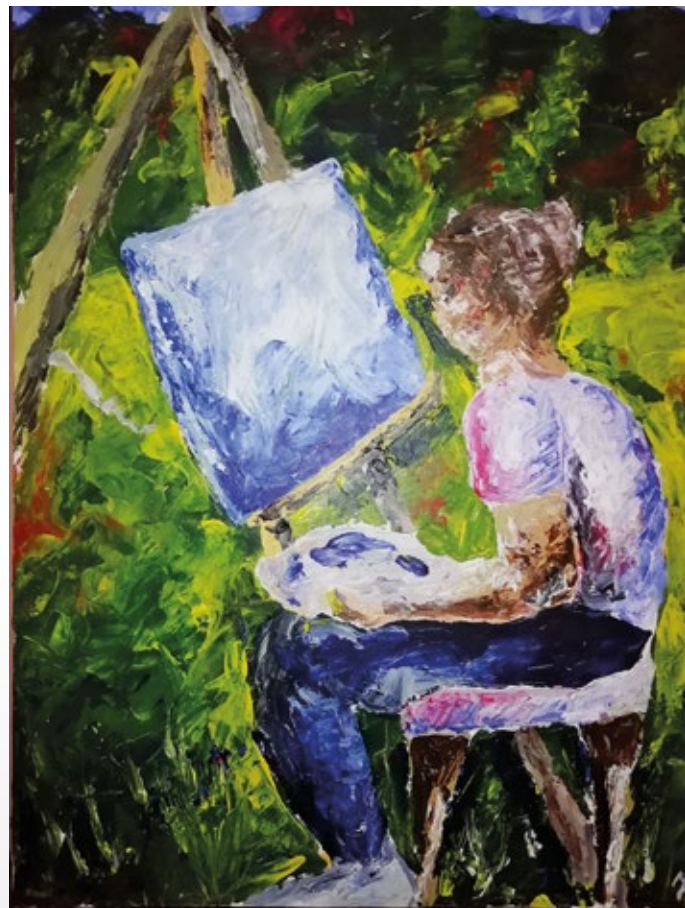
Moj konjiček je slikanje

Za zaključek ‚barvite‘ sobote so vsi prisotni napolnili različne želodčke, organizatorji pa smo z veliko hvaležnostjo do Prostovoljnega gasilskega društva Zapoge, ki je poleg prostora dalo na razpolago vodo, toalete, mize, klopi in veliko spodbudnih besed, zapustili prijazno vasico z novimi idejami za prihodnji ex-tempore.