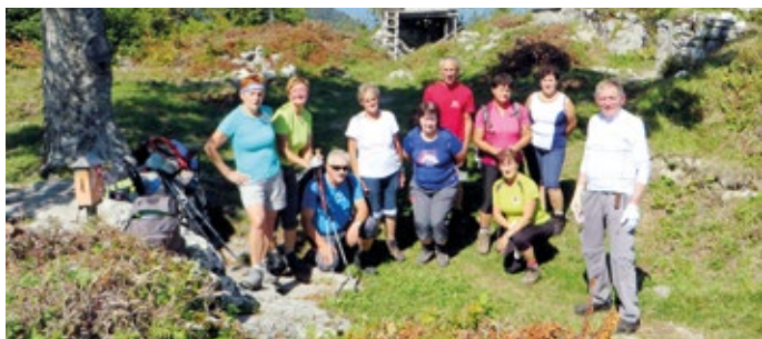
Obisk pohodnikov na Friderihštajnu – grofa Friderika ni bilo doma