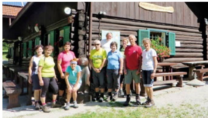
Skupinska slika z medvedom pred kočo pri Jelenovemu studencu