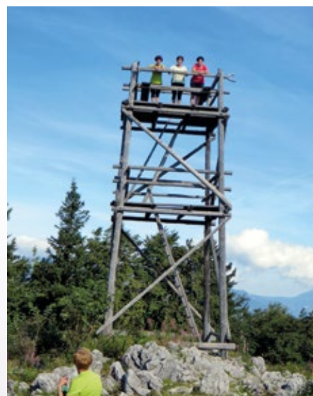
Razgledni stolp na Vivodniku – z višine se lepše vidi

večkrat preči makadamsko cesto, odpravili do planinskega doma na Menini planini. Vivodnik, najvišji vrh Menine planine, ni daleč stran, zato smo vzeli pot pod noge in se odpravili pogledat še to razgledno točko. Na vrhu je postavljen razgledni stolp, ki pripomore, da se okolica še lepše vidi. Lepo vreme in razgledi daleč naokrog, seveda tudi dobra družba, bodo odgovorni za lepe spomine tudi v zimskih dneh.