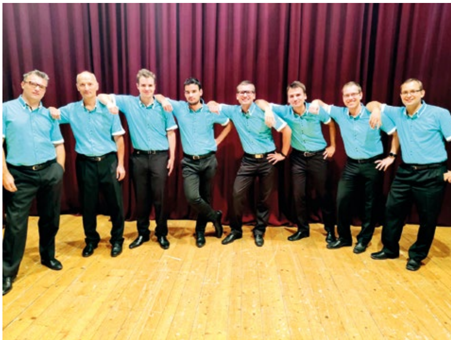
Matici pred nastopom