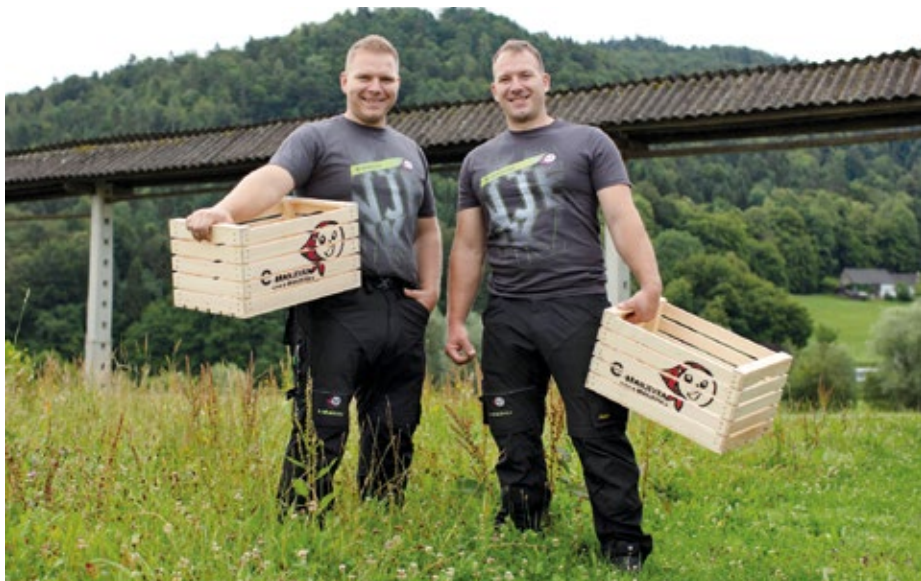
E-branjevka blagovna znamka je čez poletje ponovno zaživela. Je bilo pa potrebnega nekaj prilagajanja.

delamo z večjimi podjetji, ki so naši naročniki. Močno pa se pozna pri energiji gostov. Včasih so bili ljudje zelo sproščeni. Danes je ves čas čutiti neko prikrito napetost, ljudje so v skrbeh. Na drugi strani so seveda taki, ki jim nobena vladna navodila ali nalepke in opozorila pred vrati ne pomagajo. Oni ne bodo imeli ob vstopu v gostilno maske, kot je treba in pika. Jaz jo nosim po protokolu. Da zaščitim sebe, druge in ker so taka priporočila. Bil bi neodgovoren, če bi ravnal drugače. Pa še nekaj. Ker imamo veliko kvadrato, nas tudi številčna omejitev gostov ne bo toliko udarila. A kaj bo v prihodnosti, lahko samo ugibamo. Je pa res, da nas je epidemija vse prisilila, da smo šli iz cone udobja in začeli razmišljati drugače.«