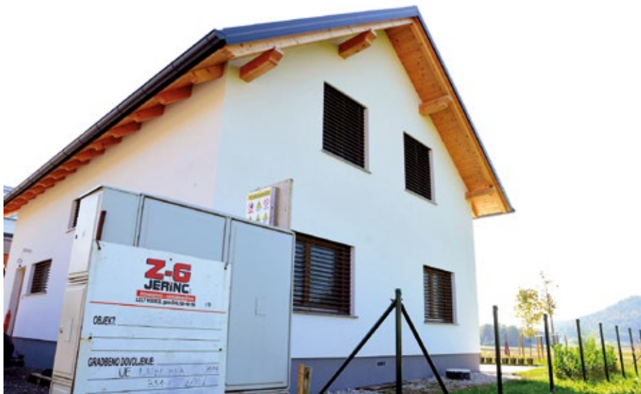
Gradbeništvo je ves ta čas teklo nemoteno. Še boljše organizacija je, menijo v firmi Jerinc.