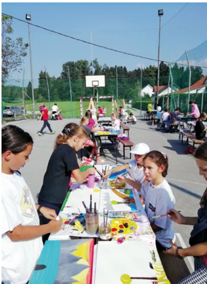
Ustvarjali so tako otroci in mladi kot veterani.

sanih ukrepov namestili v varni medsebojni razdalji po igrišču, v sence dreves in druge primerne koticke ter začeli ustvarjati.