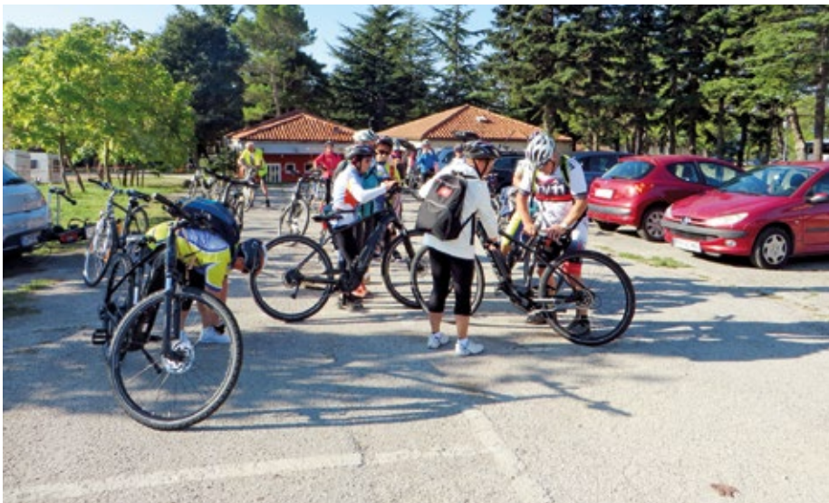
Priprava pred kolesarjenjem v avtokampu Ankaran

Tradicionalni kolesarski izlet, ki ga vsako leto organizira kolesarska sekcija DU Vodice, smo letos združili s preizkusom vožnje z električnimi kolesi, ki nam jih je posodila Občina Vodice ob zaključku projekta LAS Za mesto in vas pod naslovom »E-nostavno na kolo«. Šest izposojenih električnih koles smo namenili našim kolesarkam, ki so bile pripravljene preizkusiti vožnjo z njimi. Izhodišče za izlet smo izbrali Ankaran, od koder smo se, po seznanitvi z novimi kolesi, odpravili na pot preko Kopra, Izole, čez hrib skozi manjši tunel do Strunjana, znova v hrib in skozi daljši tunel do Portoroža. Ob obali smo si vzeli čas za krajši počitek ob jutranji kavici, slaščici ali sladoledu. Sledila je prijetna vožnja skozi Lucijo do Sečoveljskih solin in ob krajinskem parku do Sečovelj oziroma do mejnega prehoda na Dragonji. Lepo, toplo in jasno jesensko vreme, ki nas je spremljalo na poti, je bilo krivo, da smo se kar nekajkrat ustavili in uživali v naravi. Vračali smo se po isti poti, si