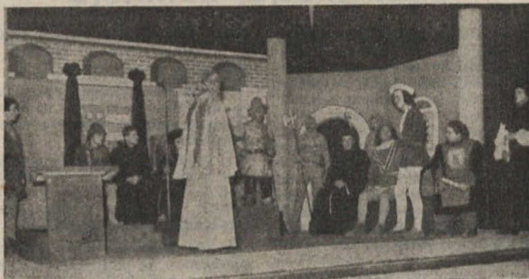
Svoboda v Zadvoru je zelo aktivna. Posnetek kaže prizor z zadnje predstave Celjskih grofov

Ker pa tudi kulturna dejavnost terja razmeroma velika denarna sredstva, se je treba s tem že v začetku sprizniti in morajo občinski forumi to upoštevati.