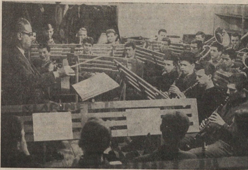
Tudi pri vajah je treba resnosti in zbranosti

Z godbo sodeluje naš zbor od lani. Za to zvrst sodelovanja pa manjka notnega materiala; delno ga je treba celo transportirati skoro vsega za instrumentirati. Za prihodnje leto imamo obljubljeno, da bodo taka dela tudi tiskali. Zanimivo pa je, da otroci radi pojejo kljub vsem radijskim, TV,