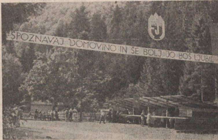
Pesnetek z letošnjega piknika počitničarjev v Peklu pri Borovnici

Od vseh strani naše občine prihajajo ti mladi počitničarji. Nešteto lepih spominov jih družijo — spominov na dni, ko so prevzeti strmeli v veličino naših gora, ko so občudovali zgodovinske znamenitosti, obvarovane pred uničujočim viharjem časa, ali ko so zasanjano strmeli v sivomodre valove Jadrana, ki so jih božali žarki zahajajočega sonca. Nekateri od njih so se udeležili tudi pohodov po poteh, kjer so nekoč izčrpane, a zmagovite stopale partizanske čete.