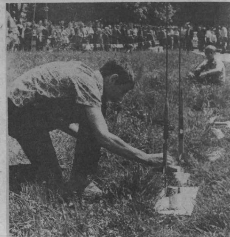
Pridobljeno znanje iz raketne tehnike bodo mladi s pridom uporabili pri obrambi domovine.

INFORMATIVNI BILTEN MK IN OK SZDL LJUBLJANA