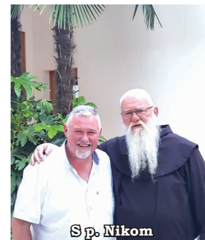
S p. Nikom

Duh je še zelo voljan, a telo že kaže prve znake utrujenosti. Vseeno naprej. Sv. Anton, izprosi moči. Zdaj proti krajem, iz katerih je res veliko Slovencev v Avstraliji. Klenik, Pivka, Zagorje, Knežak (ustavim se tudi na pokopališču, zmolim za vse, ki tam počivajo in prinesem pozdrave vseh avstralskih Slovencev, ki imajo tu pokopane sorodnike), Bač (srečanje z