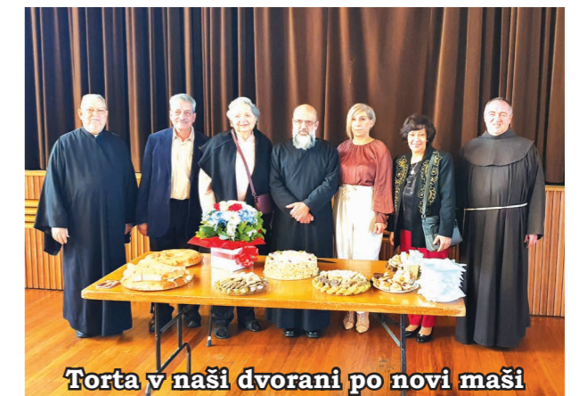
Torta v naši dvorani po novi maši

»To je dan, ki ga je naredil Gospod« (Ps 118,24).