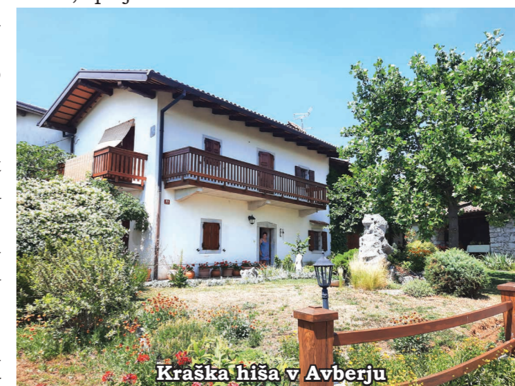
Kraška hiša v Avberju