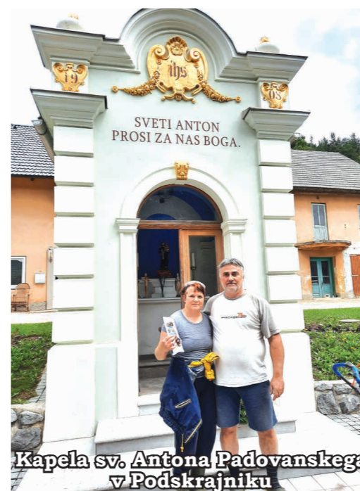
Kapela sv. Antona Padovanskega v Podskrajniku

me je zbudilo žvrgolenje ptic, saj je tu že skoraj poletje. Pojedel sem zajtrk in odvihral proti meni res ljubi cerkvi sv. Antona Padovanskega, kjer sem bil krščen, preživel svoja mladostna leta, ministriral, pel ... Lahko bi rekel, da je bila moj drugi dom. V njej sem daroval prvo mašo po prihodu iz Avstralije. Po maši sem tekkel k oltarju sv. Antona Padovanskega, kjer so tudi njegove relikvije, in polglasno vzklikal: »Anton, hvala, hvala, hvala ...« Z mestnim avtobusom številka 6 sem se odpeljal proti centru Ljubljane. Vse se mi je zdelo tako drugače, lepo, navdihujoče. Parlament, ploščad pred njim, operna hiša, narodna galerija, muzej moderne umetnosti, pravoslavna cerkev, park Tivoli, pa Čopova in Nazorjeva ulica, frančiškanska cerkev, reka Ljubljanica, Tromostovje, tržnica, mestna hiša, Robbov vodnjak, stara Ljubljana ... In na koncu, ko je sestra končala službo, še kavica na ljubljanskem nebotičniku. »Navdušen sem nad Ljubljano,« sem ji govoril in pripovedoval, kaj vse sem videl in doživljal. Doma mi je pripravila krasno večerjo, dal sem fotografije na FB in šel spat. Noč je bila kratka. Drugi dan je bilo srečanje s kamniško dekanijo duhovnikov. Pater Ciril A. Božič me je povabil, da se udeležim tega prijateljskega srečanja, ki je potekalo v kartuziji Pleterje, najprej ob evharistični mizi, potem pa še za mizo na kmečkem turizmu. Pozno popoldne je sledil obisk v Šentjerneju pri Smoličevih, na poti proti Novemu