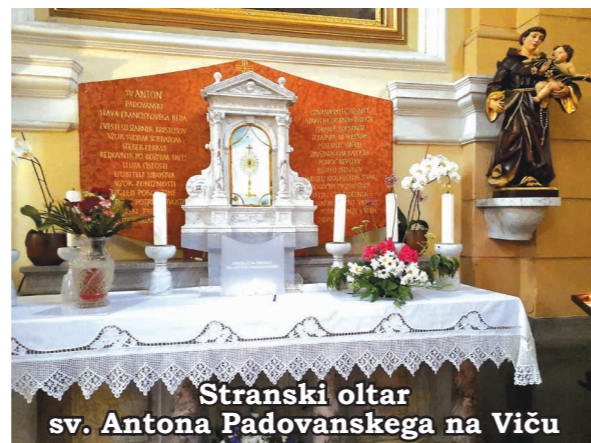
Stranski oltar sv. Antona Padovanskega na Viču