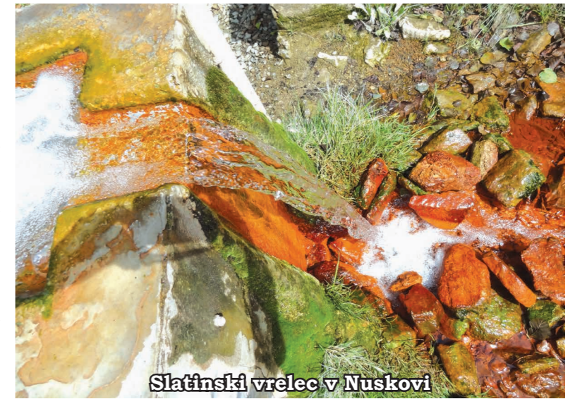
Slatinski vrelec v Nuskovi

Ob koncu nekega dne se utaborimo ob Bukovniškem jezeru na počivališču za avtodome. To so zelo praktična, prijazna in poceni prenočišča, ki so se v Sloveniji v zadnjih letih precej razširila, saj ima vedno več ljudi doma bivalni avto, s katerim preživljajo vikende na različnih koncih Slovenije. Namesto, da bi iskal kamp, ustaviš na takšni točki, ki ima ponavadi tudi sanitarije. Počivališče je tistega večera prazno, brez-