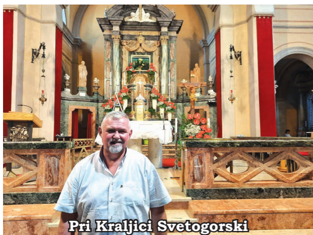
Pri Kraljici Svetogorski