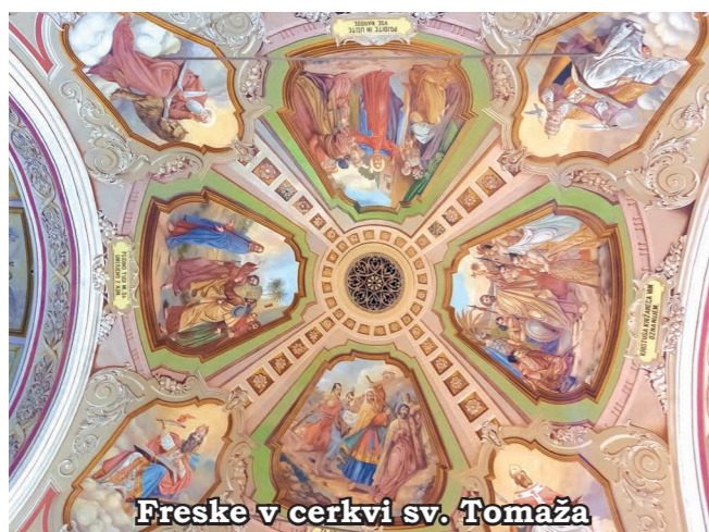
Freske v cerkvi sv. Tomaža