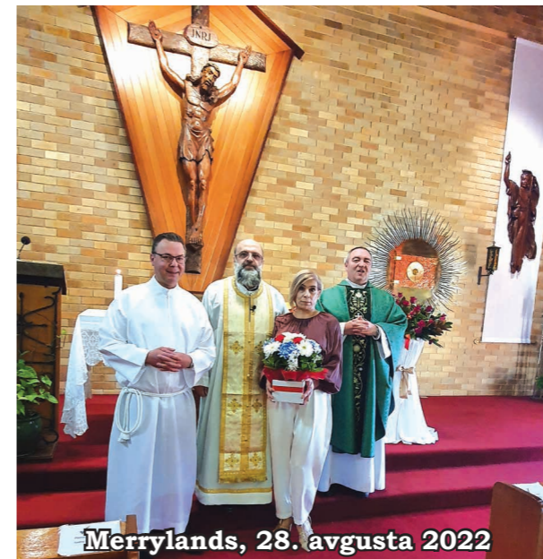
Merrylands, 28. avgusta 2022

valec vpraša duhovnike in občestvo, ali je kandidat vreden, da prejme posvečenje. Duhovniki, nato pevski zbor in končno vsi verniki na ves glas vzklikajo: »Axios! Axios! Axios!« (grško: »Vreden je!«) Pevski zbor nato trikrat zapoje »Axios, Axios, Axios!« Škof položi diakonu roke na glavo in moli posvetilno molitev. Nato so njegovi družinski člani prinesli mašna oblačila, ki jih je škof tudi blagoslovil, preden jih je novoposvečeni duhovnik oblekel.