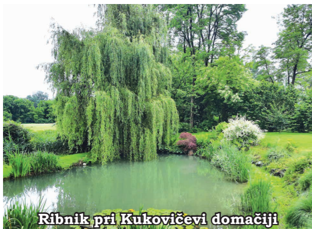
Ribnik pri Kukovičevi domačiji