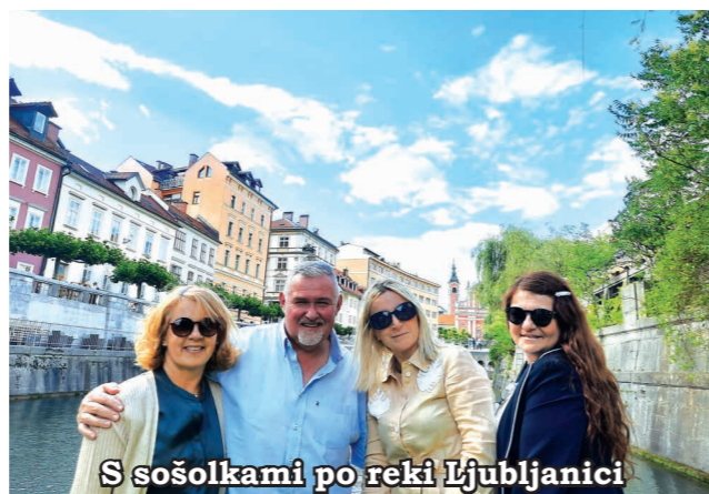
S sošolkami po reki Ljubljanici