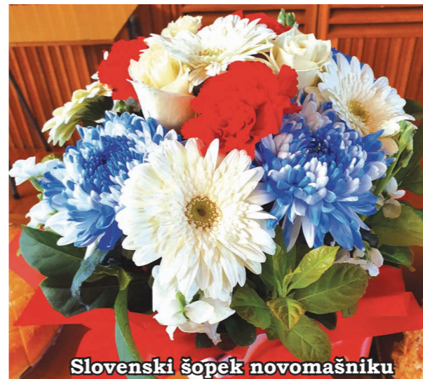
Slovenski šopek novomašniku

Zadnjo nedeljo v avgustu, 28. 8., smo po naši sv. maši sprejeli novomašnika in njegovo ženo v naši cerkvi sv. Rafaela, zapeli našo znano slovensko pesem Novomašnik, bod' pozdravljen