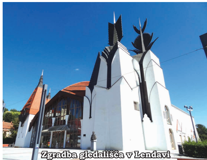
Zgradba gledališča v Lendavi