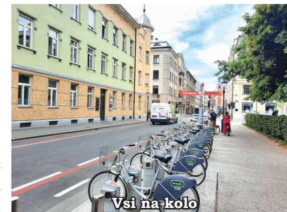
Vsi na kolo