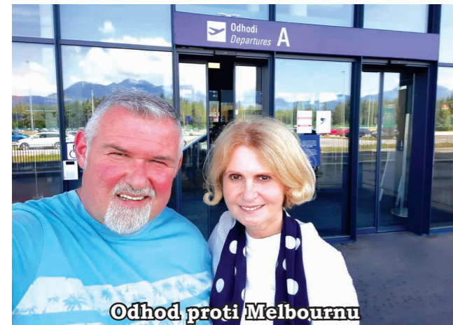
Odhod proti Melbournu

V tem kratkem času sem doživel ogromno lepega. Videl sem veliko novih pokrajin in vasi. Narava v