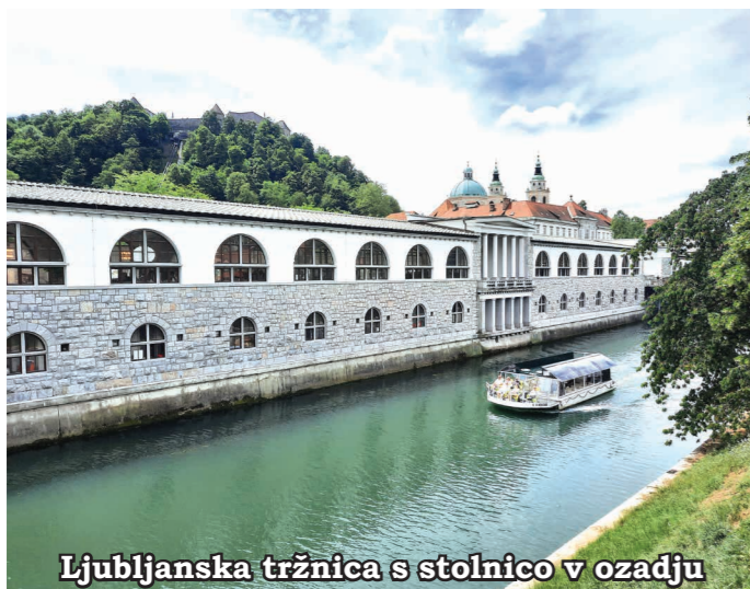
Ljubljanska tržnica s stolnico v ozadju