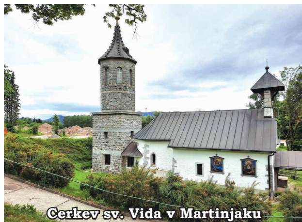
Cerkev sv. Vida v Martinjaku