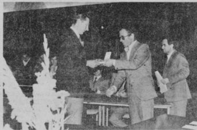
S podelitve odlikovanj v sejni sobi SO Ptuj