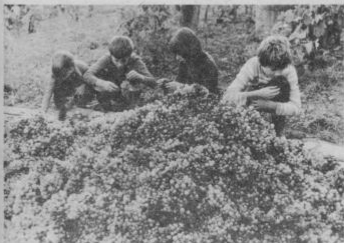
Izgleda, da se le otroci veselijo obilne letine