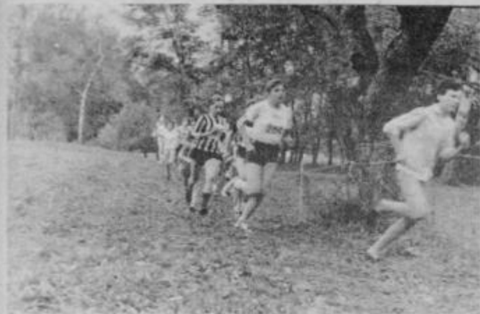
Proga v Šturmovcu omogoča res pravi tek v naravi