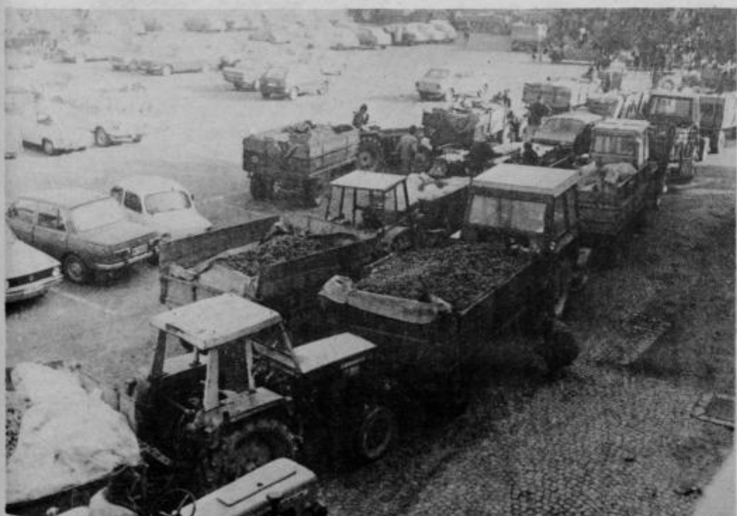
Kolone čakajočih so bile vse daljše tudi v Ptuj