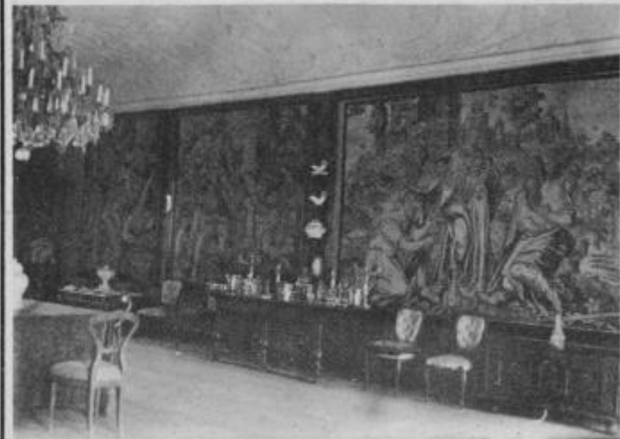
Stara postavitve grajske jedilnice na ptujškem gradu s prezentacijo flamskih tapiserij; fototeka kulturnozgodovinskega oddelka F 994, pred letom 1969

Ptujski muzej sodi med najbogatejše posedovalce tapiserij v srednji Evropi. Čeprav so v času največjega razcveta te tehnike v Evropi delovale mnoge velike manufakture, ki so komaj uspeli zadostiti naročilom, se je ohranilo bore malo tega bogastva — le nekaj serij, večinoma pa le