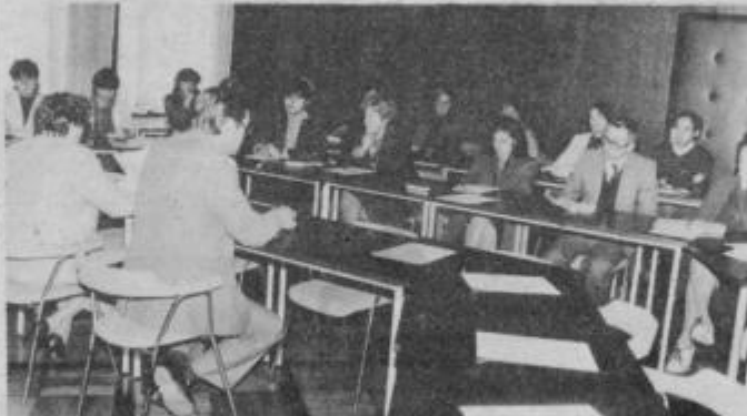
Udeležba je bila pod pričakovanji.