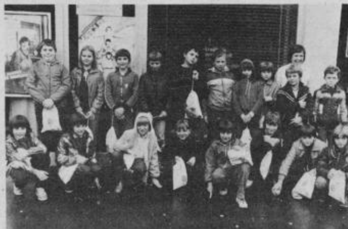
. . . in pred KB Maribor-PE Ptuj, kjer so bili na obisku v pionirski hranilnici.

dili v Nemčiji. Se pomembneje pa je utrjevanje prijateljskih in tovariških stikov med mladimi Slovenci v domovini. Se naprej bodo romala pisma, izmenjavali se bodo obi-