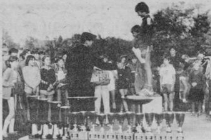
Priznanja za najboljšje