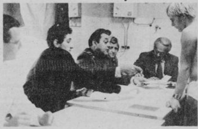
Naborna komisija pri delu v enem od nabornih centrov