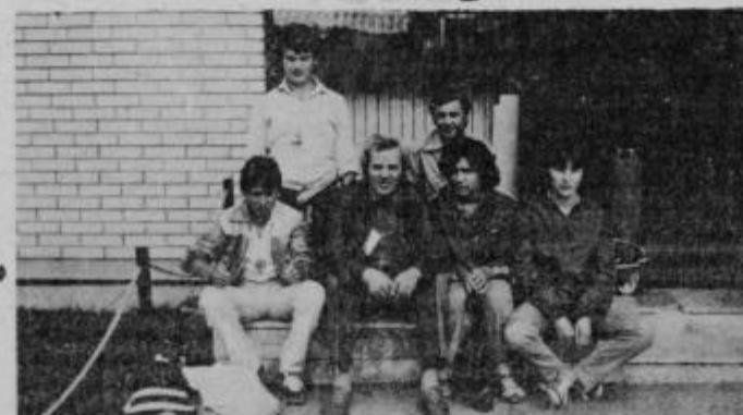
Na tekmovanju v Ribnici

Društvo ima okrog 60 aktivnih članov in članic, vendar je med njimi majhno število mladih. Pred dvema letoma je v društvu začela delovati pionirska desetina, ki se udeležuje pionirskih tekmovanj in srečanj. Da bi društvo pridobilo pionirje in pionirke, se je povežalo z OS Središče. Tako je leta 1980 začel na šoli delovati gasilski krožek, ki ga vodi član GD Slavko