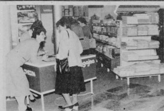
Notranjost preurejene prodajalne