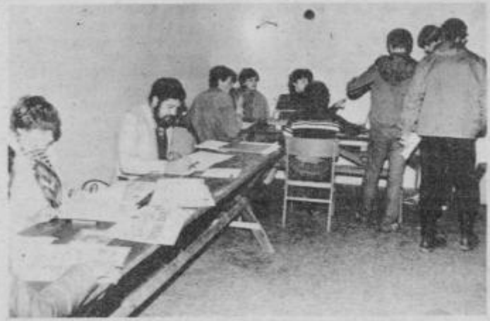
Obdelava podatkov — v prostorih OO ZSMS Šturmavec

Proga v Šturmovcu pri Vidmu je prijetna, prav primererna za tek v naravi, razpoloženje in verjetno tudi udeležbo pa je pokvarilo dokaj slabo vreme, ki je narekovalo prestavitve tekmovanja s srede na petek, toda tudi v petek je nagajalo. Prvenstvo so zelo dobro izpeljali OŠ Videm, OO ZSMS Šturmavec, TVD Partizan Videm, atletski klub Ptuj in ZTKO. Po prvenstvu so določili sestavo občinske reprezentance za nedeljski kros Dela, ki ji v Titovem Velenju želimo veliko uspeha!