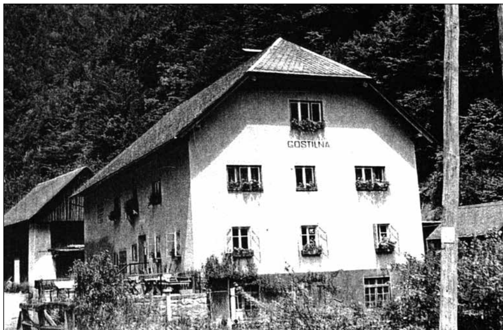
Podrošč – gostilna. Stanovanjska hiša je bila obnovljena leta 1953, fotografirano leta 1954.