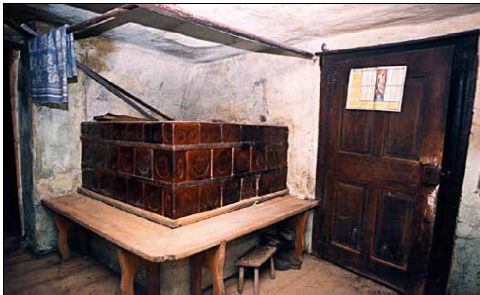
Kmečka hiša v Zali. Vhod v hišo in krušna peč.