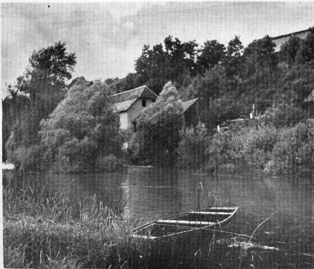
Trčkov mlin na Lahinji, v Beli Krajini

Pri zadnjih nemirih v Alžiriji je potegnil z upornimi generali prvi legijonarski polk parasov. Nikomur ljuba legija brezdomcev bo z uporom najbrž zgubila še zadnjo domovino, čeprav mačeho, Francijo.