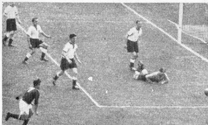
Nevaren položaj pred golom

Italija je nastopila v sledeči postavi: Buffon (Vavassori); Losi, Castelletti; Bolchi, Salvatore, Trapattini; Mora, Lojaco, Brighenti, Sivori in Corso. Mnenja o sestavi ekipe pa so bila zelo deljena, ker so se nekateri izkušeni trenerji (Viani, Rocco, Monzeglio in Cappelli) izrekli za naslednje moštvo: Cudicini (Buffon); Maldini (Losi), Castelletti; Bolchi, Sarti (Salvatore), Trapattini; Mora,