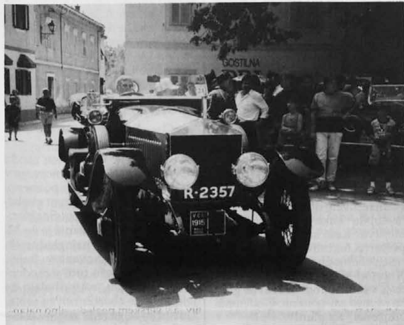
Rolls Royce iz leta 1915 med postankom v Vipavi (med vožnjo Dunaj-Trst-Dunaj) 1.7.1993. Voznik in sopotnica sta iz Velike Britanije