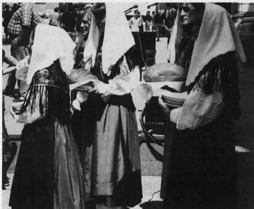
Slovenska dekleta s soljo in kruhom čakajo na stare Rolls Royce na glavnem trgu v Vipavi. (1.7.1993)

Da je Virgil Šček bil predvsem duhovnik, v ostalem zgovorno priča predvsem tole: 1. bil je pobudnik za ustanovitev Zbora svečnikov sv. Pavla, stanovske organizacije primorskih duhovnikov, ki je med obema vojnoma odigrala izredno pomembno vlogo: Šček je bil njen tajnik; 2. dal