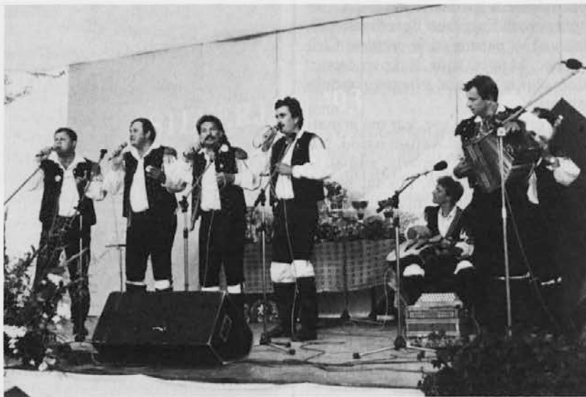
Ena od nastopajočih skupin na letošnjem festivalu v Števerjanu

V nadvse prijetnem razpoloženju, kot ga znajo iz leta v leto ustvariti prijazni Števerjanci, zbrani okrog KD Frančišek Borgia Sedej, je preteklo soboto in nedeljo ponovno zaživel festival domače glasbe, ki je letos doživel že 23. izvedbo. Prireditveni prostor pod borovci je pozno v noč odmeval ob zvokih sedemindvajsetih ansamblov — vsi so prišli iz Slovenije — ki so se potegovali za nagrade.