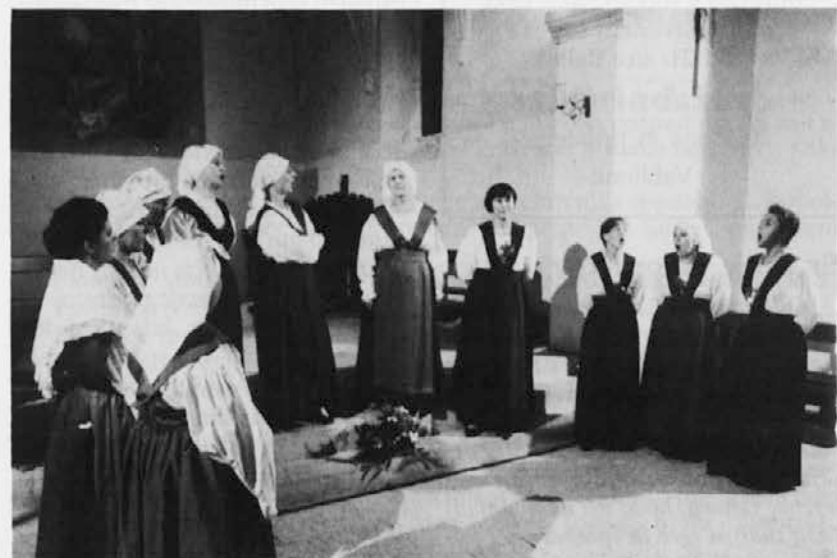
Ženska skupina Stu ledi med koncertov v dolinski cerkvici sv. Martina

Spored, ki ga je za to priložnost pripravila pevska skupina Stu ledi, je bil prijeten in zanimiv, obenem pa tudi tematsko povezan. Obsegal je pesmi z različnih področij — od Trsta do Istre, Benečije, Kanalske doline, Štajerske, Koroške, Bele krajine, Dolenjske in iz Trente, nekaj pesmi pa je bilo tudi v italijanščini in furlanščini. V pesmih, ki so jih zapele članice Ženske pevske skupine Stu ledi, so bili zajeti najpomembnejši trenutki v človekovem življenju, od rojstva do prve ljubezni, snubljenja, poroke pa tudi tragične smrti nezaželenega otroka ali nezvestega dekleta. Spored je na tem lepem in prijetnem pevskem večeru povezovala Damiana Ota. Najvztrajnejše pevke so ob tej priložnosti dobile Gallusove bronzaste in srebrne značke za dolgoletno »zvestobo« zboru.