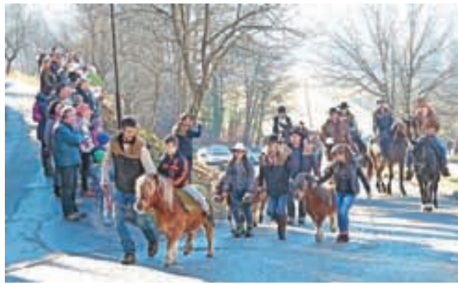
Člani Konjerejskega društva Tuhinj so blagoslov organizirali že dvajseto leto zapored.