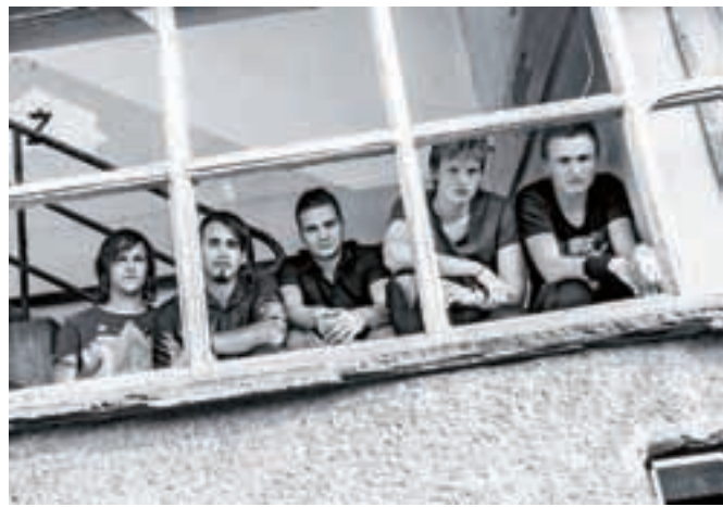
Fantje iz kamniškega rokovega benda Kalaie

Kalaio, kamniški rokovski bend, pozna prenekateri obiskovalec koncertov v mestu in okolici. Fantje so po šestih letih zorenja ustvarili svoj prvi album Psiholom, s katerim si bodo gotovo razširili krog poslušalcev.