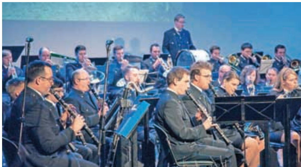
Člani Mestne godbe Kamnik na svojem tradicionalnem Prazničnem koncertu v Domu kulture Kamnik