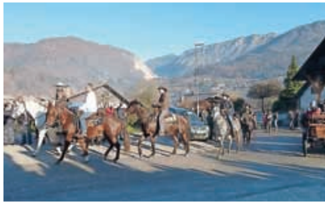
Člani Veronikine konjenice s svojimi konji v Zgornjih Stranjah

Konje so blagoslovili tudi v Godiču, Križu pri Komendi in nekaterih drugih krajih.