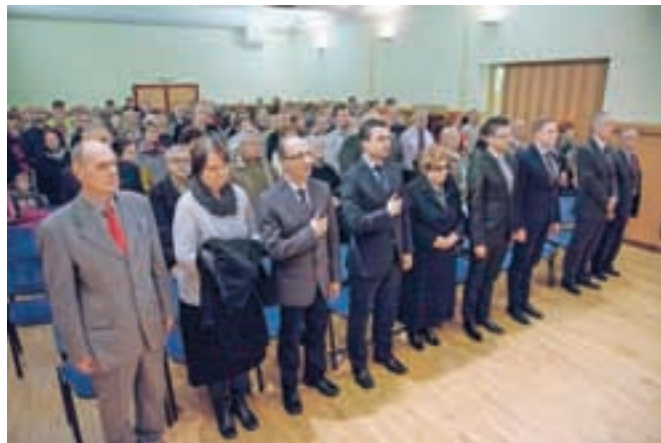
Zbrani ob poslušanju slovenske himne