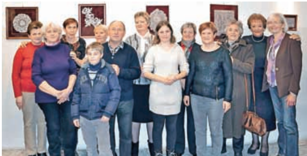
Članice in člana Klekljarskega društva Veronike iz Nevelj že četrtič razstavlajo čipkarske mojstrovine v občinski stavbi.