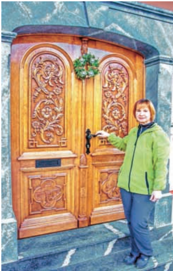
Anica Ahčin pred domačimi rezljanimi vrati

Že priznani slovenski arhitekt Peter Fister je v eni iz-