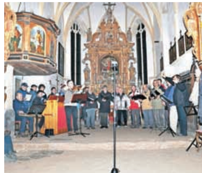
Kamniški liraši že trinajst let prepevajo Pevske jasli na Sv. Primožu.