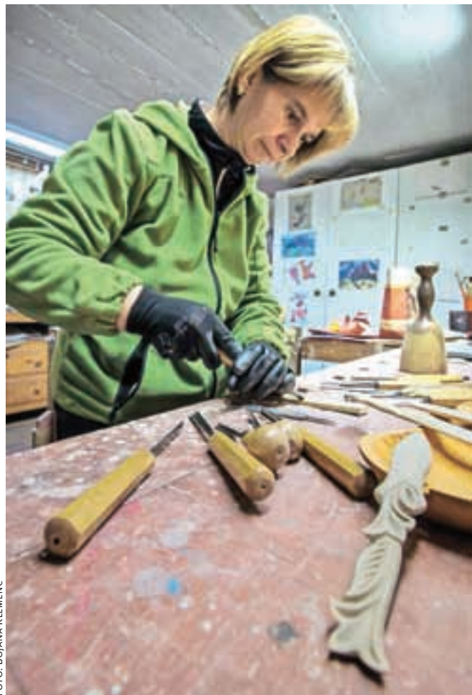
Rezbarske izdelke izdeluje predvsem iz lipovega lesa.

Kamnik – Mladinski center Kotlovnica bo konec januarja organiziral že tretji Festival svobodne video produkcije. »Namen festivala je dati priložnost neodvisnim produkcijskim skupinam in posameznikom, da pokažejo svoja dela in izmenjajo izkušnje s področja video produkcije. Festival ni žanrsko opredeljen, organizatorje pa poleg vsebine zanima predvsem presežki v uporabi produkcijskih tehnik in načinov izdelave del,« pravijo mladi iz Kotlovnice, ki so v lanskoletni izvedbi predvajali 28 izbranih video del v kategorijah dokumentarni, tabu, art, promo spot in igrani. Tudi letos k sodelovanju vabijo avtorje svobodnih video del, ne glede na način produkcije, ki so nastala v letih 2014 in 2015. Prijave (prek spletnega obrazca) zbirajo do nedelje, 17. januarja. Prispela dela bo pregledalo vodstvo festivala, najboljši filmi pa bodo nagrajeni z nagrado zlata ribica. J. P.