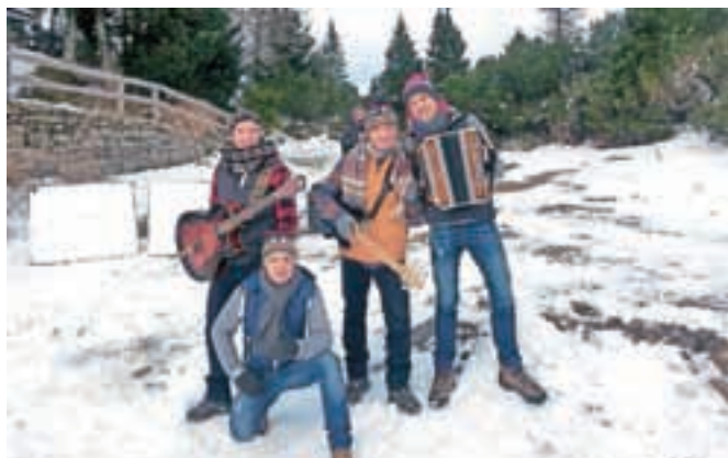
Fantje Skupine Špica pri snemanju novega videospota na Veliki planini

Fantje Skupine Špica so decembra na Veliki planini posneli videospot za svojo novo pesem.