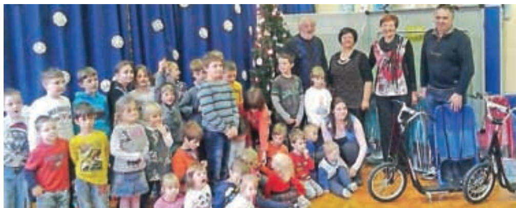
Motniški Polžki z učiteljicami in predstavniki Liste LTS – Za Kamnik