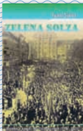
knjiga Zelena solza