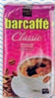
kava Barcaffé 250 g