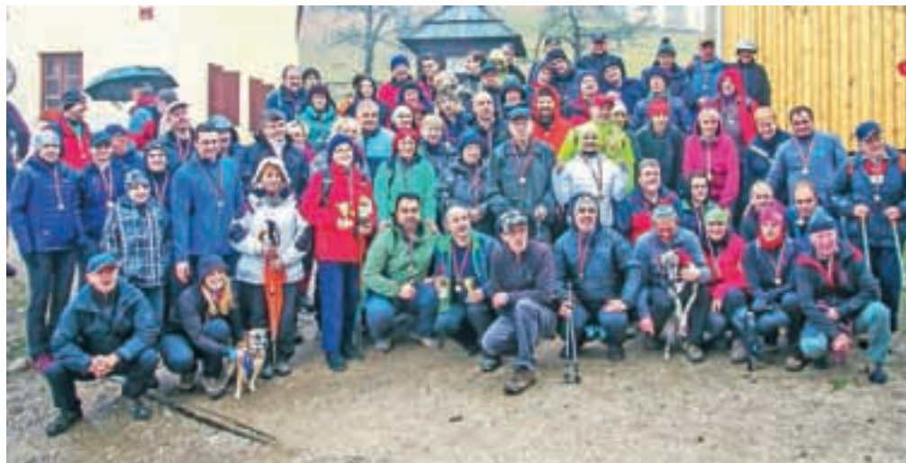
Navkljub slabemu vremenu se je na tradicionalni podelitvi priznanj zbralo veliko število pohodnikov na Sv. Primoža.