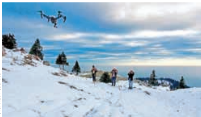
Velika planina se je znova izkazala za slikovito kuliso.