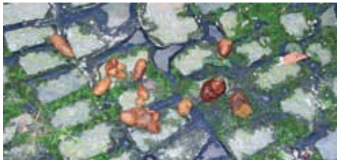
To vsekakor ne spada na mestne ulice, pa čeprav so samo tlakovane ...

Kamnik – Da smo se odvadili metati odpadke povsod, kamor se nam je zahotelo, je bilo treba kar veliko časa. Verjetno bo tako tudi, da se bodo lastniki psičkov navadili pobirati njihove iztrebke. Lepo bi pa bilo, da bi to delali že sedaj, posebno še tam, kjer je koš zanje samo nekaj metrov stran od mesta, kjer je psiček pustil svoj kakec. Vendar, bodimo optimisti ... B. P.