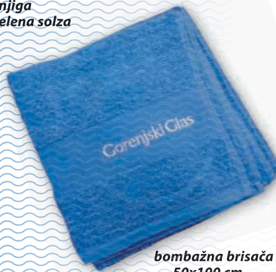
bombažna brisača 50x100 cm

Popust in darilo veljata le za fizične osebe. Daril ne pošiljamo po pošti. Količina daril je omejena.