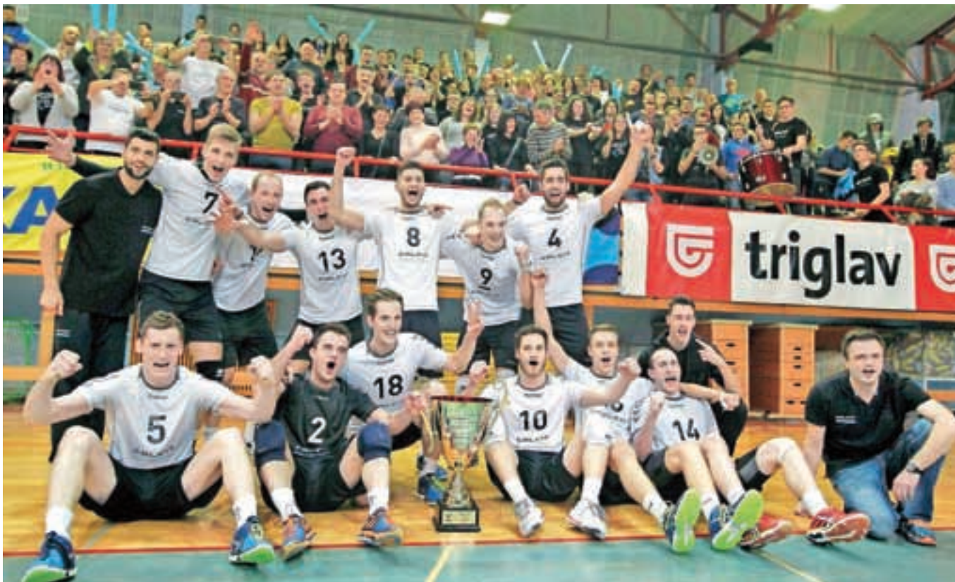
Odbojkarji Calcita Volleyballa s pokalno lovoriko

Odbojkarji moštva Calcit Volleyball so v nedeljo na finalu zaključnega turnirja Pokala Slovenije v odbojki, ki so ga gostili prav v Kamniku, premagali odbojkarje ACH Volley in si po petnajstih letih znova priborili naslov pokalnih prvakov.