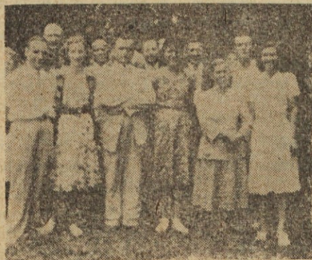
Odbor, ki je izlet organiziral. Algunas caras conocidas de la excursión a la Estancia San Juan.

Prečasno nam postalo je in sveto nad dolžnosti vse, podoba božjega dela: Saj z Jožefom Jezušček delal je!