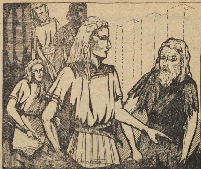
Radován se asustó de la severidad de Iztok . . .

Del bosque salieron las cabezas de otros cuatro caballos y por sí solos corrieron tras Tuñús. Todos sus jinetes montaron a la carrera, tirándose sobre las sillas, prepararon los arcos y tiraron a la cara de los perseguidores eslovenos sus flechas envenenadas. Iztok se dió cuenta en seguida que la persecución era inútil. Los bajos y cansados caballos nunca habrían alcanzado a los hunos. A los eslovenos en cambio,