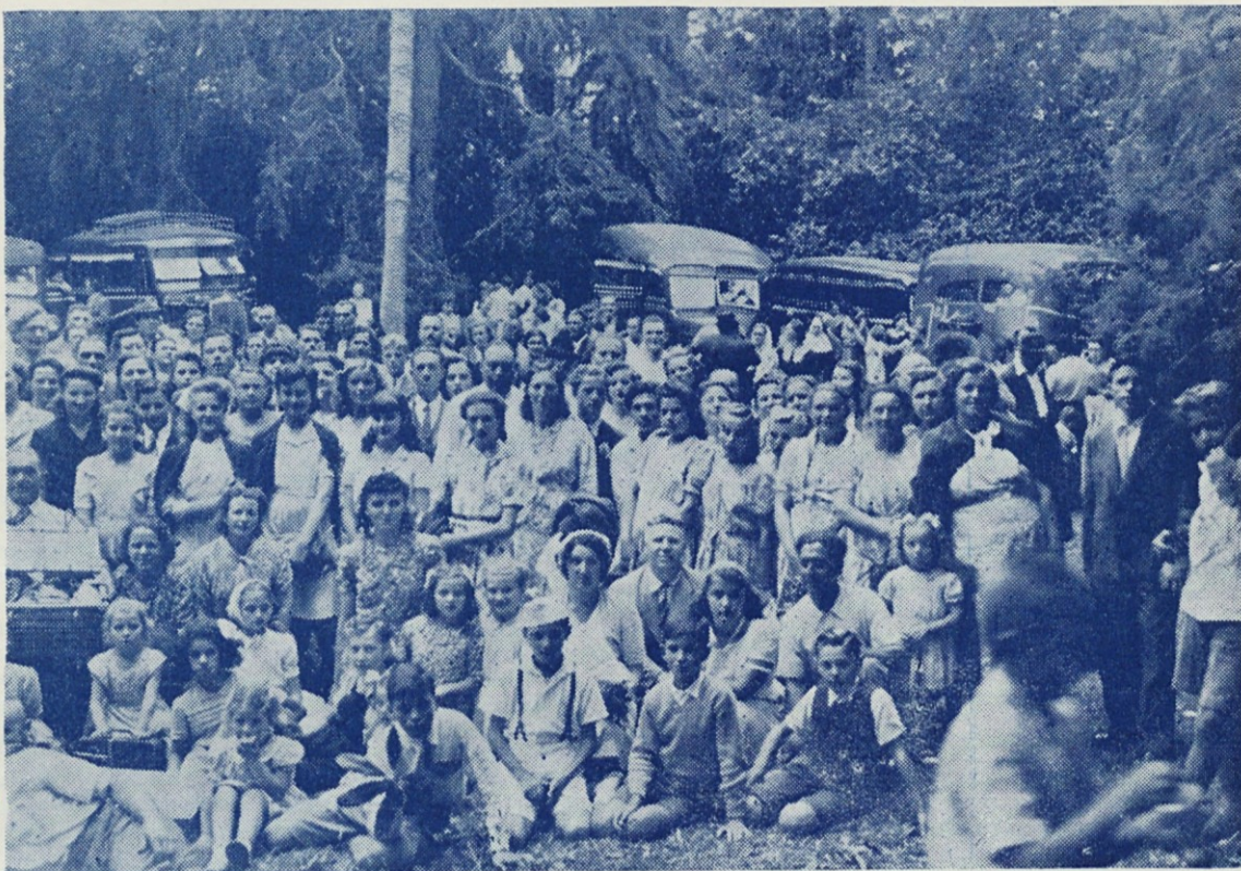
He aquí algunos grupos de excursionistas.

Los 12 coches llegaron sin ningún percance a su destino, y allí lo primero fué oír la misa. Algunos se sustrajeron a su deber pero bien arrepentidos reconocieron luego su error, pues por ellos nos visitó luego Dios con una ligera lluvia, que para premio de los buenos, después de una hora, cesó; facilitándonos así y a pesar de todo unas horas agradabilísimas que hicieron resonar nuestra alegre canción y risueño humor hasta que tocó la hora de reunirnos en la iglesia donde celebramos nuestra acción de gracias y nuestra despedida, regresando todos felices, contentos, con gratos recuerdos y agradecidos a Dios, que nos brindó un día tan agradable, mientras llovía en la Capital y en otras partes.