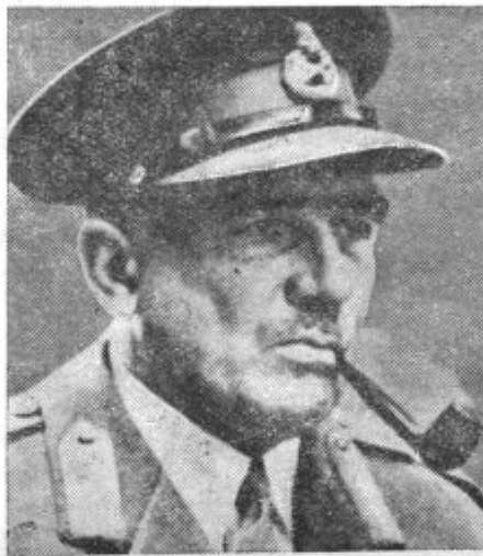
Angleški general E. Ironside

■ Rusko časopisje hudo zamerja finskim po licijskim oblastem, ker so na večih krajih preganjale ljudi, ki so se zavzemali za ozko povezanost Finske s Sovjetsko Rusijo in za čim