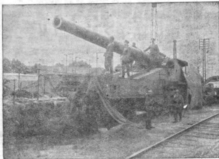
Levo: Francoski železniški top na tračnicah, ki so ga Nemci uplenili, še preden so mogli Francozi z njim oddati le en strel. Desno: Kancelar Hitler med svojimi častniki za časa bojev v Franciji

„Kmetijski list“ izhaja vsako sredo. Naročnina znaša letno 30 din, pollet. 15 din, za inozemstvo letno 50 din. Inzerati po tarifi. Pismenim vprašanjem naj se priloži znamka za odgovor. Nefrankirana pisma se ne sprejemajo. — Rokopisov ne vračamo. Plača in toži se v Ljubljani. Uredništvo in uprava je v Ljubljani v Kolodvorski ul. št. 7. Telefon inter. št. 32-59. Račun pri poštni hranilnici št. 14.194.