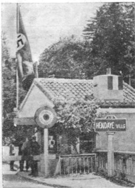
Hitlerjeva zastava plapolja na francosko-španski meji

■ Tako znajo samo Rusi. Te dni je bila odpravljena železniška proga, ki veže Leningrad