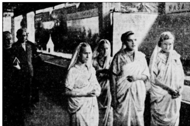
Nastop deklet v indijskih oblekah (vir: Kos bajne Indije 1937: 5).

V osmem razdelku so predstavili velike portrete misijonarjev in indijsko umetnost. Deveti del razstave so posvetili indijski mitologiji in kulturi. Religija je bila ponazorjena s kipi in slikami božanstev, z »bogoslužnimi in čarovniškimi predmeti raznih verstev in pokrajin« (Obiščite vsi 1937: 34), kultura pa z vsakdanjimi predmeti in domačo umetnostjo. Zadnje tri razdelke so posvetili misijonski praksi, najprej s prizorom iz misijonskega življenja, nato z upodobitvijo smrti sv. Frančiška Ksaverija in nazadnje s tremi zvonovi, ki so bili namenjeni v bengalski misijon. Razstavo je dopolnil misijonski bazar z ročnimi deli, vezeninami ipd.