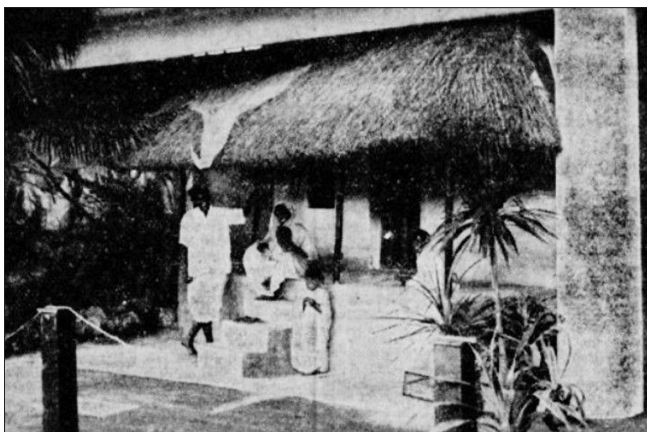
Fotografija »bengalske hiše« na Ljubljanskem velesejmu.

kosti 1 : 100. V četrtem delu razstave sta bila v merilu 1 : 10 poustvarjena palača zamindarja, indijskega veleposestnika, in bengalski trg. Ob miniaturah stavb so predstavili še različne prebivalce, fakirje, trgovce, kmete, obrtnike ipd. Morda so za ponazoritev teh poklicev in družbenih skupin uporabili skupino kipcev iz indijskega muzeja, ki je danes v zbirki Slovenskega etnografskega muzeja.