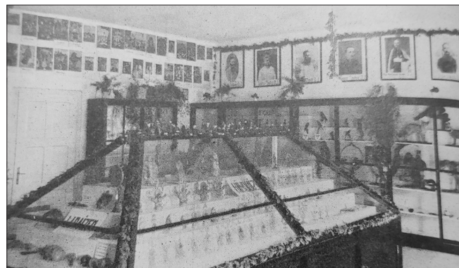
Dvorana indijskega muzeja v cerkvi Sv. Jožefa v Ljubljani.

Zapuščini jezuitskega muzeja in muzeja Klaverjeve družbe sta po spletu srečnih okoliščin kljub zelo turbulentnemu zgodovinskemu dogajanju sredi 20. stoletja v razmeroma dobrem stanju preživeli do danes. Zbirki, ki sta ostali v Slovenskem etnografskem muzeju, sta bili že in bosta brez dvoma še predmet raziskav (prim. npr. Frelih in Koren 2016). Pričujoči članek je posvečen razstavni obliki, ki je bila po svoji naravi bolj prehodna oz. začasna in je za njo zaradi tega ostalo tudi precej manj otipljivih sledi – misijonskim razstavam. Te so bile v 30. letih 20. stoletja v slovenskem prostoru sorazmerno pogoste ter presenetljivo priljubljene in odmevne.