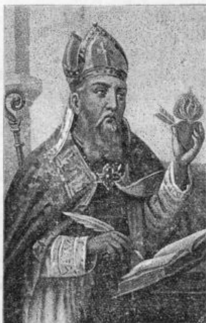
Sveti Augustin vžgan od Bože ljubézni.

Tak se je dokončalo to lepo življenje. Zaistino kakše je bilo njeno življenje, takša je bila tudi smrt. Z čudami jo bilo puno to življenje, med čudov je tudi zaprla oči svoje. V tujinski zemli more počivati njeno mrtvo telo, na bregi poleg morja jo je pokopao Augustin, tak je štela ona sama, kda pravila: »tū pokopajte vašo mater« — i ne dopustila, ka bi Augustin njeno mrtvo telo nazáj spravo v Afriko, gde je njeni mož, Patricius, počivao pa