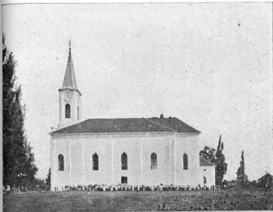
Čerensovska cerkev, v šteroj se je dosta molilo za izdávanje Marijinoga lista.

Pa to so samo zvünešnji sadovi. Znotrašnjih je dosta več, šteri se ne dájo odkrivati, ár se v dni srca i dūše zoriyo i na večnost doltrgajo. Këliki so se povrnoli po