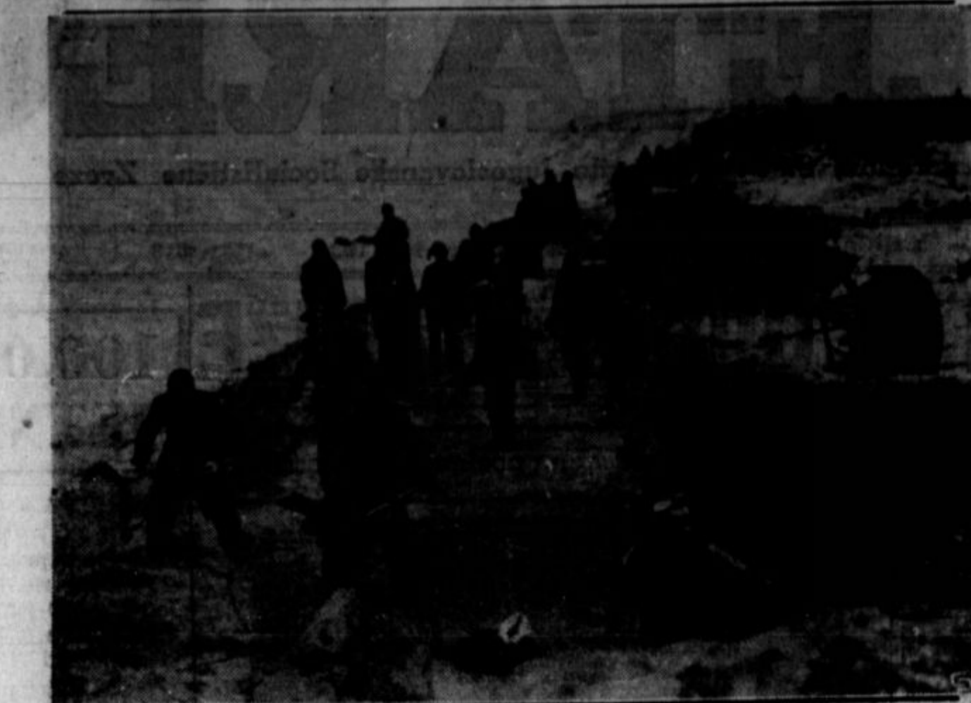
CWA je uposila na stroške zvezne vlade tisoče delavcev pri tlakovanju cest in ulic, čiščenju bregov ob rekah in jezerih, kanalov itd. Administracija smatra, da je boljše, ako delavci svojo brezposelnostno podporo za- služijo, kot pa da je bi prejeli zastoj. Na tej sliki so delavci CWA v Clevelandu ob obrežju jezera.