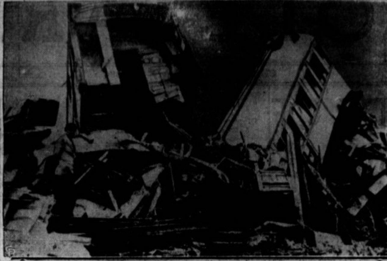
Na sliki so razbiti vagoni brzovlaka, ki je vozil med Barcelono in Sevillom v Španiji. Ta nesreča se je zgodila v času nedavnih iz- gredov, ki so jih vodili sindikalisti in anar- histi. Oblast je obdolžila anarhiste, da so podminirali most, preko katerega je vozil vlak in povzročili katastrofo. Dvajset ljudi je bilo ubitih.