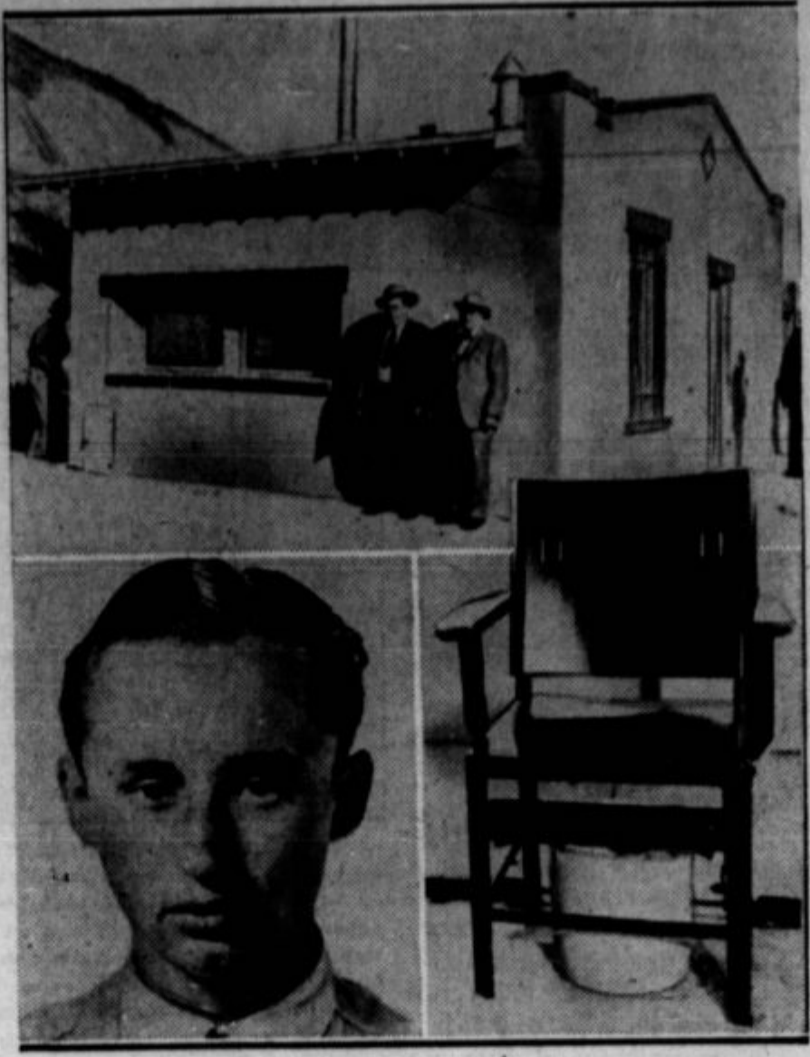
Država, Colorado bo v bodoče jemala svojim na smrt obsojenim jetnikom življenje s plinom. Na sliki na vrhu je nova plinska celica na dvorišču v državi kaznišnici v Canon Cityju. Spodaj na desni je stol, na katerega posade jetnika in pod stolom je posoda, iz katere izpuste plin. Celica ima okna, skozi katere se lahko opazuje jetnika pri umiranju.