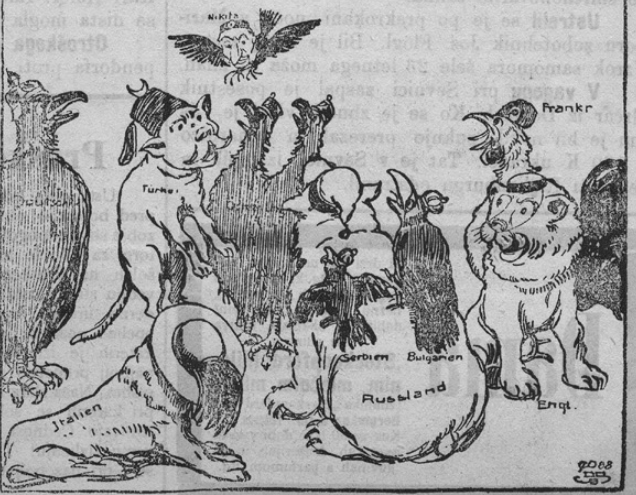
Die Panik im europäischen zoologischen Garten — oder der wahnsinnig gewordene Zaunkönig.

Zadnje čase se je zopet mnogo v Črnigoti govorilo; vsi važni politični dogodki so bili zaradi dogodkov v tej državi za trenutek pozabljeni. Na to dejstvo se zanaša tudi današnja politična karikaturna. Sužek ali palček (Zaunkönig) je najmanjši ptič; vendar pa je hotel postati kralj vseh živali. Naša slika kaže nato bajko in omeni to za njen napis: »Panika in evropskem zoologičnem vrtu ali znoreli palček«. Mi vidimo nemškega orla, turškega mačka, italijanskega leva, drogovnega avstro-ogrškega orla, nadalje ruskega medveda, kateremu sedijo srbska in bulgarska vrana na hrbtu, angleškega leva in francoskega petelina! Vsi so grozno razburjeni, kajti nad njimi frči prevzetni palček, črnogorski kralj Nikita. . . Slika bo gotovo mnogo smeha vzbudila.