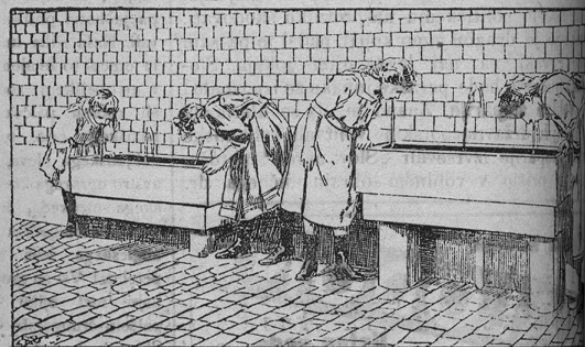
Mundpflege in den Schulen.

Usta čista držati se pravi zobe pred boleznijo obvarovati. In zdravi zobje so predpogoj za dobro prebavo, torej za celotno zdravje. V nemških šolah na Pruskem so se tega gesla vedno strogo držali in so vedno moderne uredbe vpeljali. Zdjaj so vpeljali posebne vrste studence, pri katerih je izmivanje ust najlažje in najbolj primerno zdravstvenim predpisom. Naša slika kaže take studence, pri katerih se šolska dekleta usta izmivajo. Čednost je predpogoj zdravemu življenju! Tega načela naj bi se i pri nas bolj držali!