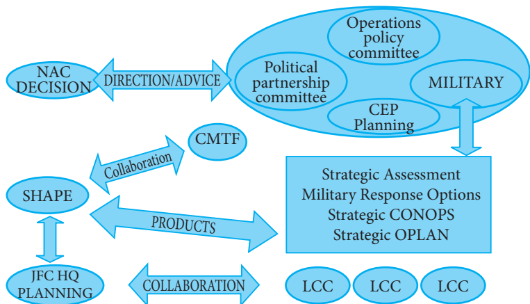
Shema 2: Kolaborativno načrtovanje na strateški ravni