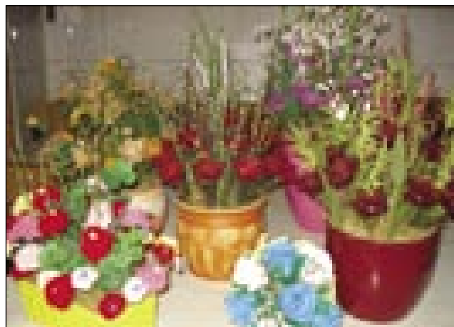
Mala hišna razstava

»Nika te te pisti, ka vse brige pozabiš na tisti čas, gda tau delaš. Te samo na tau koncentriraš, pa se veseliš, gda z edno lepo raužov zgotauviš.«