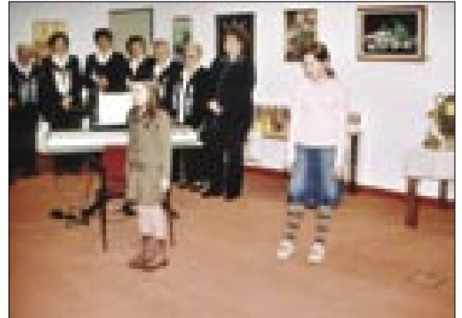
Prireditev pred veliko nočjo se je odvijala v Pokrajinski in študijski knjižnici v Murski Soboti

V Društvu upokojencev Murska Sobota se dobro zavedamo, kako lepo je, ko imaš prijatelje ne samo doma, v domači pokrajini, temveč tudi izven meja. Če se pa oglasi še lepa, stara slovenska pesem, začutiš, kako je lepo zapeti s prijatelji ali poslušati, kako zapojejo.