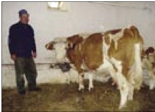
Ropoševi na Verici majo ešče krave

Ka mo pa nesli - so me pitali, vejpa nika svojoga nemamo. Rejsan je tak žalostno pri nas, ali samo vūpanja nemamo do naših izdelkov? Iz kmetijskoga ministrstva so nas parzvali, ka naj poglednemo, kak vōgleda senje »vesi v varaši«. Ranč tašo senje bau v Maribori, gda mo že mi tō zraven. Slovenski pavri s cejloga orsaga so prinesli svoje dobrote v Ljubljano pa tam odavali. Bilau je tam vse: krū, mesau, sir, vino, žganje, med pa vse, ka doma parpauvajo. Pauleg nas so pa prišli Slovenci iz Italije pa z Avstrije tō. Moram povedati, ka pri njin je malo ovak, majo svoje zveze,