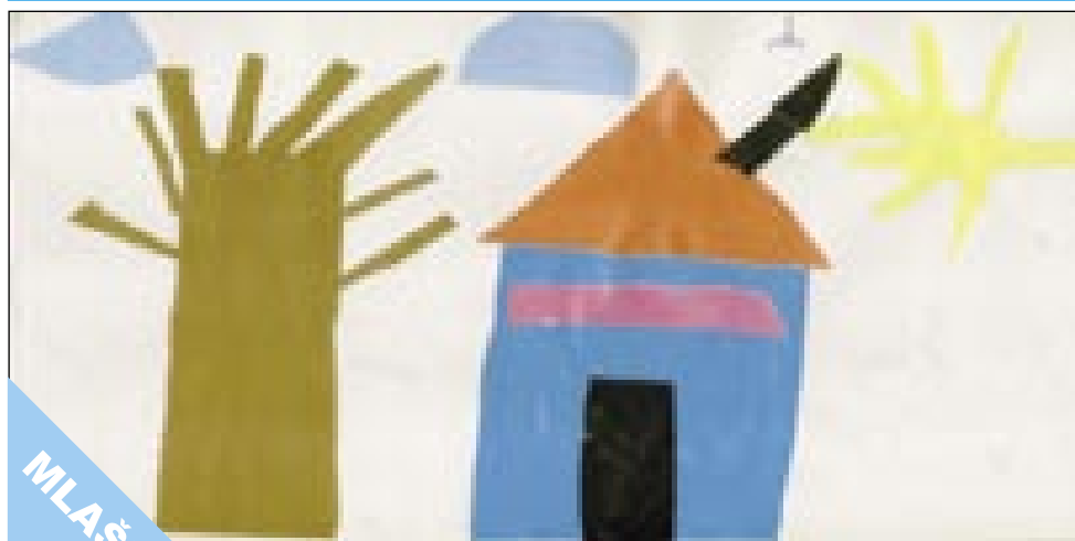
Pripravil: Kevin Kalamar, Vrtec Sakalovci