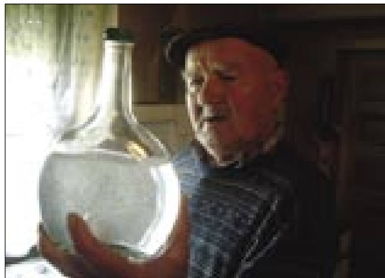
Fotografija z naslovom »Elikvir«

tau leko napravim. Dostokrat je tak, ka trištiri vöre tö nücam, dočas kaulek dem pa kaj najdem. Leko bi posliko, ka v prvom momentu zagledam, samo meni se tisto ne vidi, dja iščem taši moment, tašo kompozicijo, ka se meni vidi. Tauma pa čas trbej. Dje tak, ka dem slikat pa kumaj