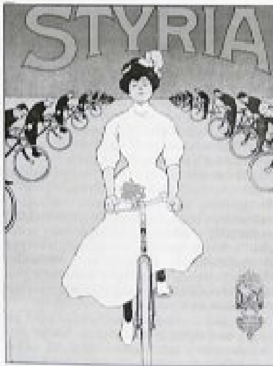
Plakat, ki vabi na kolesarsko dirko s Puhovimi kolesi Styria, naslovnica Historisches Jahrbuch der Stadt Graz, zvezek 22/23, Bouvier - Valentinitisch

Zato arhivski delavec nikoli ne sme reči, da kakega podatka ni. Ni ga morda neposredno, posredno pa zagotovo je.