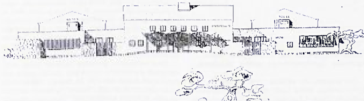
Skica restavracije in kavarne v Novi Gorici, 1951. Pokrajinski arhiv v Novi Gorici, Okrajni ljudski odbor Gorica, l.c. 486