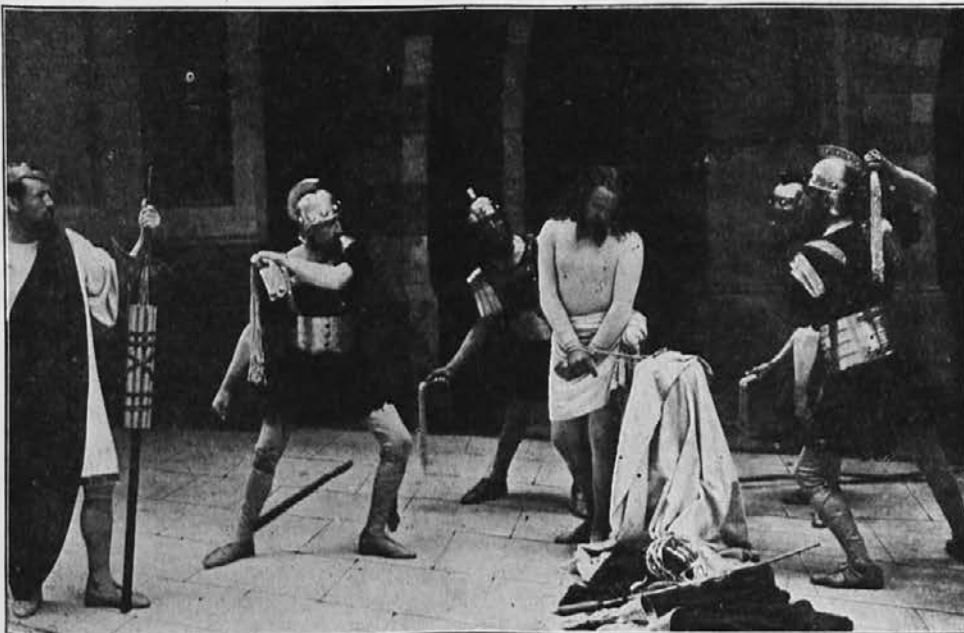
Ki je za nas bičan bil.

Možje in žene. Vam ki imate Ave Marijo in jo berete upam še ali že sije to oživljajoče pomladno solce, drugače bi ja ona ne imela vstopa v vaše družine. Morda ga tu in tam zakrije kak oblak, a se kmalu zopet pokaže. Toda, moj Bog, koliko je še zakonskih parov, kjer se dan na dan bliska in treska. Tudi te bi Ave Maria rada rešila iz zakonskega pekla in jim nazaj priborila košček raja. Pomagajte ji, da jim poda rešivno roko! Tu pri korenini, pri temelju družinskega kroga moramo začeti, če hočemo kedaj vzgojiti družinske kroge, kakor ga nam kaže naslovna podoba, sicer bi začeli hišo graditi pri strehi.