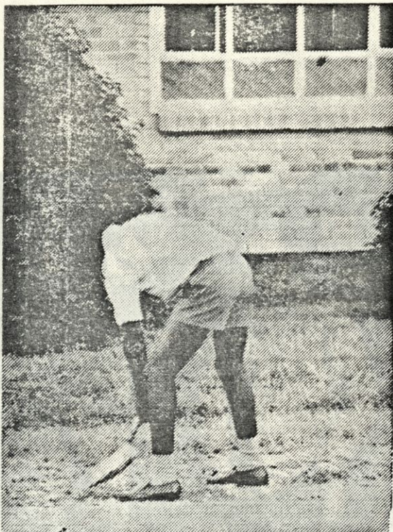
ZAMBIJSKI DIJAK CISTI OKROG SOLE