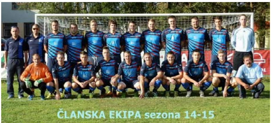
ČLANSKA EKIPA sezona 14-15

Vse selekcije so v novembru zaključile s prvo polovico tekmovanja prvenstva MNZ lige Ljubljana. Najmlajša ekipa do devet let se je z dobro igro uvrstila na sam vrh lestvice, ekipa U11 pa je po prvi polovici tekmovanja prav tako v družbi ekip, ki so uvrščene v zgornji del lestvice. Mlajši dečki so z dvema krogooma manj odigranih tekem trenutno na 8. mestu, ekipa starejših dečkov pa je po jesenskem delu uvrščena na 4., vendar le z dvema točkama zaostanka za prvouvrščeno ekipo Kamnika. Mladinci so končali na sredini lestvice, prav tako ekipa deklet, ki je s tekmo manj trenutno četrta. Veterani se letos kosajo z pomlajenimi ekipami in so uvrščeni