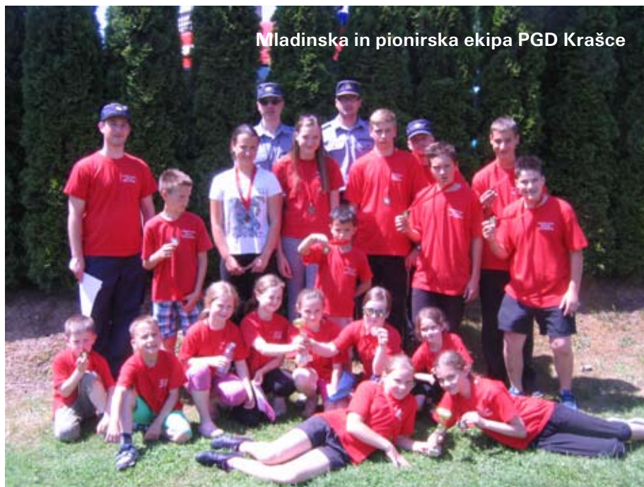
Mladinska in pionirska ekipa PGD Krašce

Udeležili smo se operativnih vaj v vseh sosednjih društvih. V Kraščah smo imeli operativno vajo treh dru-