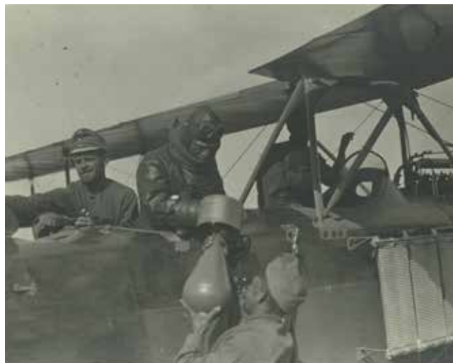
Albatros B.I Ba 23, nalaganje bomb v letalo – soška fronta