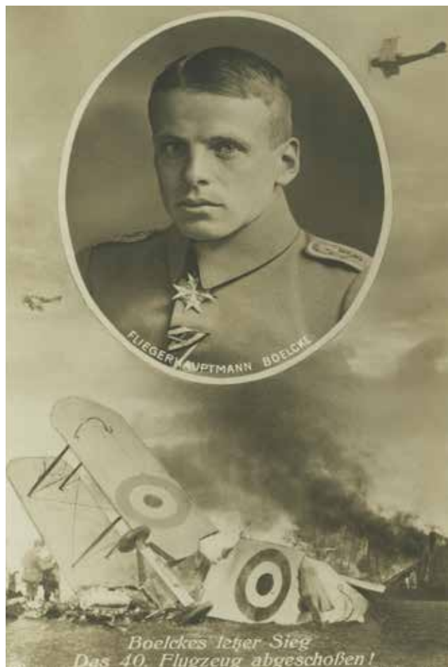
Letalski as 1. svetovne vojne, letalski kapetan Bölke, njegova 40. zračna zmaga

Za pomoč in nasvete bi se na koncu rad zahvalil mag. Tomažu Kralju, mag. Zori Torkar iz Medobčin-