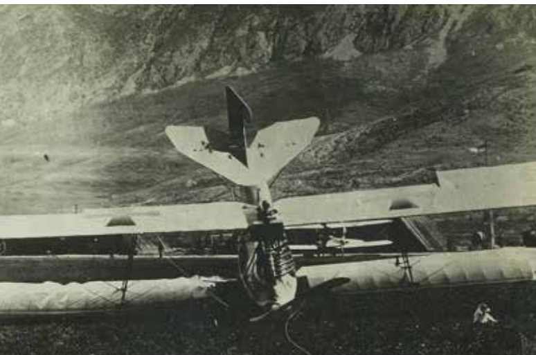
Grd pristane letala Brandenburg Cl. 129, letališče v Vipavi – soška fronta

svetovni vojni uporabljala letalstvo najprej za opazovanje sovražnika ter vzdrževanje zveze s topništvom. Pozneje, ko so razvili lovska letala, ki so bila opremljena z orožjem, se je začel boj za prevlado v zraku. Floyd Gibbons je o tem napisal odlično knjigo o letalskem asu z naslovom Rdeči baron. Vedeti pa moramo, da so bila letališča v zaledju (kot na primer Stražišče pri Kranju ali Trzin) bolj izjema kot pravilo, saj je bila večina letališč na obeh straneh fronte v neposredni bližini bojev. 3