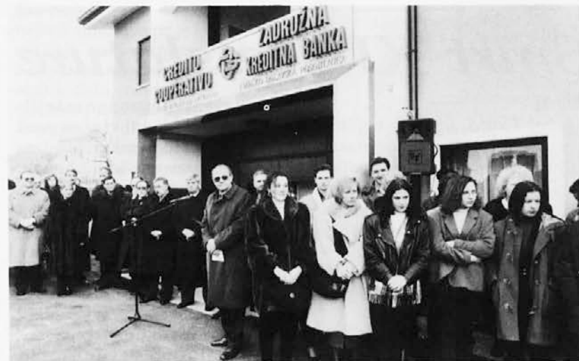
Posnetek s slovesnega odprtja nove podružnice v Štandrežu

Sovodenska Hranilnica, ki deluje že polnih 86 let in trenutno šteje preko 250 članov, namerava z odprtjem novega sedeža še utrditi obseg poslovanja in se približati svojim številnim strankam. Novi prostori med drugim odpirajo nove možnosti tudi glede kadrovskega zaposlovanja, saj je doslej delno tudi prostorska stiska onemogočila razširitev delovanja.