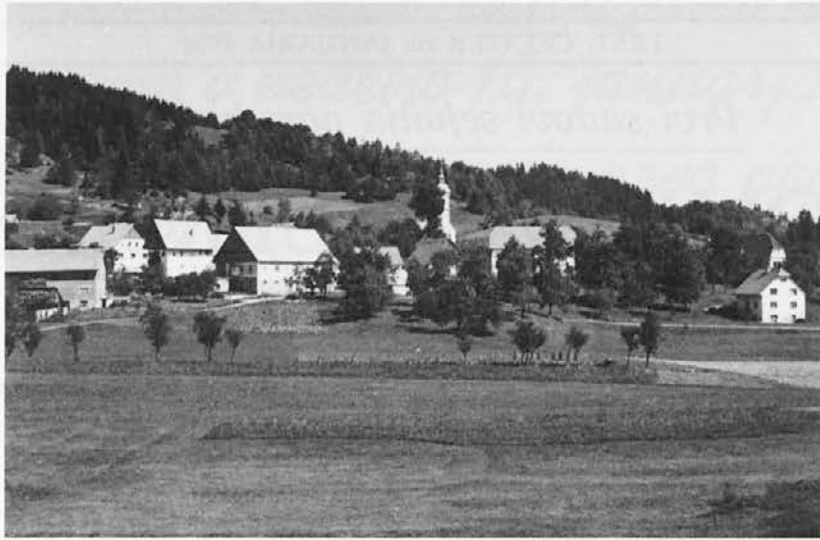
Ledine nad Idrijo