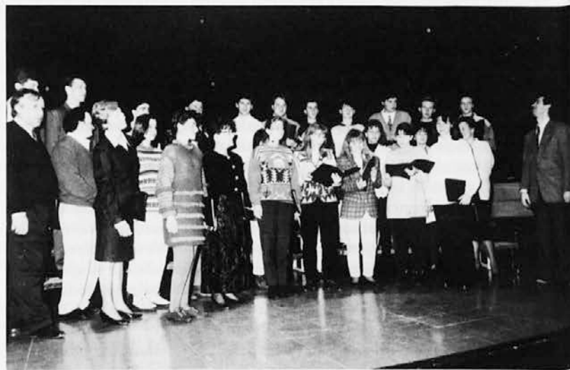
Nastopajoči na odru Sedejevega doma

V Sedejevem domu v Števerjanu je bilo v četrtek, 13. januarja, slavje ob 25-letnici rednega izhajanja »Števerjanskega vestnika«. Prva številka tega vaškega glasila je izšla 12. januarja 1969. Proslava je potekala v prijetnem domačem vzdušju. Pričela se je z nastopom moškega pevskega zbora »F. B. Sedej«, ki je oblikoval kulturni del sporeda. Nato je spregovoril predsednik istoimenskega domačega društva, ki je najprej prisrčno pozdravil vse prisotne, nato pa je povedal nekaj zanimivih podatkov o samem »Števerjanskem vestniku«, o njegovem delovanju, težavah in uspehih.