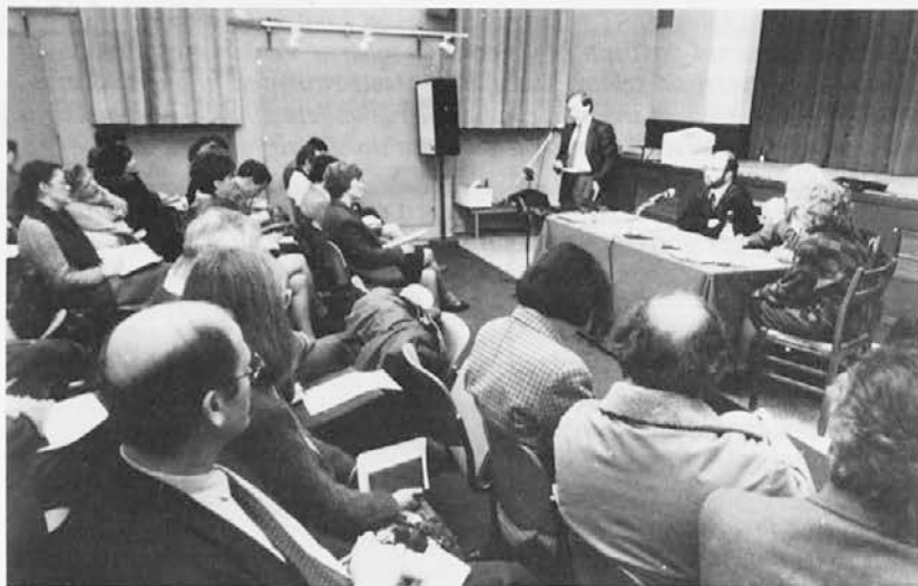
Tako je bilo na občnem zboru SSS na Opčinah

»Včasih smo sami krivi, če ne uveljavimo možnosti, ki jih na področju šolstva določa zakon«