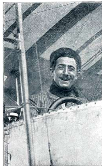
PAULHAN OB KRMILU SVOJEGA AEROPLANA

Danica. Koledar i letopis društva svetojeronimskoga za godinu 1910. — 8 o , str. 358. Cena 40 vinarjev. Ta najbolje urejevani in najbolj razširjeni hrvaški koledar je tiskan letos v 50.000 iztisih, a druge društvene knjige v 30.000 iztisih. Po koledarskem delu so natisnjeni društveni poverjeniki in novi člani, ki so se zapisali v društvo leta 1908. V članih pokazalo je društvo lep napredek, kakor ni bil še nobenega leta; letnih članov, ki plačajo na leto eno kruno, zapisalo se je 9000, za 2500 več kot l. 1907., a dosmrtnih članov 1094, za 412 več kot prejšnjega leta. Iz društvenega letopisa izvemo, da je bilo v društvu mnogo življenja in da je odbor vestno izvrševal svoje dolžnosti in skrbel, da člani dobe mnogo in zdravega berila, in se trudil, da društvo med Hrvati čim bolj razširi. Društveni zakladi se lepo množe, sedaj je že 17 zakladov, katere so razni domoljubi osnovali za nagrado piscem in pa zato, da se vsako leto v raznih krajih vpiše v društvo nekoliko novih dosmrtnih udov. Ti zakladi štejejo skupaj 43.100 K 59 v, a vse društveno premoženje znaša 307.246 K 4 v.