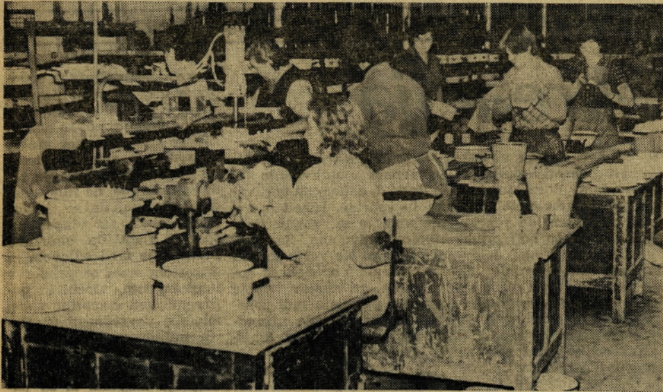
Tudi ob delu se lahko vsakdo izobražuje