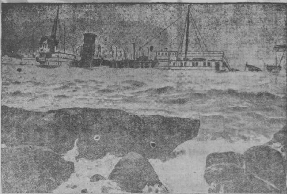
Ameriška ladja, ki se je potopila v Kitajskem morju.