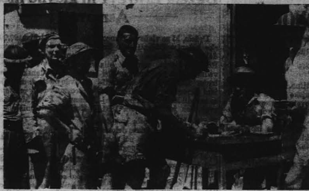
Angleški vojaki, ki branijo Tobruk v Libiji, čakajo v vrsti za svojo plačo.