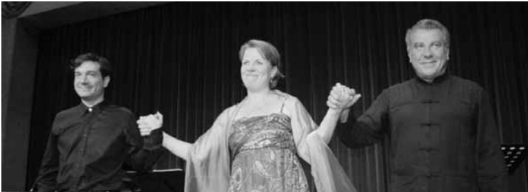
Vsi trije umetniki

sta se ponovno vrnila v Slomškov dom velika in odmevna