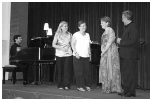
Priložnostni »kvartet Finkovih«