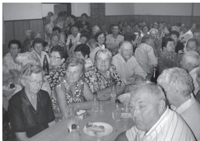
REKORDNA UDELEŽBA UPOKOJENCEV NA SREČANJU V TEŠANOVCIH – Na 12. poletnem srečanju v vaško-gasilskem domu v Tešanovcih se je zbralo blizu 310 upokojencev iz celotne občine. Ob Marjeticah je nastopil še ljudski ad hoc ansambel Zvonček s pevkama. O njihovih zabavljivih nastopih bomo še pisali.