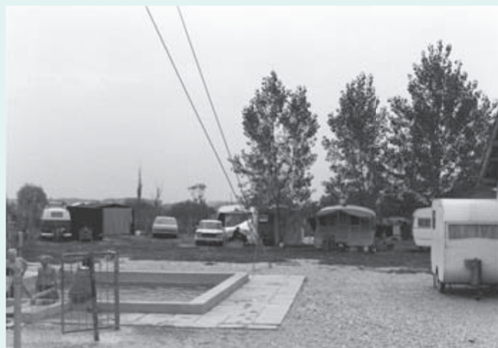
1962 – Avstrijci so postali glavni kopalci in prvi gostje divjega avtokampa, ki so si ga omislili kar po svoje.

Kljub spodbudnim začetkom pa se odgovorni v političnih strukturah prej ko ne tisti čas nagibali k odločitvi, da se vrtina zapre in zabetonira, saj prave pobude oziroma zanimanja iz gospodarstva, torej iz Radenske, ni bilo, še manj kakšnega spodbudnega namiga iz republiških gospodarskih ali političnih krogov. Prizadevanja posameznikov iz vaše skupnosti so bila skorajda vsiljiva, da ne rečemo moteča. Zato ni čudno, da je okrajna sanitarna inšpekcija kmalu dobila naročilo, naj ukrepa. Od Nafta Lendava je zahtevala, naj kopanje ob vrtini prepove. Kmalu se je tam znašla