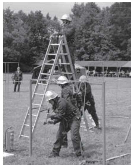
SEKTORSKA GASILSKA TEKMovanja – Na Ivancih, v Krncih in Selu so pripravili sektorska tekmovanja operativnih enot PGD – tokrat z mokro taktično vajo. Nastopilo je kar 38 enot iz vseh 27 društev. Občinsko tekmovanje bo 29. avgusta v Selu.

OAZA PRI MLAJTINCIH: POHOD S PALICAMI – Na vsesplošni razmah nordijske hoje se je odzvala tudi Občinska športna zveza Moravske Toplice in konec junija s startom in ciljem pred gostiščem Oaza pripravila 1. pohod z nordijskimi palicami. Lokacija ni bila izbrana naključno, saj sta tu trasirani kar dve pohodniški poti, na 5 in 8 km, mimo je speljana tudi pohodniška Panonska pot. Prireditve bi naj postala tradicionalna. (G. G.)