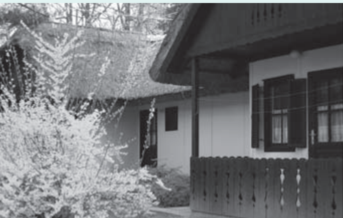
Prijazen domačijski videz s slamo kritih hišic v prvem apartmajskem naselju.

Moravske toplice so bile zame lani odkritje – zlasti me je presenetila voda, ki mi je s pitjem in kopanjem odpravila želodčne težave. Tudi razvoj preseneča, saj se je kolektivu posrečilo v kratkem času napraviti viden napredek. Še pridem!