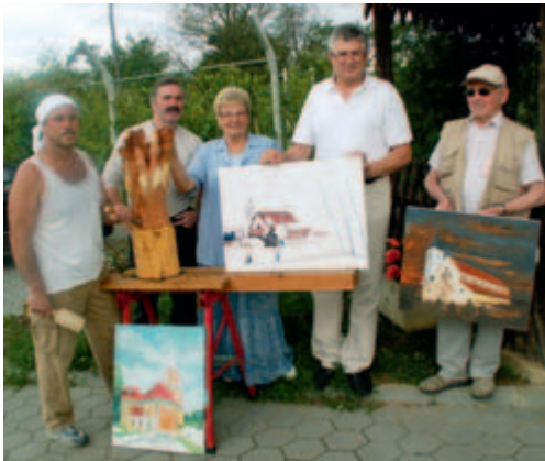
Udeleženci kolonije v Bogojini s svojimi deli.

Sekcija LIKOS, ki deluje pod okriljem KUD Štefan Kovač Murska Sobota in šteje 23 članov, je lani praznovala 45-letnico delovanja. V organizaciji LIKOS-a že od leta 1991 poteka v Bogojini konec junija ali v začetku julija tradicionalna likovna kolonija, torej se je letos zvrstila že osemnajsta. Od leta 1992 prirejajo tudi razstave del s kolonije v okviru Košičevih dnevov kulture .