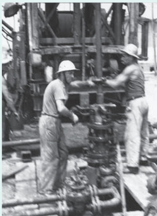
1960 – Beli rudarji iz Lendave so iskali nafto na travniku pri Moravcih, nedaleč od potoka Lipnica. Namesto nje je iz vrtine, poimenovane Mt-1, pritekla vroča voda. Ta je v naslednjih letih zgodovino tega majhnega kraja med Tešanovci in Martjanci postavila na glavo.