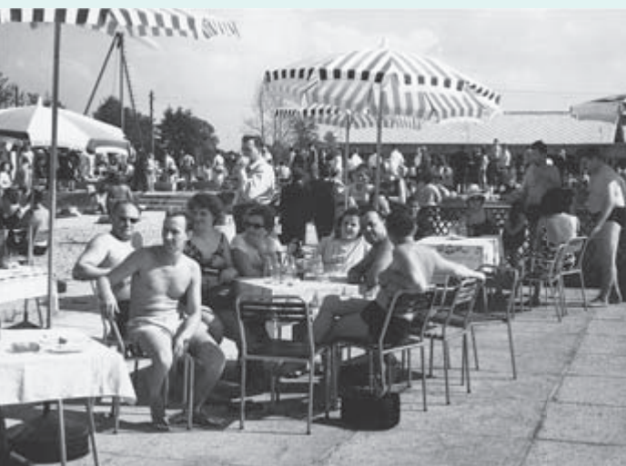
1964 – Republiški sekretariat za zdravstvo je razglasil moravsko termalno vodo za zdravilno. Gostov je bilo že tako in tako veliko, ne glede na dan v tednu ali mesecu.