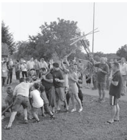
POSTAVLJANJE KLOPOTCA – Marsikje na našem vinorodnem območju so okoli velke meše, sredi avgusta, postavili klopotec in mu »naložili«, da odganja škvorce in druge ptiče. Postavljanje je že zdavnaj postalo prijetno druženje, zato so ga v Martjancih (na fotografiji) postavili kar v športno-rekreacijskem centru, kjer je trta sicer zasajena, a še leta ne bo obrodila.