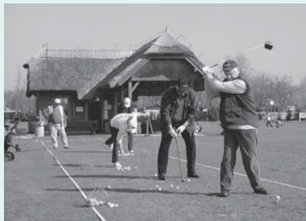
1998 – Igrišče za golf: za začetek so uredili vadišče s tremi luknjami. Prvič so ga razširili v letu 2001, dogradili pa 2005.