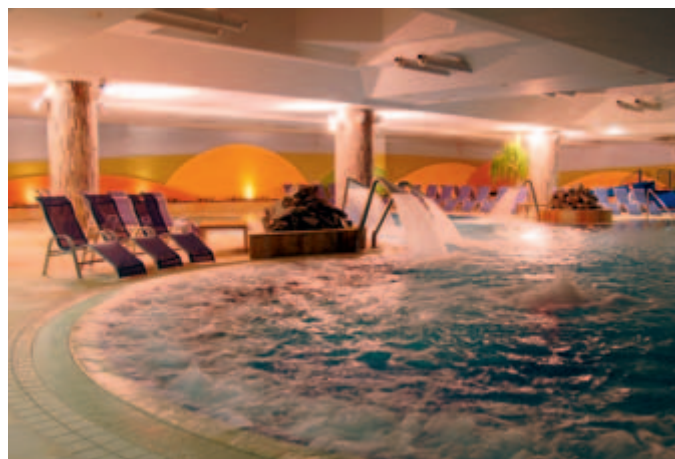
V doživljajskem svetu Term 3000 vas pričakuje več kot 25 zunanjih in notranjih bazenov, tobogani in pustolovščine s štrkom Vikijem.