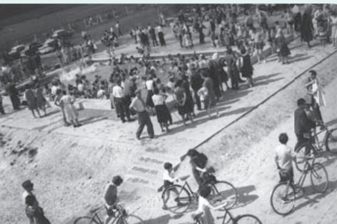
1963 – Ob sobotah in nedeljah ter praznikih je Moravce obiskalo tudi tisoč gostov in več na dan, zato je bil novi bazen velikosti 15 x 8 metrov velika pridobitev.