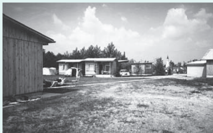
1963 – To je bilo prelomno leto, ko je bodoče zdravilišče začelo dobivati svojo podobo. Za goste so odprli deset ličnih počitniških hišic.