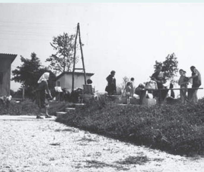
1964 – Ne samo tuji gostje, tudi domačini so si vzeli čas za kopanje.

in za vodjo vzdrževalnih del nastavi njihovega uslužbenca. Nenehna prisotnost Naftinih strokovnjakov za vzdrževanje je bila dejansko nujno potrebna, saj je poleg vode na plano prihajal tudi plin, zaradi apnenca, ki se je hitro nabiral na ceveh, pa so bile nujne občasne zamenjave cevi.