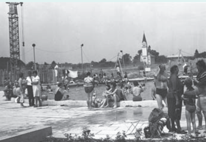
1968 – Okrog okroglega bazena je bilo še gradbišče, pa to nikogar ni motilo.

Zvezda dovoljuje izkoriščanje termalne in mineralne vode v Moravcih za zdravljenje gostov-bolnikov. Zvezda mora urediti zdravstveno službo in z Zdravstvenim domov Murska Sobota skleniti ustrezno pogodbo. Gostje-bolniki morajo biti zdravniško pregledani ob prihodu, nato pa vsaj na vsakih deset dni ter ob odpustu, za kar morajo voditi ustrezno medicinsko dokumentacijo. Kakovost termalnega vrelnca mora biti preizkušena najmanj vsakih pet let. Po ponovnih raziskavah podjetja Proizvodnja nafte Lendava ima vrtina Mt-1 zadostne zaloge vode še za okrog 60 let.