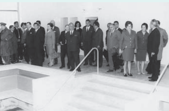
1970 – Še en prizor z otvoritve: pokriti bazen je omogočil, da se je kopalna sezona »raztegnila« na vse leto.