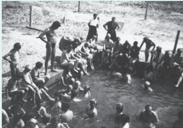
1961 – Domačini so se najprej namakali v jašku 3 x 2 m. Kmalu so ga očistili, pripravili za kopanje in s prostovoljnimi delom uredili okolico.

Delavci Nafta Lendava so razočarani zapustili vrtino, saj niso našli črnega zlata, ki so ga iskali. So pa prišli ljudje, ki so našli tisto, kar so iskali – zdravje. Glas o zdravilnosti termalne vode se je hitro razširilo.