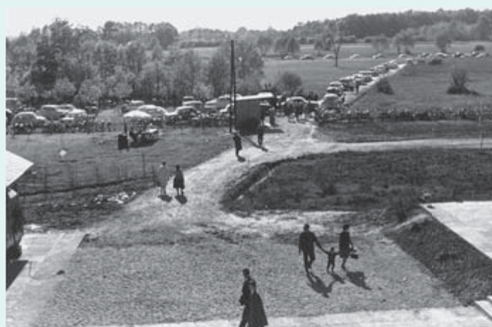
1965 – Kvalitetna gostinska ponudba in zadovoljive zdravniške storitve so že ustrezale dobremu glasu toplic, gostje pa so parkirali še vedno po starem – po bližnjih travnikih, ki jih je medtem Zvezda že odkupila.