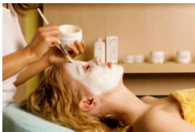
V wellness centru Thermalium boste doživeli popolno sprostitvev, pričakuje vas več kot 150 wellness programov in storitev.