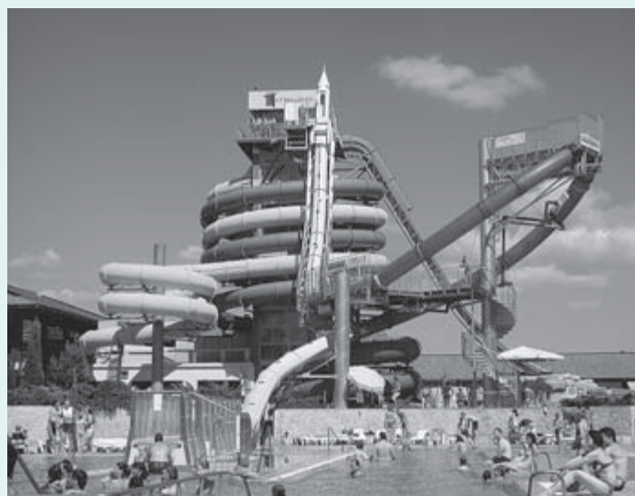
2000 – Odprli so bazenski kompleks Terme 3000 s približno 2000 m 2 vodnimi površinami ter z atraktivnim toboganskim parkom. Leta 2008 so ga nadgradili z aqua loop toboganom z raketnim štartom.