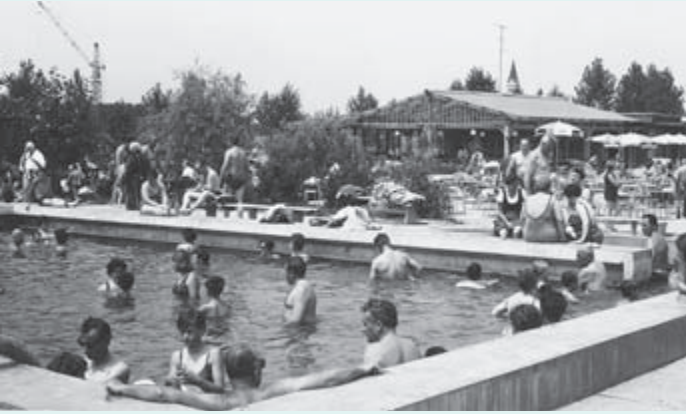
1966 – Vsakdanji prizor v toplicah. Žerjav v ozadju naznanja, da gradijo naprej, da imajo v Moravcih še velike načrte. To leto so toplice dobile dovoljenje za zdravljenje lokomotornega aparata in revmatičnih bolezni.