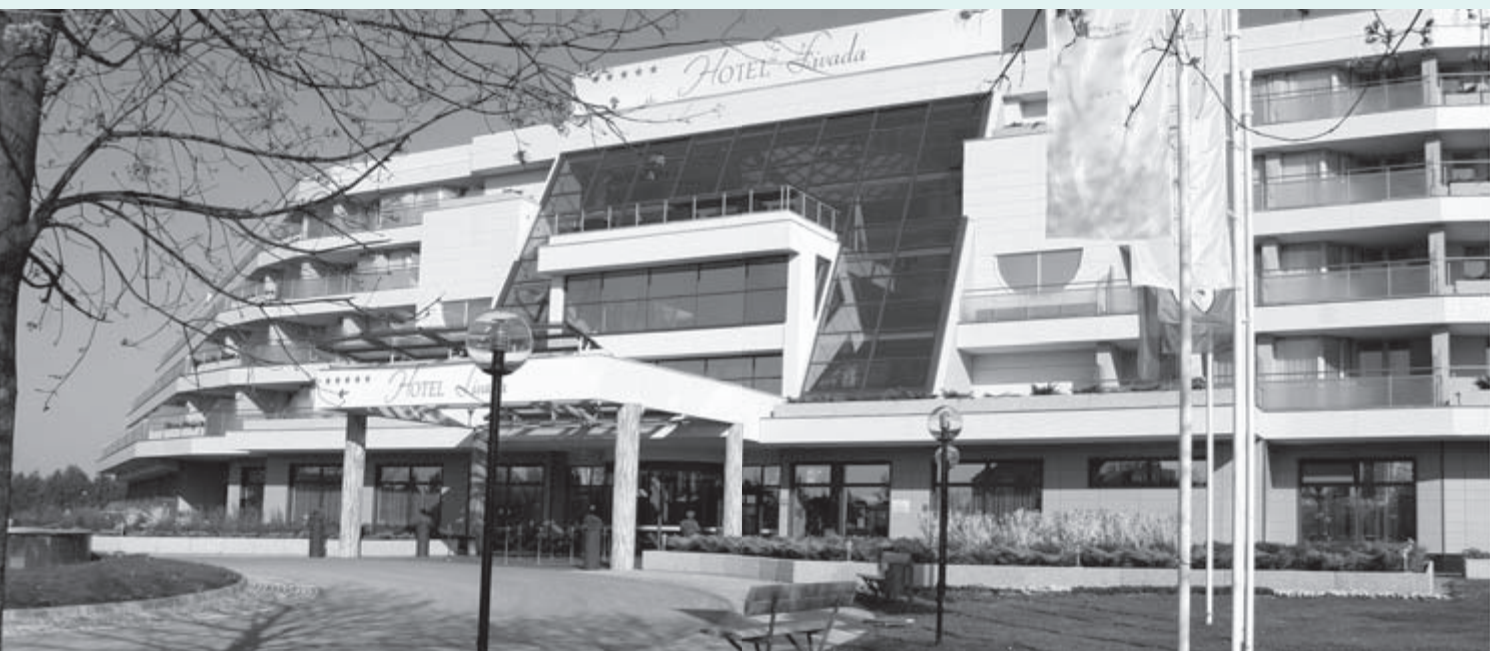
2006 – Hotel Livada Prestige za najzahtevnejše goste je odprl vrata konec septembra.