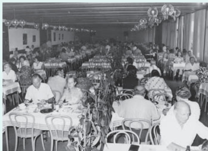
1973 – Odprli so veliko restavracijo s 500 sedeži in prostorno teraso ob njej.

22. junija 1964 je iz vrtine nenadoma prenehala dotekati voda. Apnenec, ki se je nabiral na stenah, je enostavno zamašil cevi in preprečil pretok vode. Kopališče so bili prisiljeni zapreti. Takoj so poklicali strokovnjake Nafte iz Lendave. Ti so se lotili remonta vrtine s specialno opremo in s posebnim dvigalom. Predvidevali so, da bo, ko bodo predrli čep, prišlo do močnejše erupcije, ki jo bodo sposobni obvladati. V začetku je res kazalo, da bo popravilo rutinska stvar, vendar se je začelo zapletati, dokler ni prišlo 24. junija ob 16.10 do močnega izbruha vode, s katero sta se pomešala plin in na koncu še pesek. Izbruh je bil tako silovit, da je curek vode presegel višino stolpa, pozneje pa so v bližini stolpa našli iztrgan železni del, ki je bil vgrajen na globini 1115 metrov. Vrtino so ukrotili šele 26. junija, voda pa je začela iz vrtine normalno pritekati 1. julija. V tem času je bilo kopališče povsem zaprto, v njegovi okolici so se lahko gibali le zaposleni. Dogodek ni vznemiril samo gostov, ampak tudi domačine in okoličane. Zaradi možnosti eksplozije plina so v bližnjih naseljih izklopili električni tok, gasilci in tehnično osebje pa so bili v nenehni pripravljenosti.