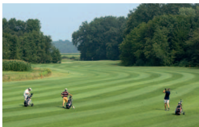
Pridružite se nam na Golf igrišču Livada z 18 igralnimi polji, na nordijski hoji, potepanju s kolesom, igranju tenisa, odbojke ...