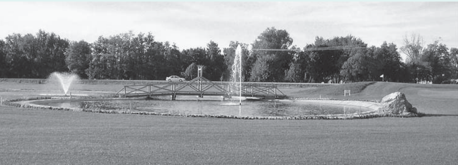
2005 – Golfsko igrišče Livada (18 lukenj, približno 65 ha površine) je s treh strani obdalo hotelsko-zdraviliški in apartmajski kompleks.