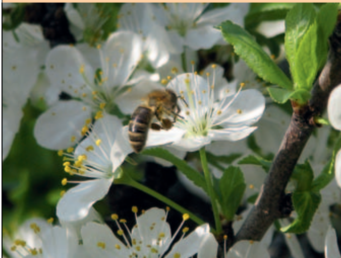
Goran Novak: Čebelica na delu