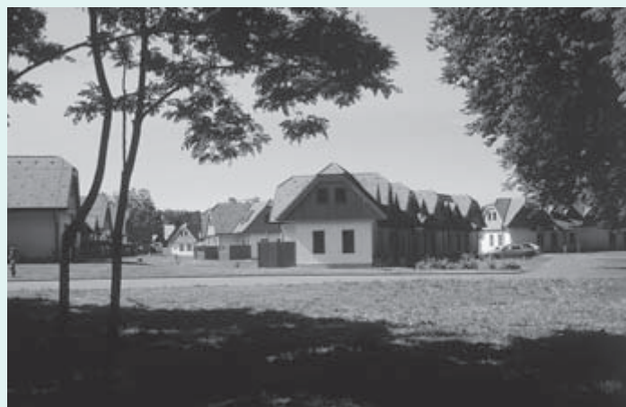
1997 – Začeli so z izgradnjo prve faze apartmajskega naselja Prekmurska vas po zamisli arhitekta Dugarja; druga faza je bila dograjena junija 2001, s čimer so v Moravskih Toplicah pridobili več kot 200 apartmajev visoke kakovosti s približno 600 posteljami, del za potrebe zdravilišča, še več za prodajo na trgu.

Poskrbeli so za redno avtobusno zvezo Murska Sobota–Moravci–Murska Sobota. Avtobus je vozil večkrat dnevno. Odprta pa je bila tudi stalna avtobusna linija Gradec–Moravci–Gradec. Avtobus je vozil pet dni v tednu.