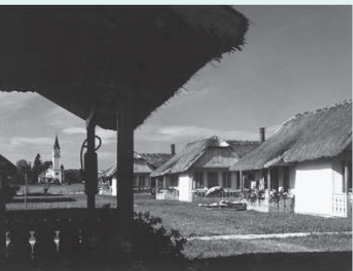
1971 – Naselje bungalovov v stilu pokrajinske arhitekture – v tem letu je bilo zgrajenih še 20 novih bungalovov.