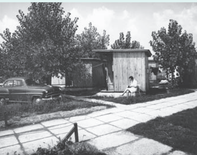
1964 – Poleg zdravja so turisti v Moravcih iskali tudi duševni mir.