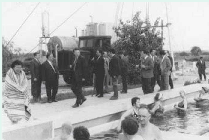
1963 – 18. avgusta je bila druga otvoritev. Moravci so bili že pomembni, saj so na otvoritev poleg pomurskih prišli tudi republiški veljaki. Ta dan se šteje za uradni začetek kopališkega in zdraviliškega turizma.