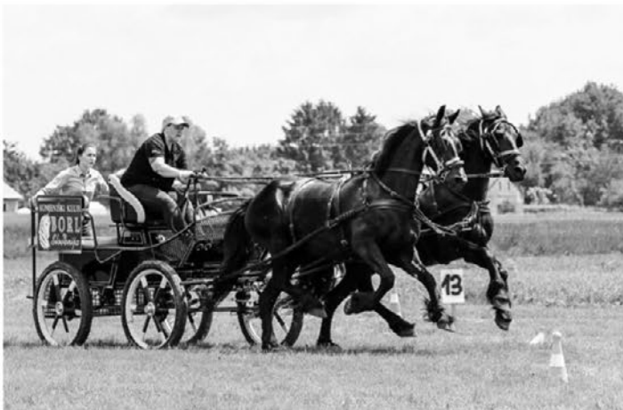
Konjeniški utrinki celega leta ...

vanjem konjenikov. Najbolj zanimivo je bilo to, da je bilo tako pri igralcih kot pri konjenikih dosti istih igralcev in konjenikov kot pri prvi uprizoritvi ali pa so na ponovitvi sodelovali že tudi njihovi otroci. Kdo ve, kako bo pri naslednji uprizoritvi. Člani Konjeniškega kluba Borl smo sicer iz več različnih občin, prevladujejo pa seveda člani iz občine Zavrč. Zato se tudi večina naših najpomembnejših prireditev dogaja v občini Zavrč. Radi sodelujemo tudi na prireditvah drugih društev, če nas le lahko vključijo. Ponosni smo, da nas je letos župan vključil v dve pomembni prireditvi, in sicer smo mu pomagali pri sprejemu Valvasorjeve konjenice, ki je letos potovala skozi občino Zavrč, ter pri Rimskih igrah, kjer smo se lahko predstavili z zelo redko videno rimsko kvadrigo (štirivprego).