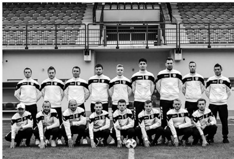
Članska ekipa, ŠD Nogometna šola Zavrč