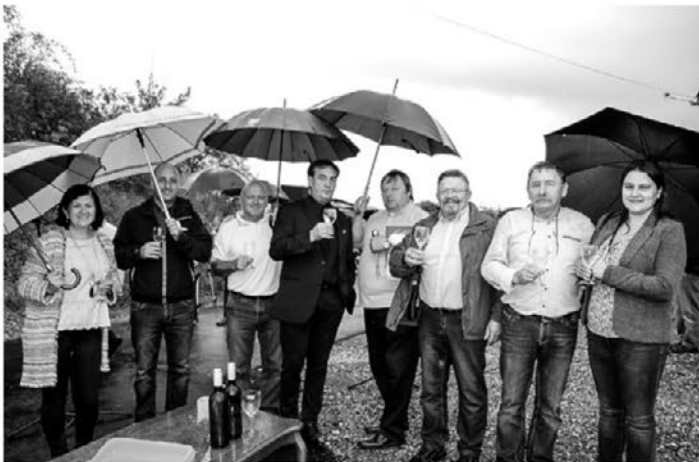
Na odprtju posodobljene ceste so bili ob vodstvu završke občine tudi nekateri gostje.

detska dela, stroški notarjev, nadzor in projektna dokumentacija) je dobrih 132.147,42 evra. Od tega je Ministrstvo RS za gospodarski razvoj in tehnologijo prispevalo 65.274 evrov nepovratnih sredstev in 58.333 evrov povratnih sredstev, iz proračuna Občine Zavrč se je krilo 8540,42 evra.