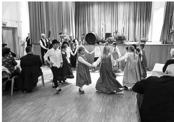
Tudi letošnja prireditev, posvečena sv. Martinu in vinarjem, je v Zavrču odlično uspela.