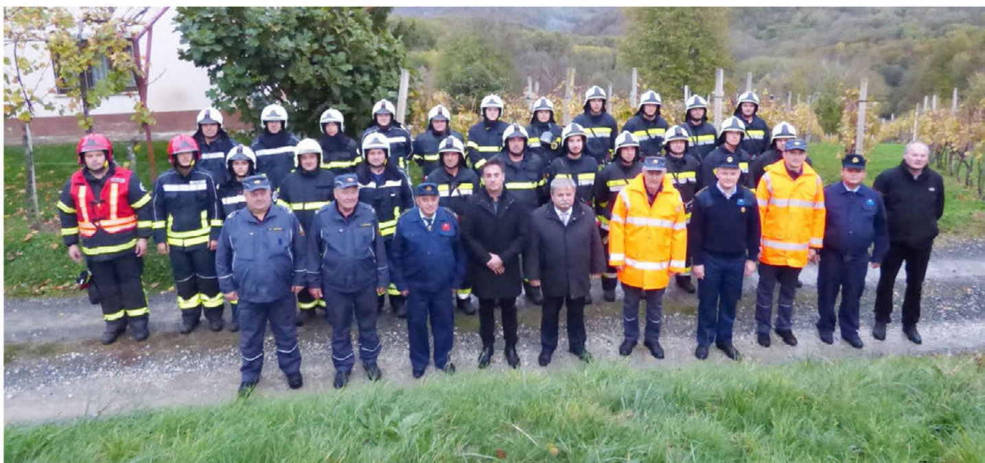
Gasilci iz PGD Zavrč in DVD Lovrečan Dubrava so 2. novembra uspešno izpeljali tradicionalno gasilsko vajo.