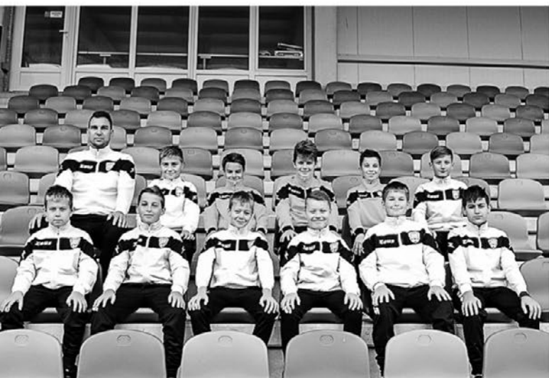
Ekipo U-13, ŠD Nogometna šola Zavrč

Selekcija U-15, ki nastopa kot združena ekipa Zavrč - Cirku-lane, bo prezimila na 7. mestu, uspešnejši pa so njihovi mlajši