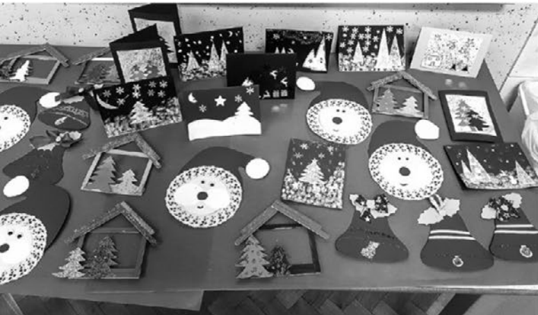
Izdelki, ki so nastali na tehniškem dnevu.