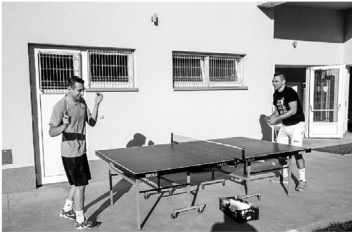
Zbrani so se pomerili v raznih športnih panogah.