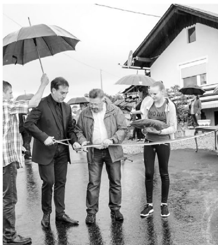
Slavnostni trenutek odprtja posodobljene ceste na odseku v naselju Pestike

Ocenjena vrednost stroškov posodobitve (gradbena dela, geo-