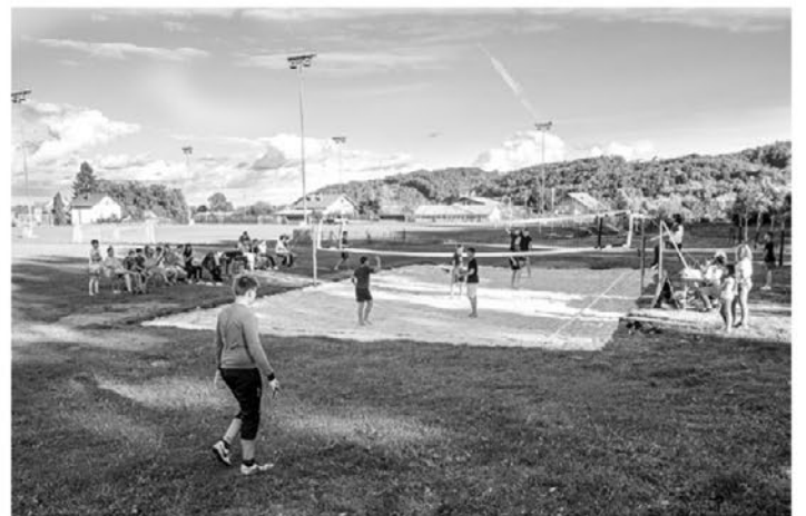
Mladi so preizkusili novo igrišče za odbojko na mivki.