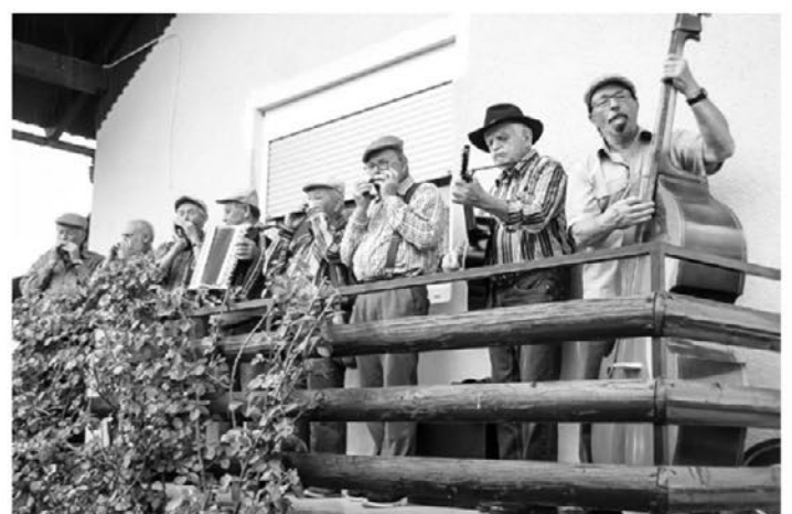
Dogodek so nastopajoči oplešali z glasbo.