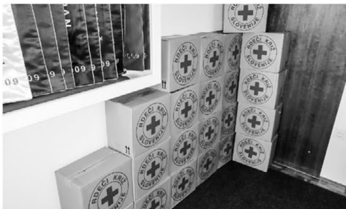
Paketi za vse tiste, ki potrebujejo pomoč sočloveka.