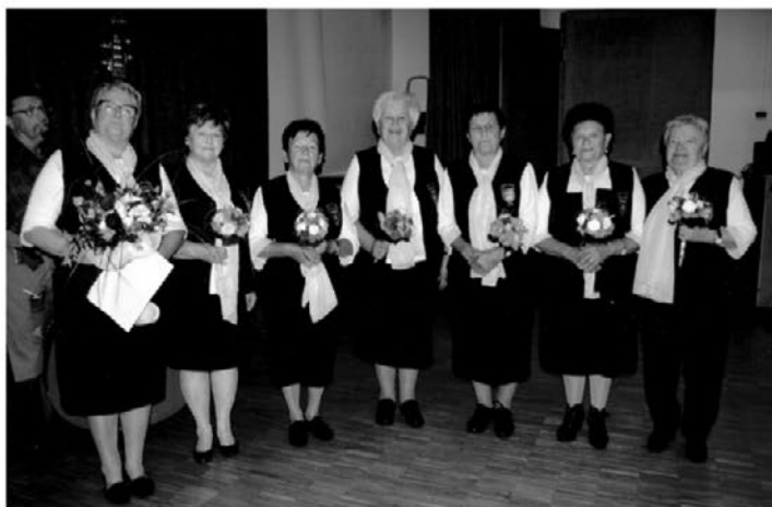
Ljudske pevke KUD Maksa Furjana

Društvo je sodelovalo tudi na vseh prireditvah, ki jih je organizirala občina. Udeležili smo se tudi pohoda po poti Maksa Furjana, ki ga organizira pohodniška sekcija turističnega društva. 11. novembra je potekalo martinovanje v občini Zavrč, kjer so sodelovala društva. Nekako je bil KUD soorganizator martinovanja. Povabili smo šolske folkloriste in otroški pevski zbor, ki ga je spremljala skupina Trta. Zapele so tudi ljudske pevke,