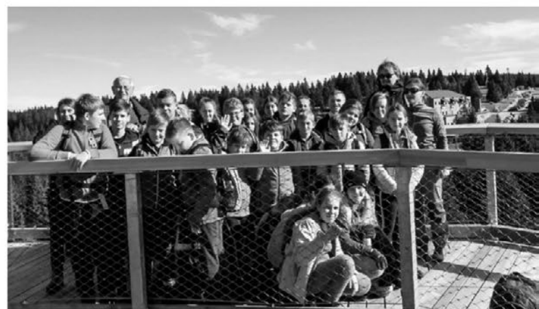
Na stolpu Poti med krošnjami.

odcepah pa je bilo poskrbljeno še za adrenalinske navdušence. Marsikdo pa je ta dan premagal tudi strah pred višino. Tako nas je kilometer dolga pot popeljala skozi raznolik gozd, v katerem smo naleteli na mnoga presenečenja, ki so nas poučila o naravnih procesih v gozdu. Pa tudi o tem,