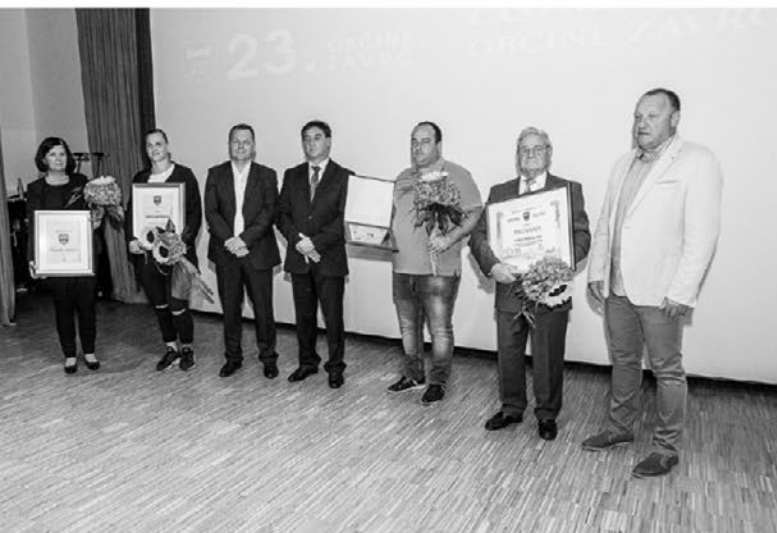
Letošnji nagrajenci – dobitniki najvišjih občinskih priznanj

rejše nad 69 let, člane in nečlane ter jim organizira pomoč, če jo ti potrebujejo. Opravi je tudi osnovna izobraževanja za prostovoljce in se redno udeležuje nadaljnjih izobraževanj. Vedno je imel korekten in spoštljiv odnos do vseh, s katerimi je sodeloval. Člani DU Zavrč ga cenijo in spoštujejo.