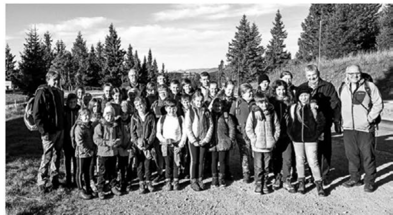
Naša ekipa brez fotografinje, mentorice Maje.

Taj: Meni sta pa pri delu pomagali teta Simona in učiteljica. Želim si, da bi mami dobila dopust in prišla z mano v šolo, ko bomo spet imeli tehniški dan.