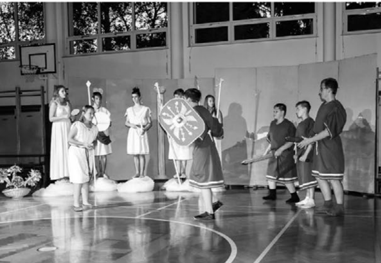
Najlepši utrinki s praznovanja dneva šole v Zavrču.