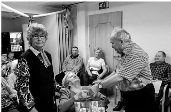
Na obisku pri starejših v domu upokojencev

Vsaka beseda, vsak pogled, vsako dejanje in vsak nasmeh lah-