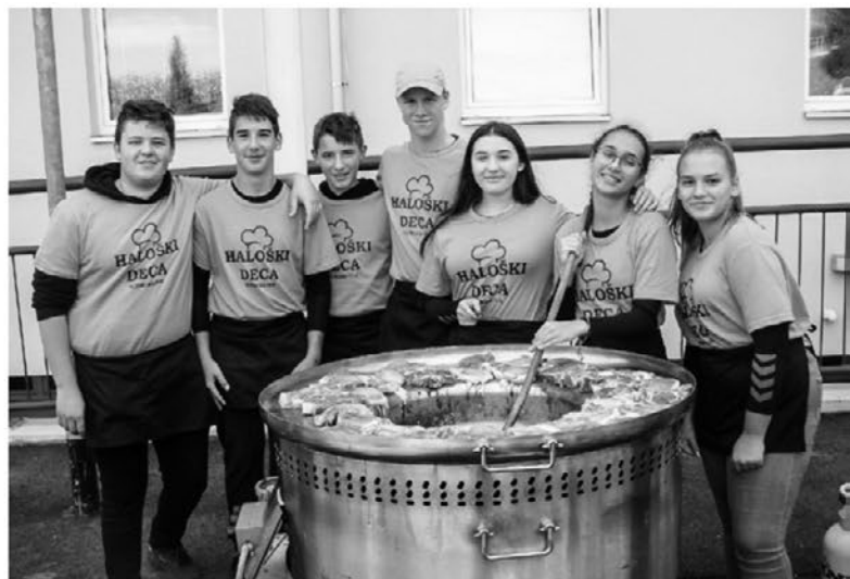
Najboljša v peki ciganskih pečenk je bila po oceni strokovne komisije ekipa Haloški deca.