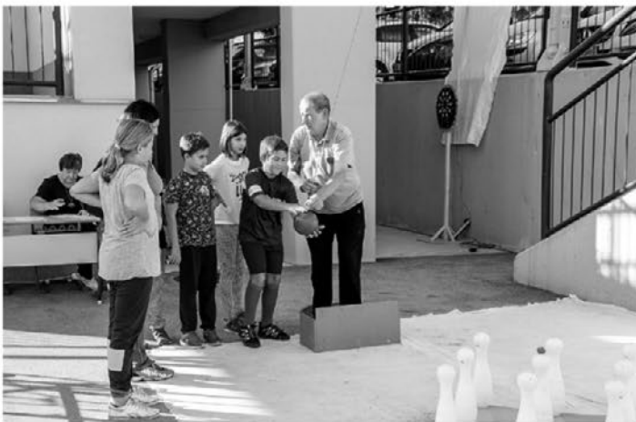
Kegljanje na vrvcu je bilo zanimivo za male in velike.