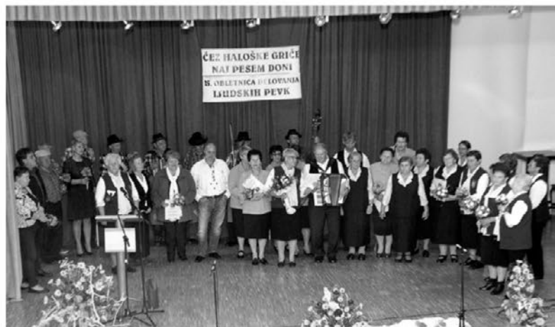
Skupna pesem vseh sodelujočih.

Društvo je sodelovalo tudi na vseh prireditvah, ki jih je organizirala občina. Udeležili smo se tudi pohoda po poti Maksa Furjana, ki ga organizira pohodniška sekcija turističnega društva. 11. novembra je potekalo martinovanje v občini Zavrč, kjer so sodelovala društva. Nekako je bil KUD soorganizator martinovanja. Povabili smo šolske folkloriste in otroški pevski zbor, ki ga je spremljala skupina Trta. Zapele so tudi ljudske pevke,