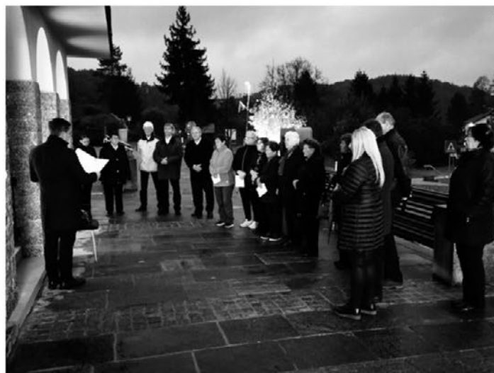
Utrinek s spominskega dogodka v Zavrču.