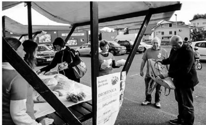
Uspešno so se člani OO RK Zavrč vključili tudi v akcijo Drobtinica.

ko prinese srečo drugim ljudem. Vsak trenutek je lahko nov začetek, zato radostno pojdemo naproti novemu letu 2020. Da bi se vam in vašim najdražjim uresničila vsa pričakovanja v novem letu,