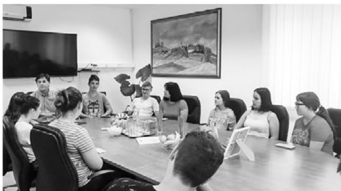
Sprejem za devetošolce.