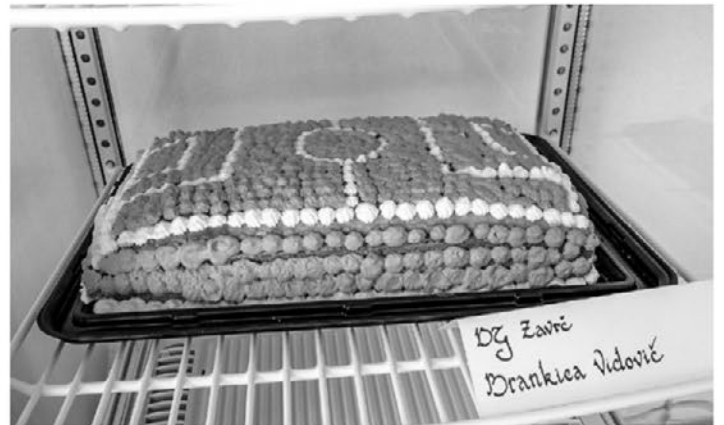
Zanimivo razstavo na temo športa so pripravile tudi završke gospodinjice.