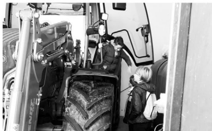
Na obisku na kmetiji.

dni, marelični, čokoladni in božični jogurt. Posladkali smo se tudi z domačimi, sveže ocvrtimi miškami. Ogled in pogostitev sta hitro minila in že smo se z avtobusom odpeljali v Slatino na ogled pekarn Blanka. Sprejela nas je gospa Blanka. V sprejemni sobi nas je vse lepo pozdravila in spregovorila nekaj besed o pekarni. Predeno smo si šli pogledat stroje in peči za peko kruha in keksov, smo si vsi naredili čepice. Nazadnje smo šli v skrivno sobo. Tam je potekala peka piškotov. Omamno je dišalo. Gospa Blanka nas je postregla še s toplimi piškoti. Bili so izvrstni. Na tem naravoslovnem dnevu smo se veliko naučili, saj smo videli, kako poteka proizvodnja mleka in kruha. Želela bi, da bi imeli več časa in bi tudi vsa ta dela sama poizkusila. V imenu obeh lokacij se zahvaljujem za ta krasni in poučni dan.