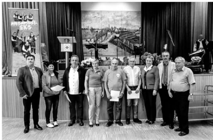
Velika hvala vsem, ki darujejo kri in rešujejo življenja.