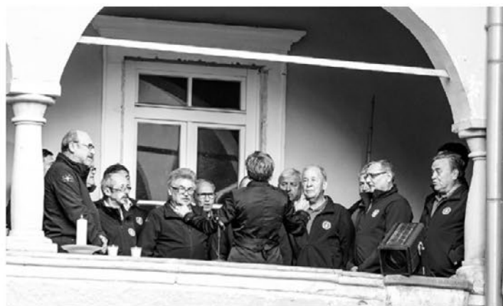
Moški pevski zbor Obrtnik Slovenska Bistrica - Polskava