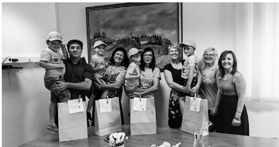
Letošnji minimaturanti v družbi župana in njegovih sodelavcev

21. junija je župan Slavko Pravdič v prostorih Občine Zavrč sprejel še učence devetega razreda OŠ Zavrč. Letos se je sprejema pri županu udeležilo vseh 14 učencev devetega razreda. Župan je z njimi sproščeno pokramljal o njihovih načrtih za prihodnost in jih pohvalil za