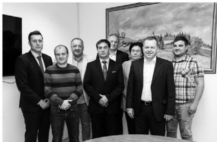
Občinski svet Občine Zavrč v novem mandatu