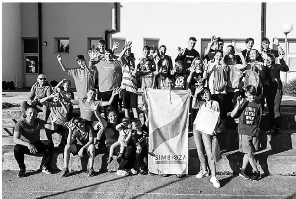
Programerski lov na zaklad.

iz osnov programiranja. Udeleženci so tekmovali v skupinah po štiri in so v povprečju med postajami pretekli vsak pribl. 4 km. Vsem sodelujočim je uspelo najti zaklad in rešiti vse naloge. Predvsem pa so bili veseli druženja in gibanja na svežem zraku. Tovrstna dejavnost jim je bila zelo všeč, saj so sodobne tehnologije, ki jih zanimajo, združili z gibanjem, ki ga prav tako zelo potrebujejo.