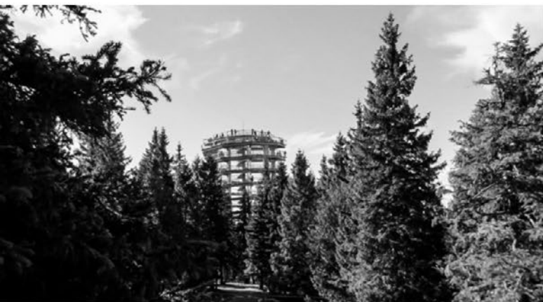
Pogled na stolp Poti med krošnjami.

V soboto, 12. oktobra, smo izpeljali jesenski planinski izlet mladih planincev in čebelarjev na Roglo. Natančneje, želeli smo si ogledati tamkajšnjo novo pridobitev Sprehod med krošnjami. Spoznali smo tudi improvizirano pohorsko vasičo in jo mahnilo po gozdnem kolovozu na Pesek.