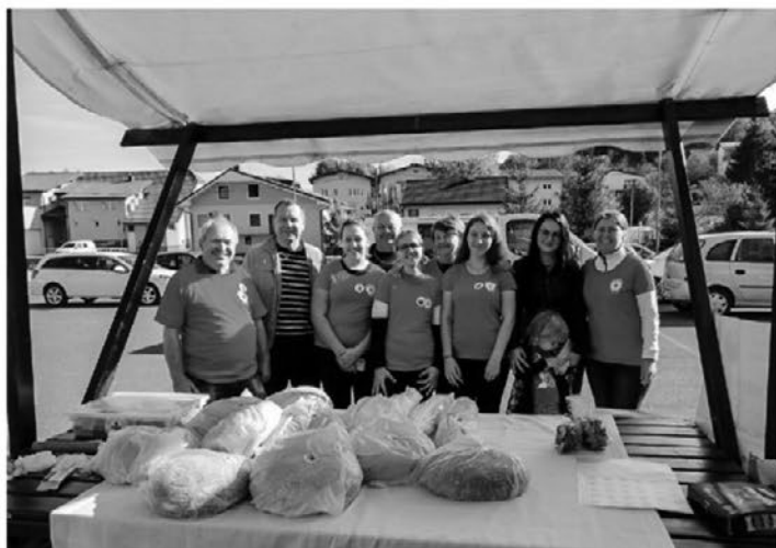
Tudi v Zavrču so zbirali sredstva za tiste, ki so v stiski in potrebujejo pomoč sočloveka.

denar za otroke, ki si prehrane v šoli ne morejo privoščiti. Veseli smo bili tudi tistih, ki ponujenih izdelkov niste kupili, a ste vendar prispevali kakšno drobtinico za otroke iz socialno šibkejših družin.