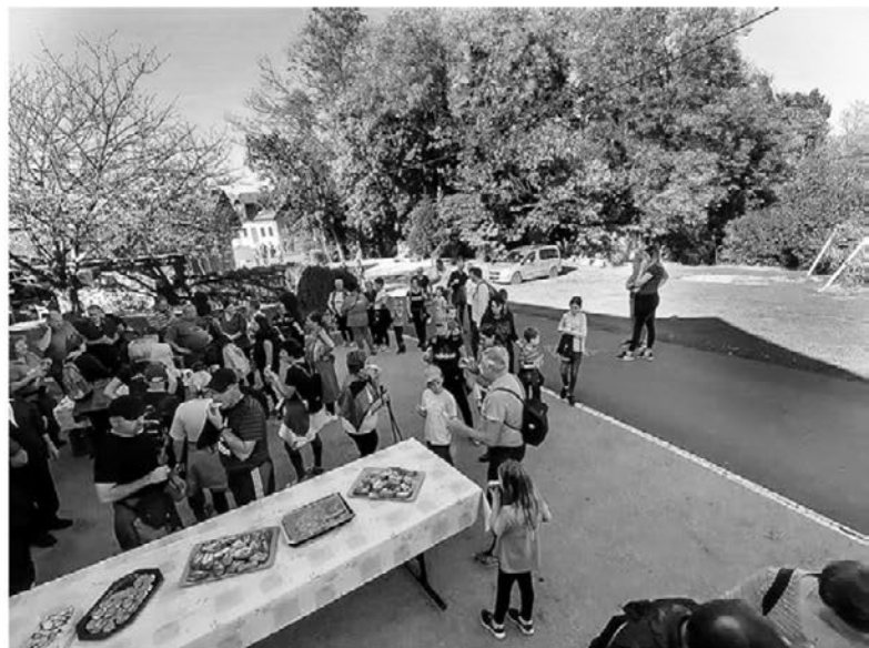
Jesenski pohodniški utrinki.