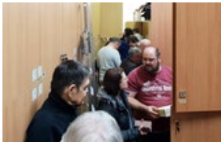
Ogled depoja Prirodoslovnega muzeja Slovenije.