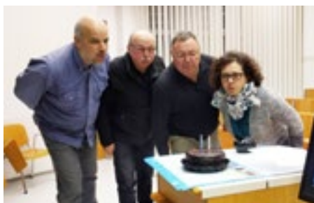
Ustanovni člani DPOMS ob 20. obletnici ustanovitve društva.