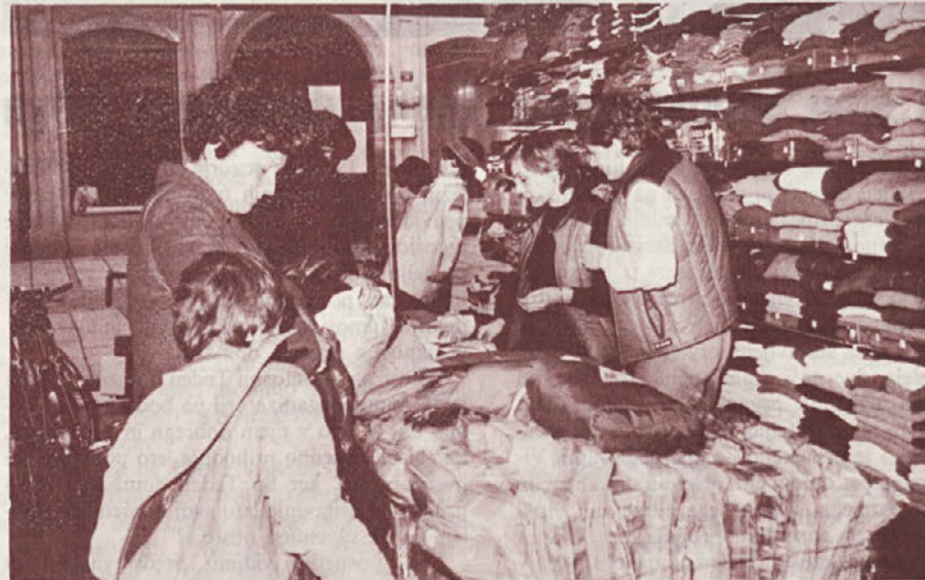
V poslovalnici Trim imajo bogato izbiro različnih športnih oblačil