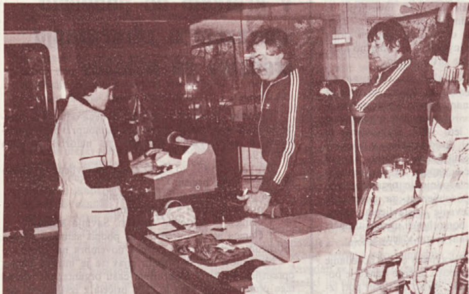
V hotelu Donat v Rogaški Slatini imajo svojo butiko