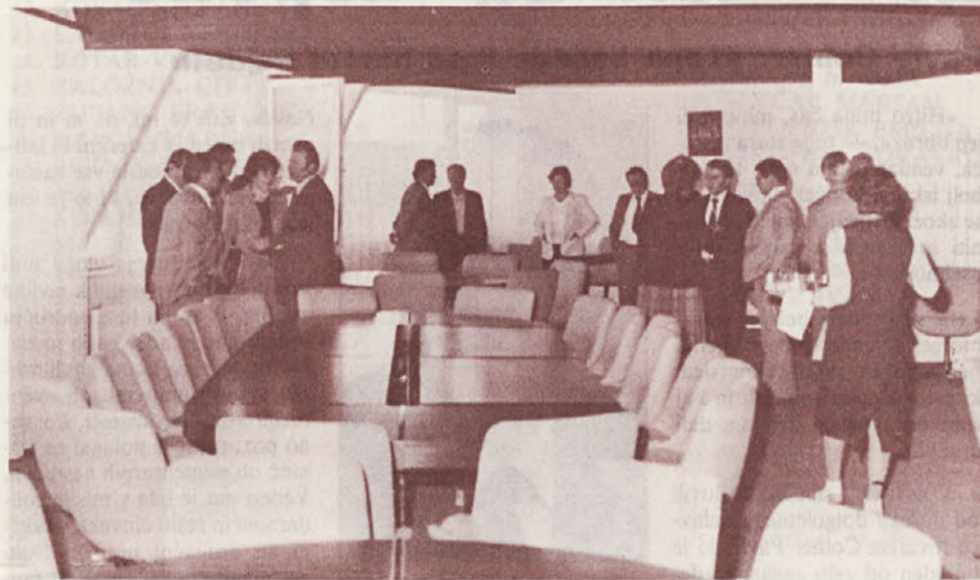
Sejna soba »Panorama«