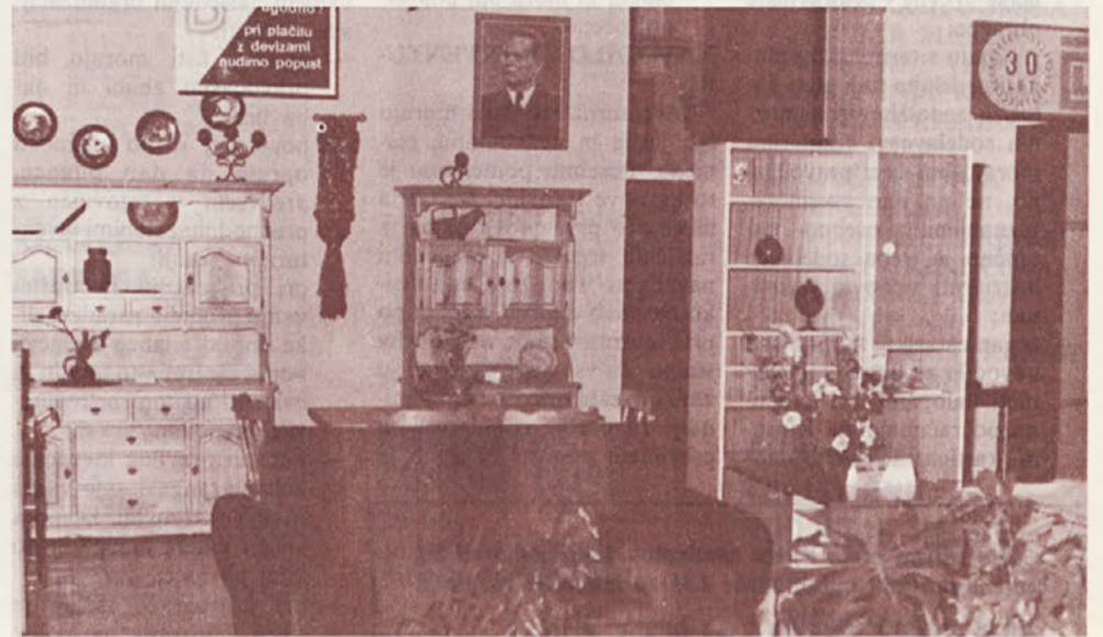
Detalj iz salona pohištva