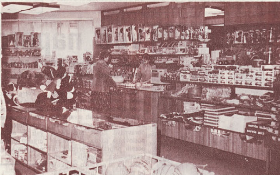
Oddelek z igračami v modni hiši je vedno dobro založen