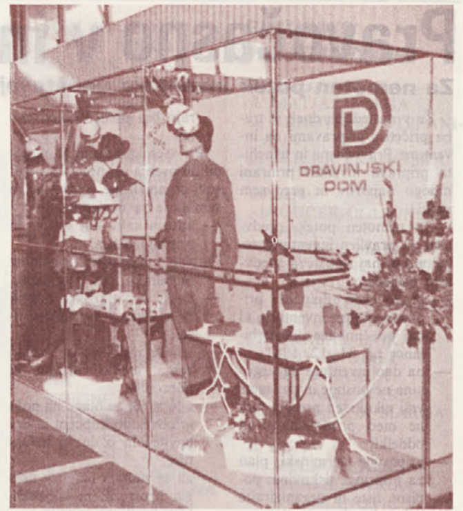
Izložbeni prostor na mednarodnem sejmu Zaščite pri delu v Beogradu