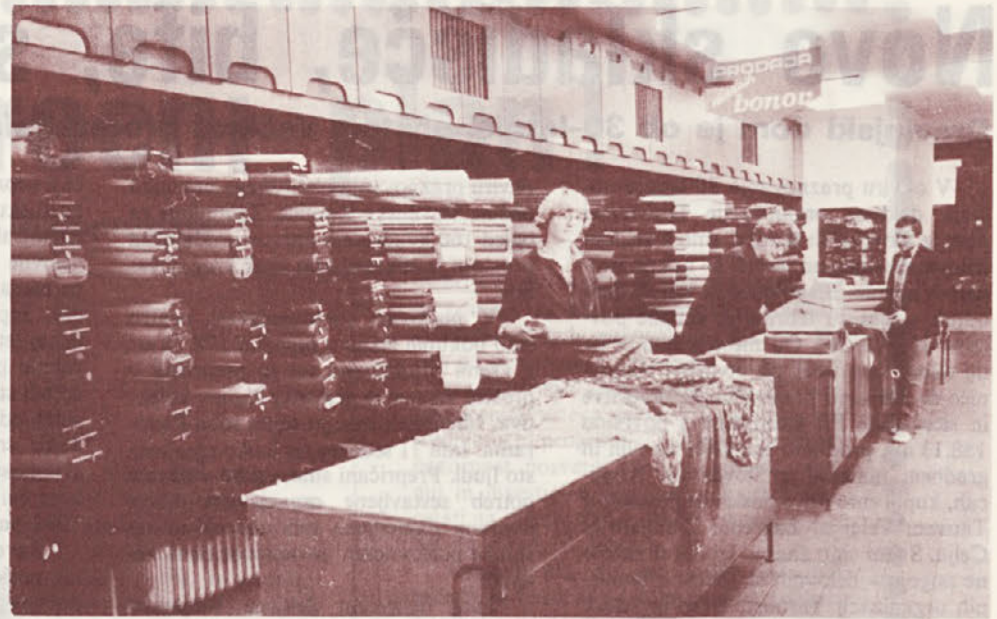
Tudi v Volni bodo imeli na oddelku meterskega blaga z inventuro veliko dela

Tako bomo veliko prevelikih razlik zmanjšali na optimum. ANTON LAZNIK