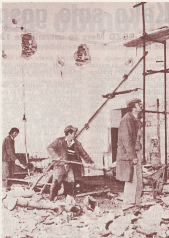
V Šentjurju pospešeno obnavljajo klavnico