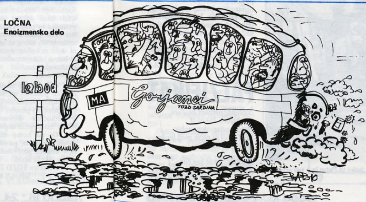
LOČNA Enoizmensko delo

Za leto, ki je pred nami se moramo zavedati, da prinaša določene težave, s katerimi se moramo spoprijeti. Moja osebna želja je, da bi tako delavci TOZD kot naše delovne organizacije stopili v leto 1981 z veliko volje do dela. Z zagnanostjo in veseljem bomo lažje dosegli nove rezultate in si s tem omogočili tudi boljši osebni dohodek. Tudi odnosi v našem kolektivu in med TOZD bi želeli, da bi tudi v bodoče ostali prijateljski in tovariški. V prihodnje bomo morali solidarnost negovati, morali bomo posvetiti vso skrb za delavca in njegovo dobro počutje, ki bo prineslo tudi večjo produktivnost. Ob vsem tem pa poudarimo še odgovornost posameznika in odgovornost do posameznika. Predvsem pa si zaželimo veliko zdravja!