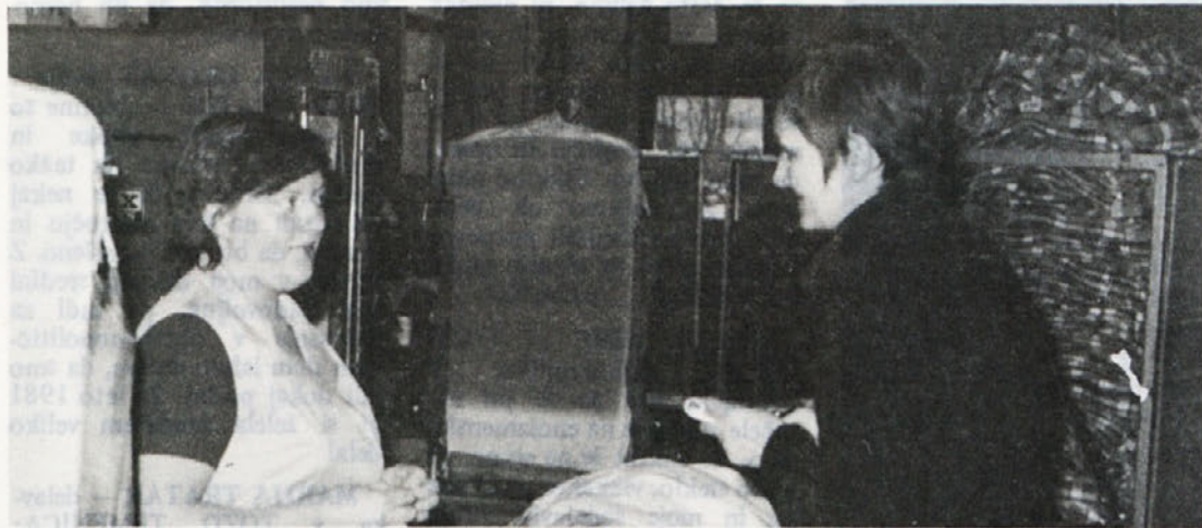
V TOZD Delta je nastal ta posnetek, ko se je novinarka Politike pogovarjala s tovarišico Strgarjevo.

Tov. Moharjeva je na sestanku izpostavila tudi vprašanje prevoza, ki postaja vse bolj pereče. V proizvodnji, kjer je norma visoka ni vseno kdaj pridejo delavke na delo, zato bi bilo potrebno to vprašanje čim preje rešiti. Pripombo bodo obravnavali na odgovornih mestih in upamo, da bodo prevozi končno le urejeni.