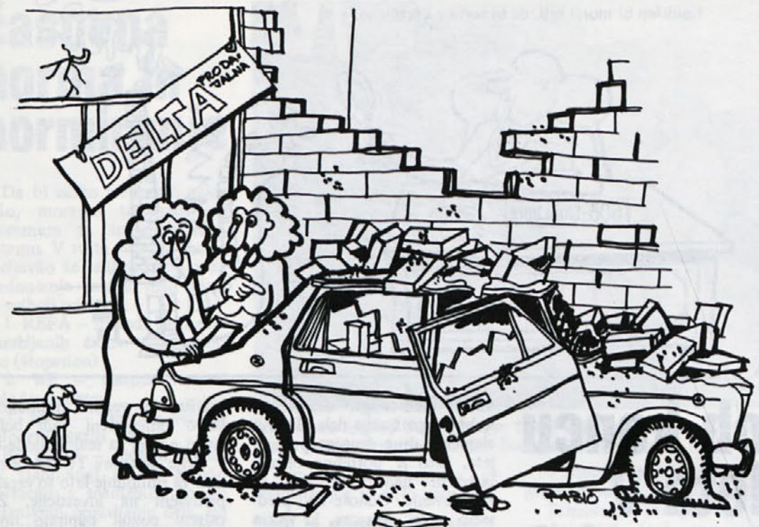
Ko bi le ostalo samo pri tem...