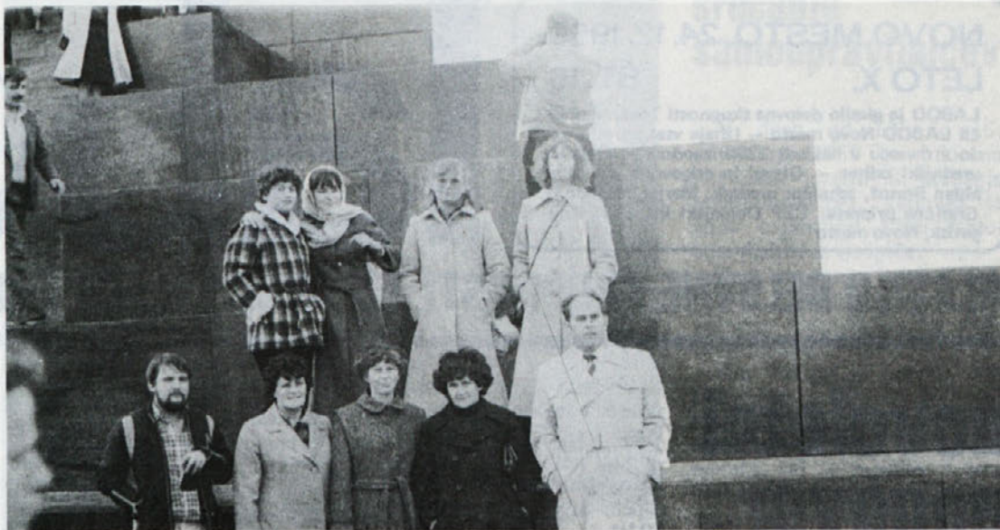
Spomin na letošnji izlet delavcev DSSS v Beograd, kjer smo obiskali poleg grobnice tovariša Tita tudi Avalo pa še precej znamenitosti Beograda in Kraguljevca.

Časovna norma (t) se izraža v min/kos. To pomeni koliko minut potrebujemo za določeno operacijo za 1 komad.