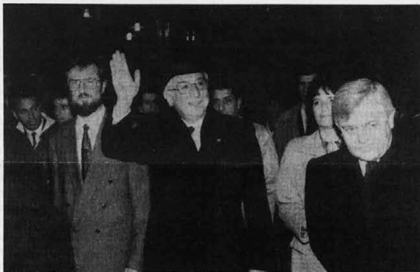
Predsednik Cossiga med obiskom v Novi Gorici. Ob njem sta predsednika Peterle (levo) in Kučan (desno)