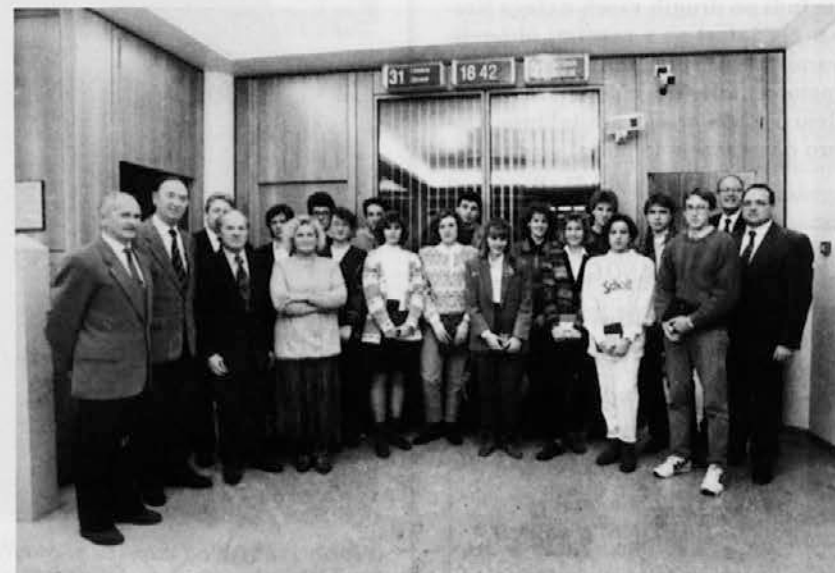
Letošnji dobitniki »Nagrade šport in šola«