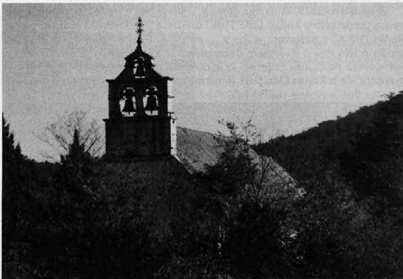
Zunanost in oltar prelepe cerkvice sv. Urha v Samatorci