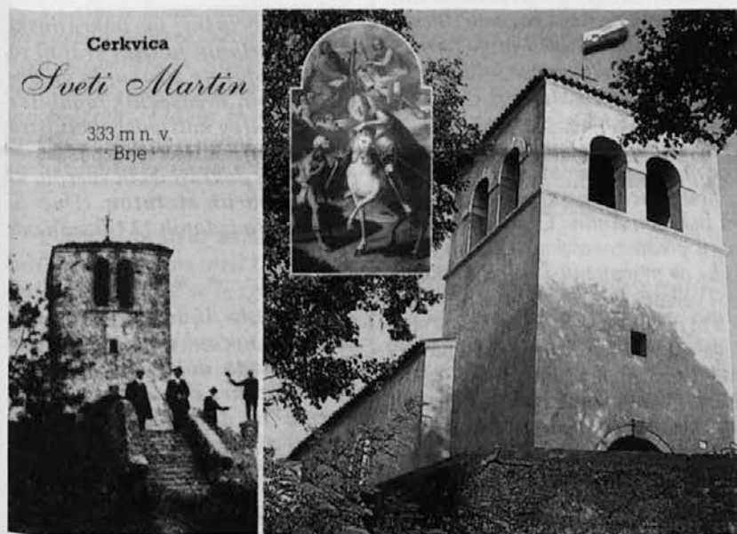
Obnovljena cerkvica Sv. Martina v Brjah