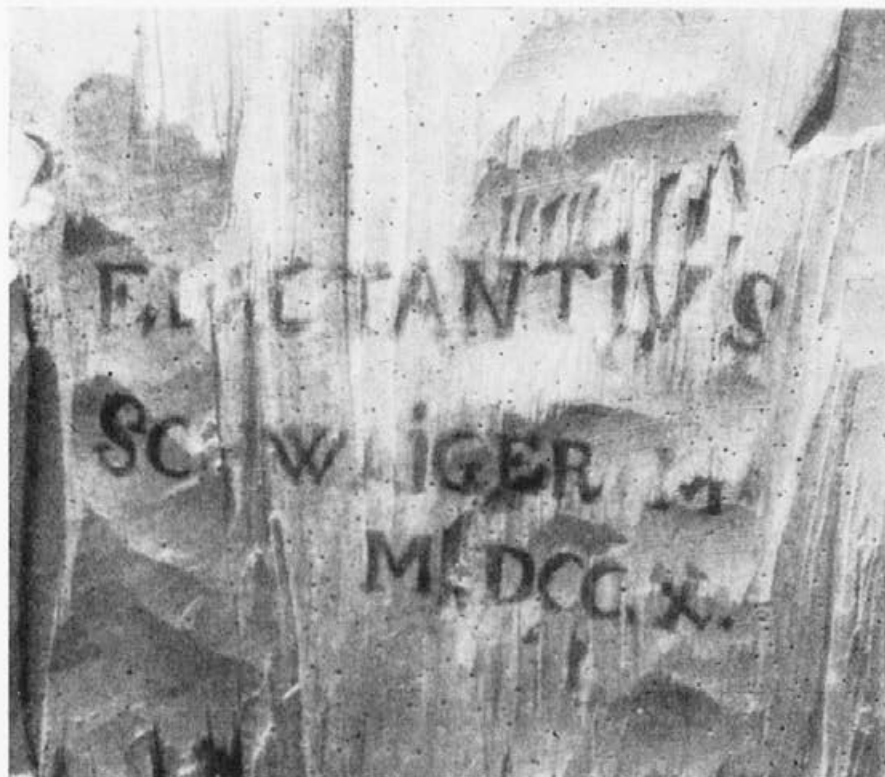
Sl. 258. Skocjan pri Lukovici, napis na hrbtu kipa

opravil brat Elcearij. 6 Tu se kot pozlatar imenuje brat Laktancij, vendar je vsaka primerjava nemogoča, ker omenjeni oltarji niso več ohranjeni, ampak so nadomeščeni z novimi. Ime Schwaiger kaže na južno-nemško poreklo, saj je znanih tudi več umetnikov s tem imenom iz Augsburga in iz Bavarske, posebno pa kaže še na Tirolsko in za nekatere kiparje frančiškanske delavnice je tirolsko poreklo izrecno izpričano. 7