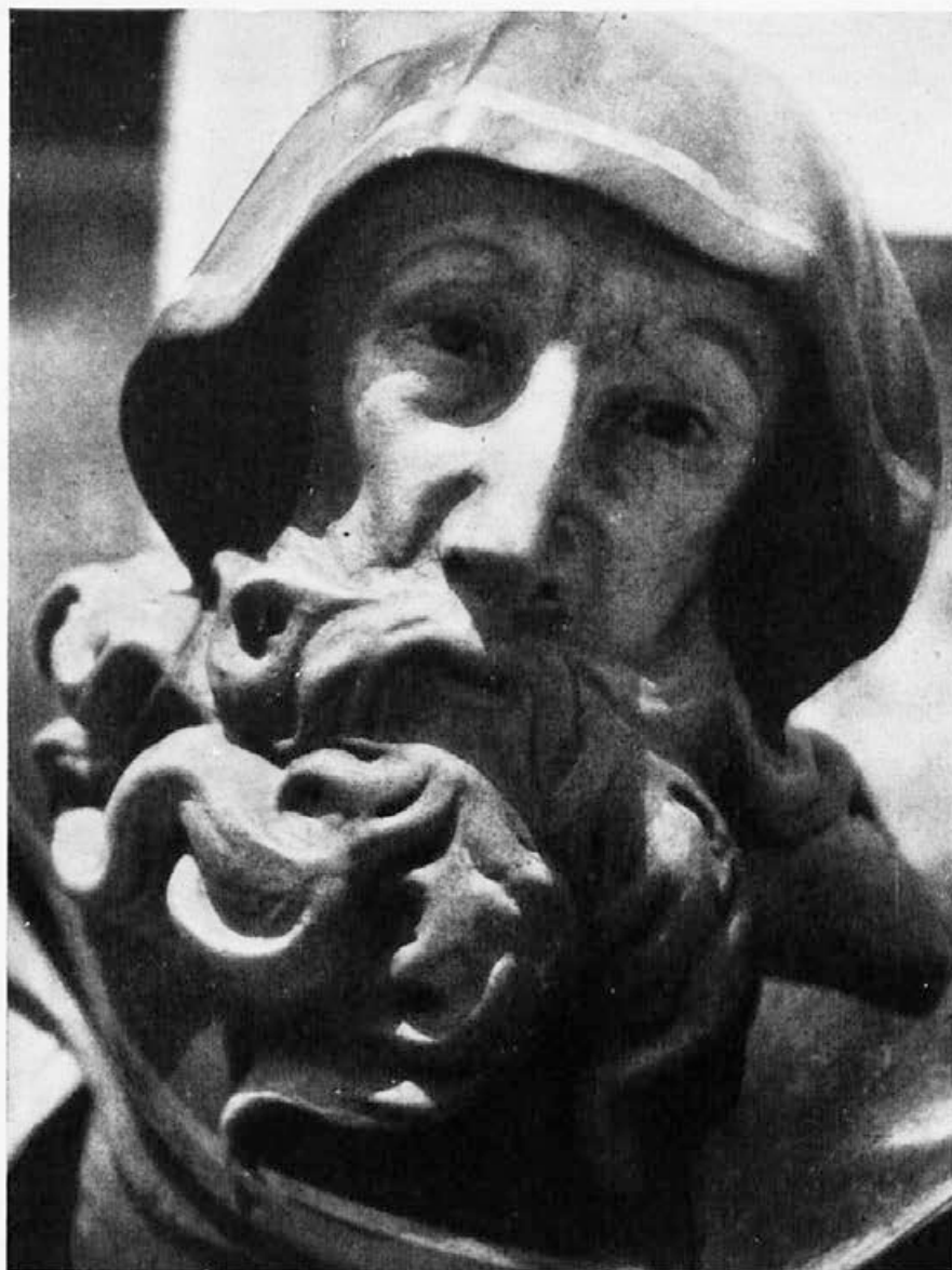
Sl. 239. Glava kipa sv. Antona v Škocjanu pri Lukovici