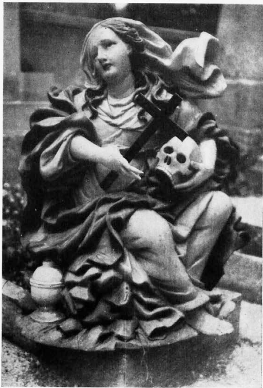
Sl. 237. Skocjan pri Lukovici, kip sv. Magdalene