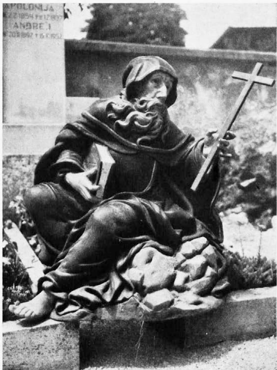
Sl. 236. Škocjan pri Lukovici, kip sv. Antona puščavnika