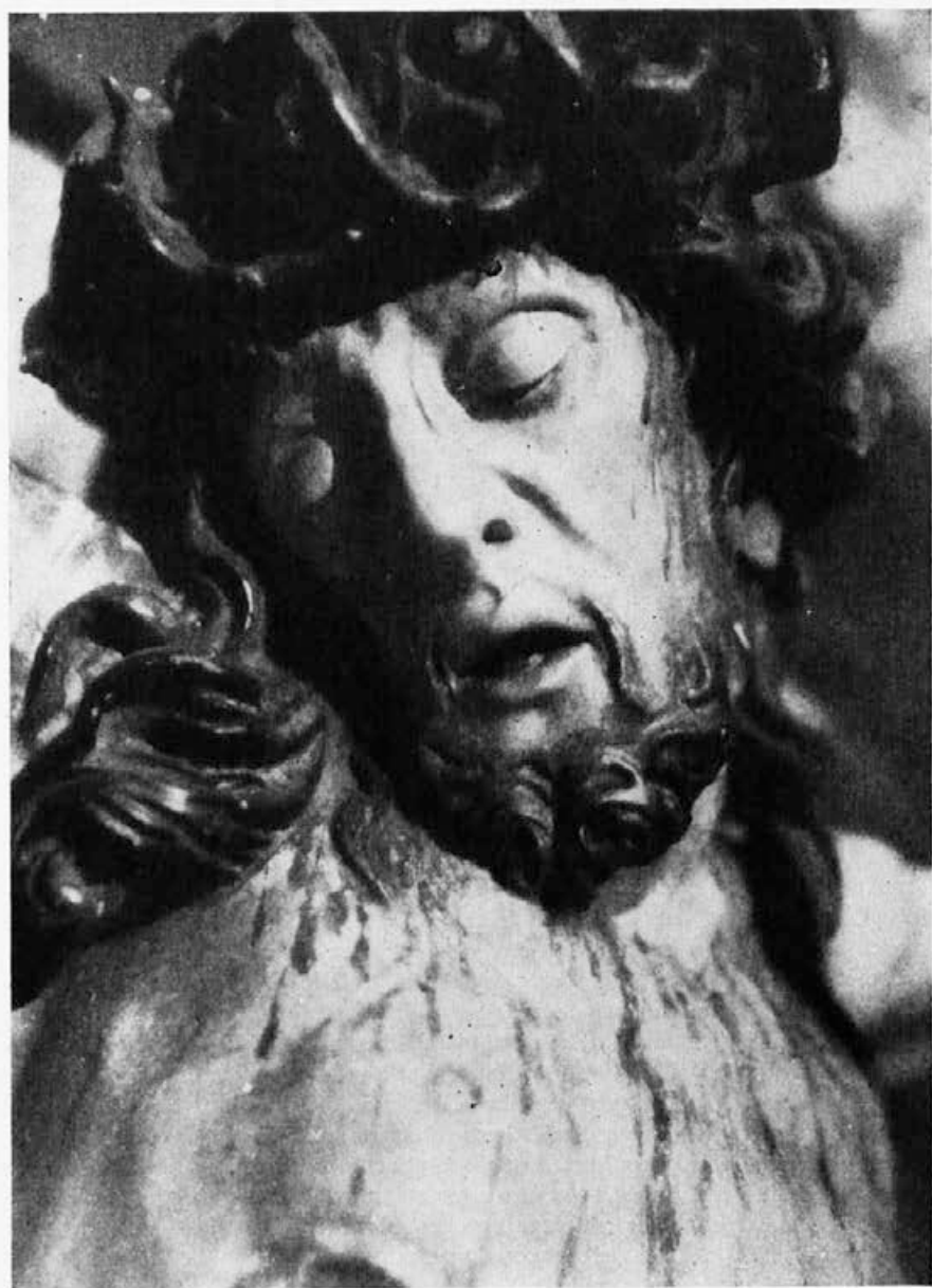
Sl. 242. Stara Loka, župna cerkev, glava Križanega