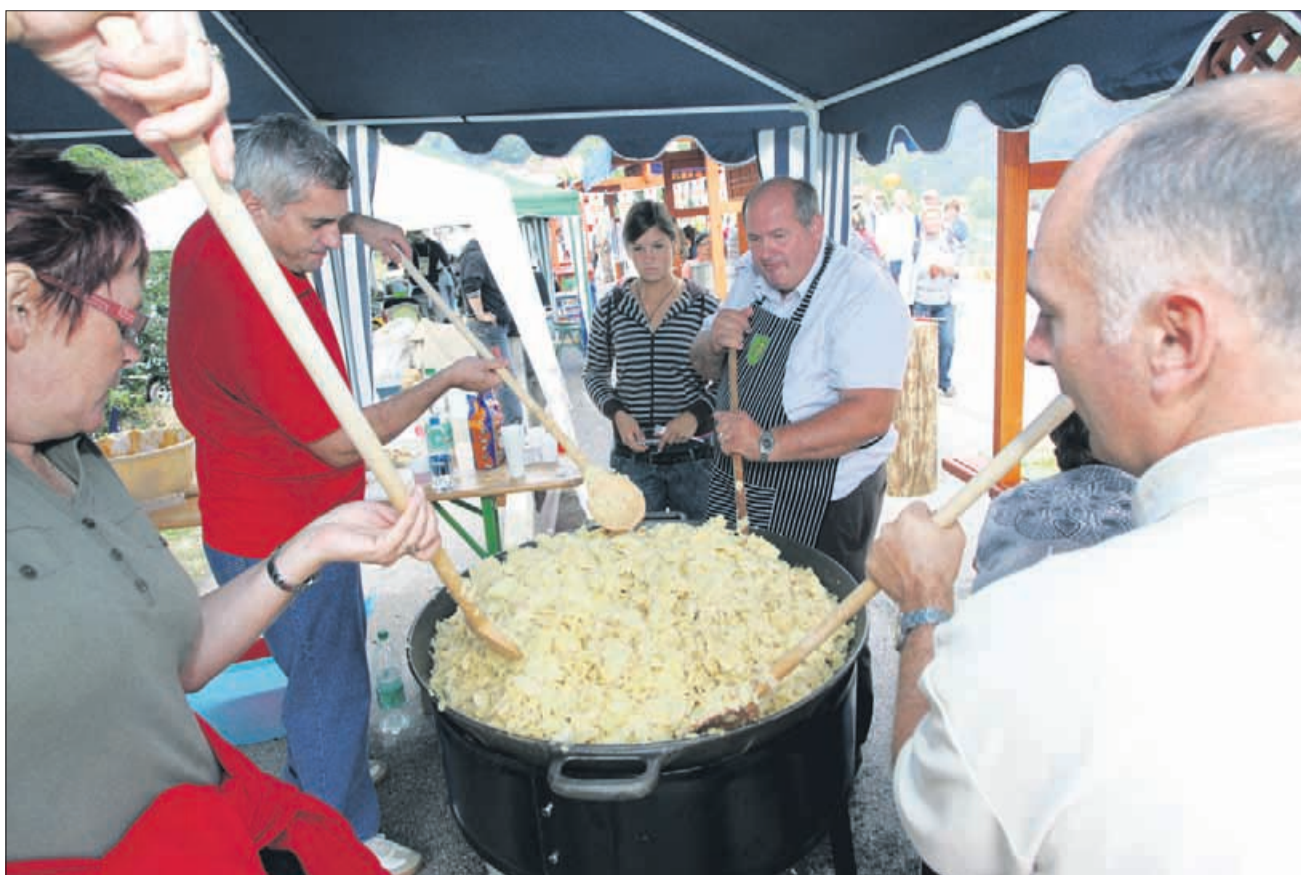
Ni ga čez »restan« krompir, pravijo člani društva ljubiteljev te jedi, ki se redno zbirajo na festivalih (na sliki), so pa okusne tudi vse druge krompirjeve dobrote.

Priprava: Panceto narežemo na kockice in jo popražimo na olju. Dodamo olupljen in na kocke narezan paradižnik, krompir, začimbe in vse skupaj dušimo kakšnih petnajst minut. Nato zalijemo z vodo, dodamo kocko in ko zavre, krompir pretlačimo. V krompirjevko lahko zakuhamo tudi dve žlici re-