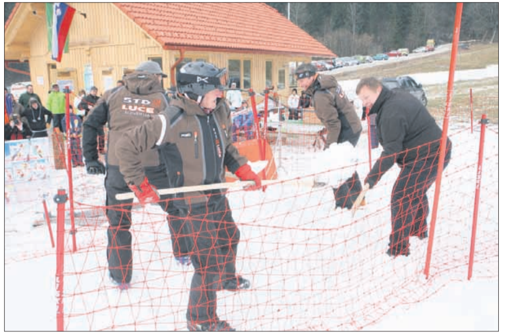
V Lučah se smučišče odpira z lopato. Hkrati je bila slovesnost priložnost za hiter trening morebitnih javnih delavcev, za katere vemo, da jih primanjkuje. V Lučah namreč upajo, da bo še v tej zimi kakšna priložnost za kidanje snega.

Dolžina smučišča je dobrih 200 metrov, cena kart je konkurenčna, uporaba tekaških prog pa brezplačna. Poleg smučišča je urejen teren, primeren tudi za majhne otroke, v teh dneh pa že izvajajo smučarske tečaje. Smučarski cen-