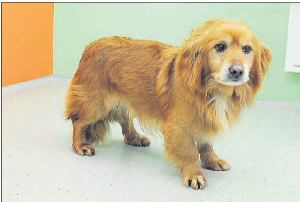
Nisem »klovn« – sem pa zelo žalosten! (Bozo)