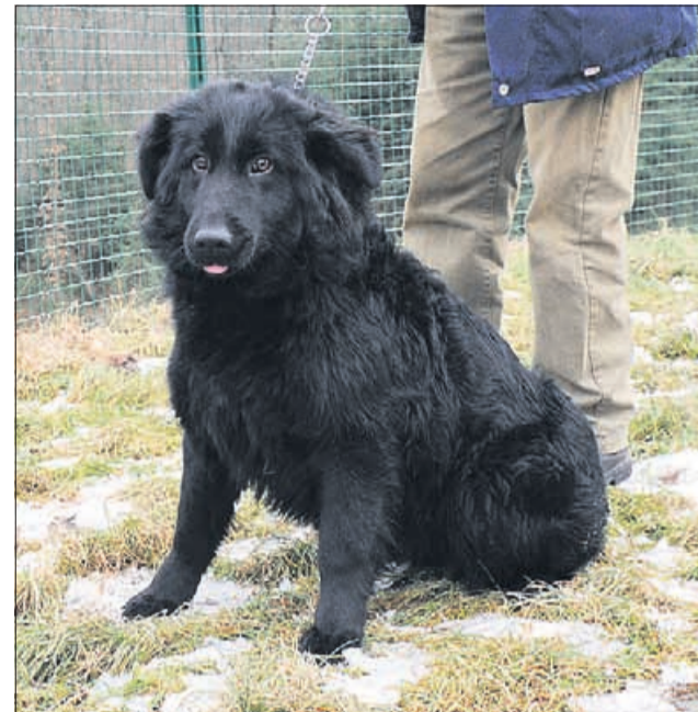
Zares sem užaljena – vzela si je drugo! (Čopka)

veterinarskabolnicašentjur www.vb-sentjur.si