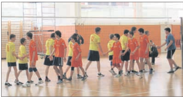
Najboljše štiri šole iz regije so se v Mozirju pomerile v odbojki.