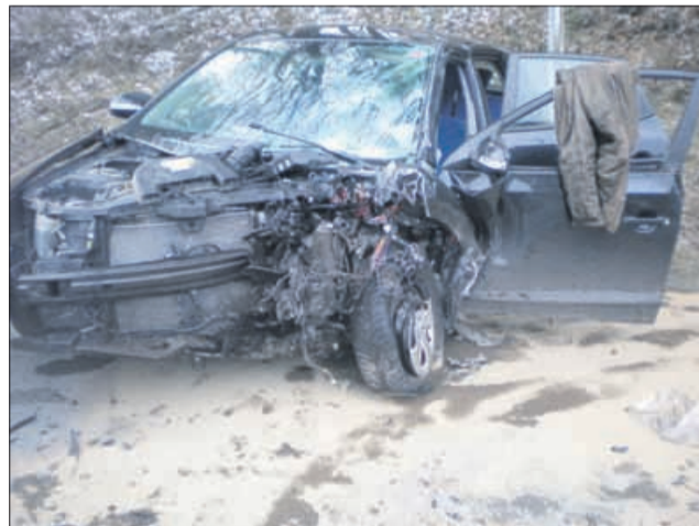
V trčenju dveh osebnih vozil so se v Veliki Pirešici v soboto poškodovale kar štiri osebe. Okoliščine nesreče še preiskujejo.

V trčenju dveh osebnih vozil so se v Veliki Pirešici v soboto poškodovale kar štiri osebe. Pri reševanju so morali pomagati tudi poklicni gasilci, promet pa je bil kar nekaj časa oviran. V nedeljo zjutraj se je na Lopati pri Celju zgodila prometna nesreča, v kateri je voznik avtomobila trčil v drog električne napeljave. Eden izmed visokonapetostnih vodnikov se je nato odtrgal in obstal na cestišču, zaradi česar je tudi zagorelo, a do hujših posledic ni prišlo. Posredovalo je osem celjskih poklicnih gasilcev.