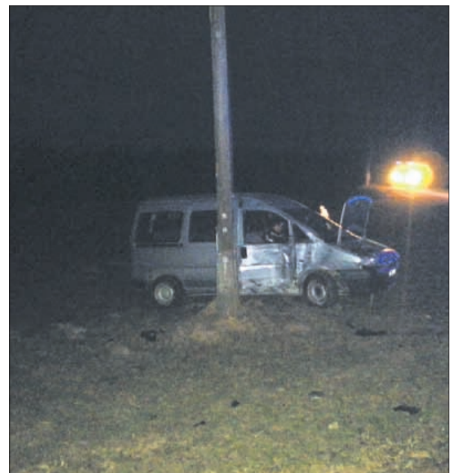
Na Lopati je voznik avtomobila trčil v drog električne napeljave.