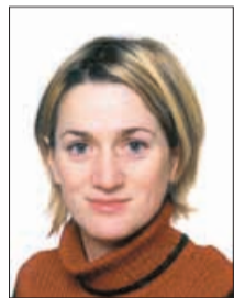
Piše: PAVLA KLÍNER

Ingver – Izjemno dober izganjalec virusov je tudi orientalska čudodelna korenina ingver ( Zingiber officinale ). Vsebuje več kot deset protivirusnih snovi, obenem pa je še antiseptik in antioksidant. Izkaže se predvsem za preprečevanje in zdravljenje vnetega grla in vnete sluznice. Lahko si pripravimo čaj iz svežega ingverja ali ingverja v prahu. Če uživamo surovega, prija, da mu dodamo pomarančo, če ga pražimo, pa se obnese, da mu dodamo še korenček. Za čaj iz korenine odrežemo pol centimetra debelo rezino svežega ingverja in jo z lupino vred drobno narežemo. V posodo vlijemo skodelico vode, dodamo ingver in zavremo. Pustimo 10 minut, precedimo in osladimo z medom. Pijemo 2- do 3-krat na dan, pred obrokom ali 1–2 uri po njem.