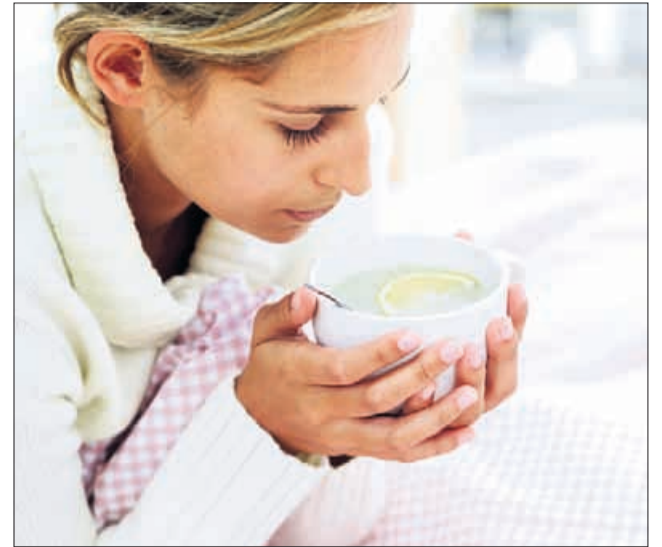
Prehlada se »lotimo« s čaji in drugimi naravnimi pripravki.