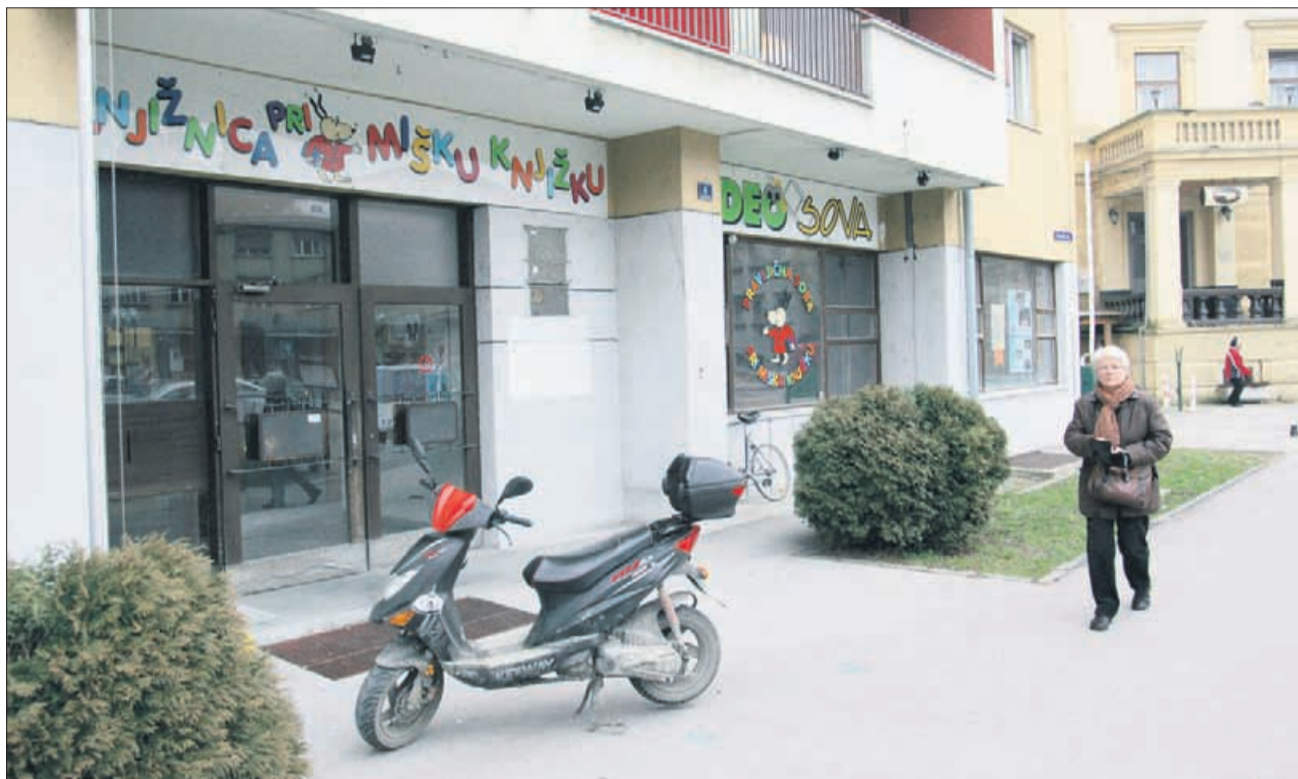
V nekdanji otroški knjižnici bo svoj prostor dobila ljubiteljska kulturna dejavnost.