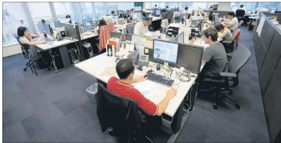
Redko pomislimo na zdravlilo, ki ga je za ljudi s prekomerno željo do dela priporočal znani filozof Bertrand Russell: »Če bi bil zdravnik, bi vsakemu bolniku, ki ne more živeti brez dela, predpisal letni dopust!«

Črni bezeg – Klinične študije so pokazale, da črni bezeg ( Sambucus nigra ) pomaga pri obrambi pred virusi prehlada in gripe, saj preprečuje njihovo razmnoževanje, prav tako pa skrajša simptome gripe in prehlada za štiri dni. Črni bezeg nasploh pomaga vzdrževati odpornost imunskega sistema. Ljudsko zdravilstvo ga je od nekdaj cenilo kot enega najboljših pomočnikov pri prehladu, kašlju in gripi. Čaj iz bezgovih cvetov spodbuja potenje in izločanje bronhialnih žlez ter lajša vnetja zgornjih dihal. Pripomore k temu, da sluznica v nosu in grlu postane odpornejša na okužbe. Čaj pripravimo tako, da 1 žličko posušenih bezgovih cvetov prelijemo z 1 skodelico vrele vode, pustimo stati 5–10 minut in precedimo. Čaj pijemo vroč oziroma topel 3-krat na dan po 1 skodelico. Dodajmo mu tudi žličko medu.