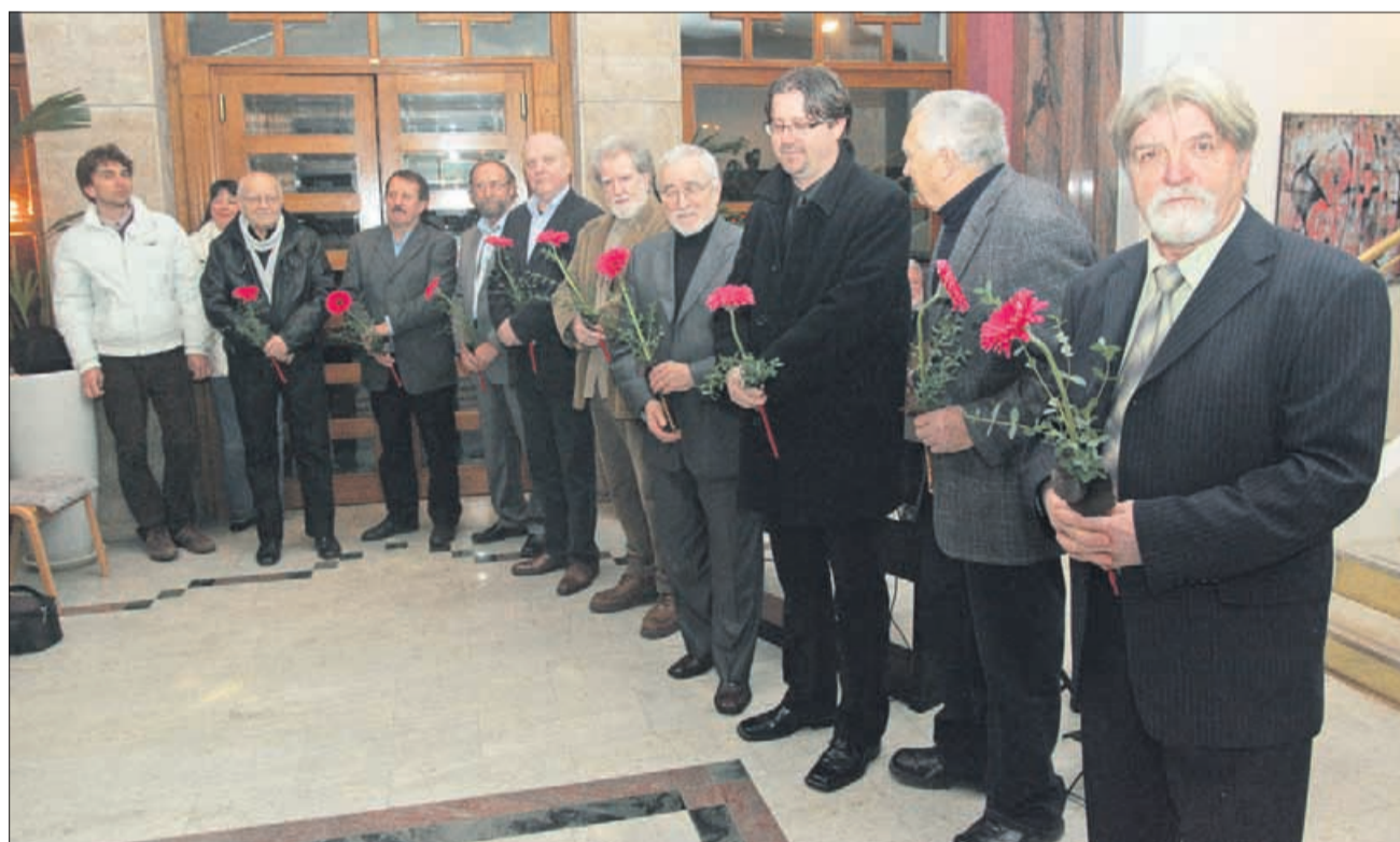
Devet slikarjev razstavlja v Laškem.