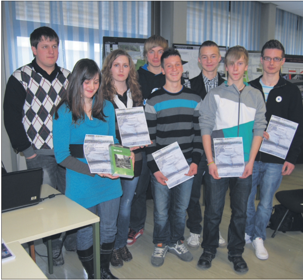
Dijaki Srednje šole za gradbeništvo in varovanje okolja ŠC Celje, ki so uspešno sodelovali v mednarodnem projektu.