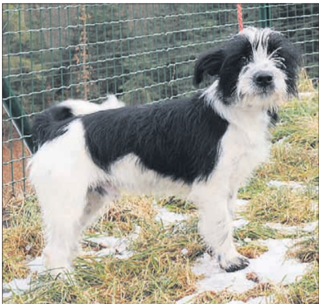
Sem Ajax, vendar ne čistilo! (Ajax)

Zimski čas in s tem tudi sneg lahko za ljubitelje psov in hkrati tudi za pse same pomeni veliko veselja. Vendar če nismo dovolj previdni, lahko prinese tudi veliko težav.