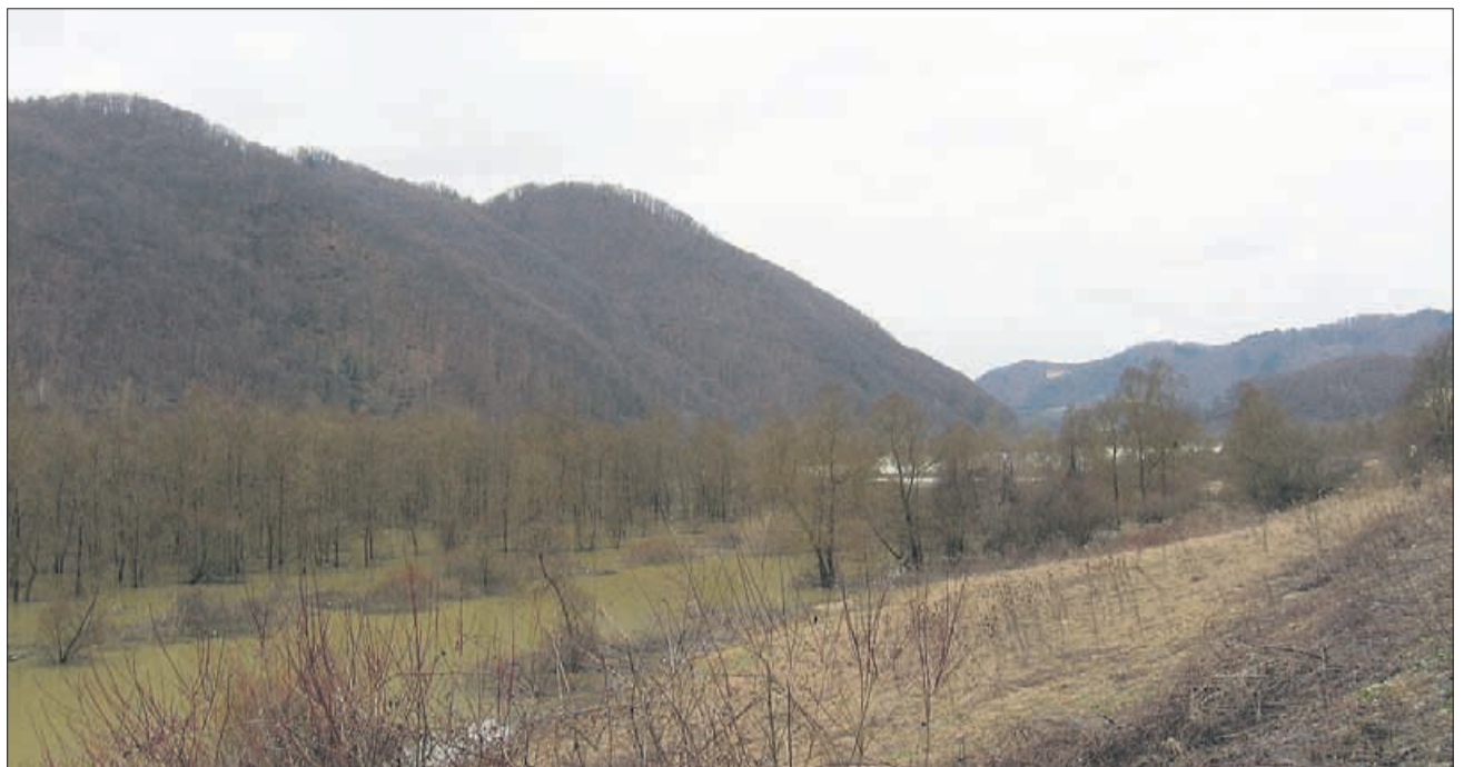
Dolga in težka pot do ponovne ojezeritve Vonarskega jezera, ki bo na območju dveh držav. Podjetje, ki je zarast na fotografiji v zadnjem času posekalo brez dovoljenja, si je prislužilo kazensko ovadbo.

Po dogovoru z ministrstvom za okolje in prostor iz leta 2007 izdeluje občina za Turistično rekreacijski cen-