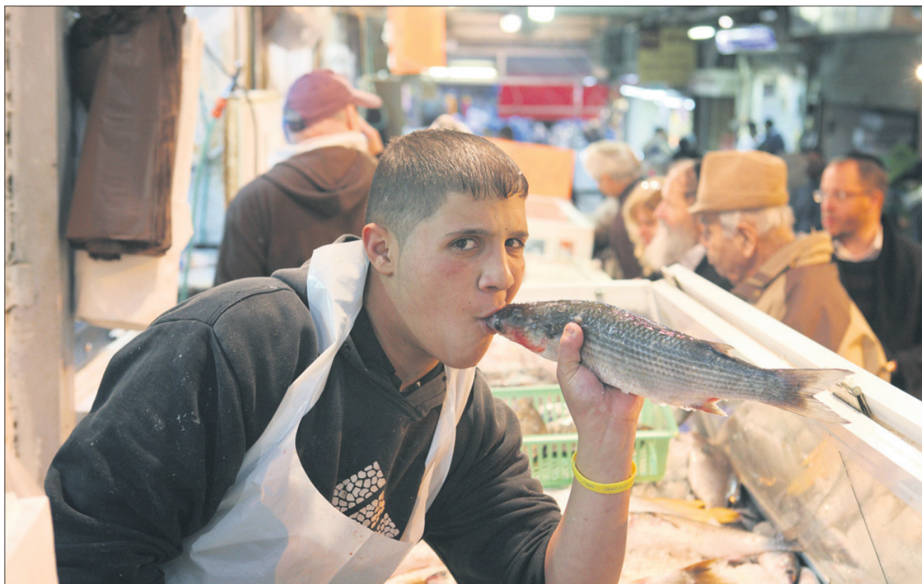
Če nimate za meso, pa jejte ribe ...