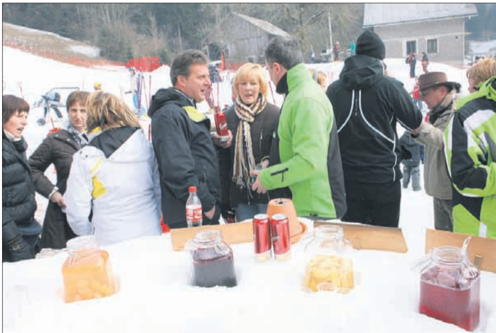
Priročni snežni »šank«, kjer hladilnik zagotovo ni potreben. »Borovnič«, limonovca in kuhanega vina ni manjkalo, zadišalo pa je tudi po okusnem brezplačnem golažu in mešanem z žara.