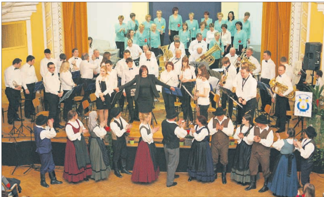
Celjski pihalni orkester je s svojim koncertom in gosti popeljal občinstvo na glasbeno potovanje po Evropi.