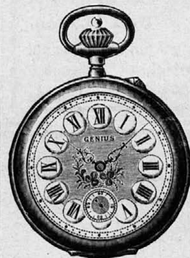
Genius: G 37 1 52 10

Ljubljana, Jurčičev trg št. 3 blizu čevljarskega mosta pod Trančo urar in trgovec z juvelj, zlatnino in srebrnino priporoča bratom narod. socijalistom svojo bogato zalogo najnovejše naročenih predmetov svoje stroke. —