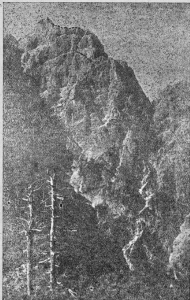
Pogled na Prisojnik s Krnice

2. številka »Delo in varnost«, ki bo izšla že konec januarja, bo posvečena prečim vprašanjem organizacije dela, o katerih so razpravljali udeleženci decembrskega posvetovanja, ki sta ga sklical Zveza inženirjev in tehnikov LRS in Zavod za proučevanje organizacije dela in varnosti pri delu LRS.