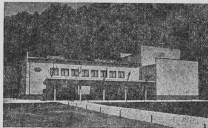
Dom »Svobode« v Štorah

Klub mladih proizvajalcev v celjski Cinkarni je prvi v celjskem okraju. Take klube pa bodo ustanovili tudi v drugih podjetjih. V najkrajšem času bodo taki klubi ustanovljeni še v Tovarni tehnič, Tovarni emajlirane posode, Stoklarni Rogaška Slatina in drugje.