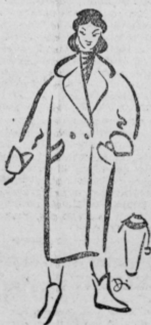
Zimski plašč s kimono ali »raglone«.