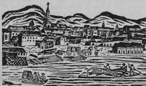
Maribor s pristanom v 18. stoletju (po pomočniškem potnem listu)