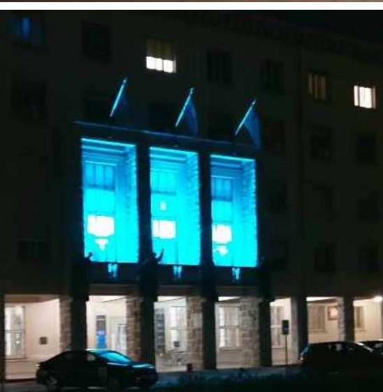
Dvorec Coronini , Šempeter pri Gorici 17. november 2021