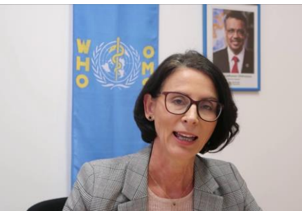
dr. Aiga Rurane Vodja urada Svetovne Zdravstvene Organizacije v Sloveniji

Za odpravo raka materničnega vratu morajo vse države doseči in vzdrževati stopnjo pojavnosti pod 4 na 100.000 žensk.