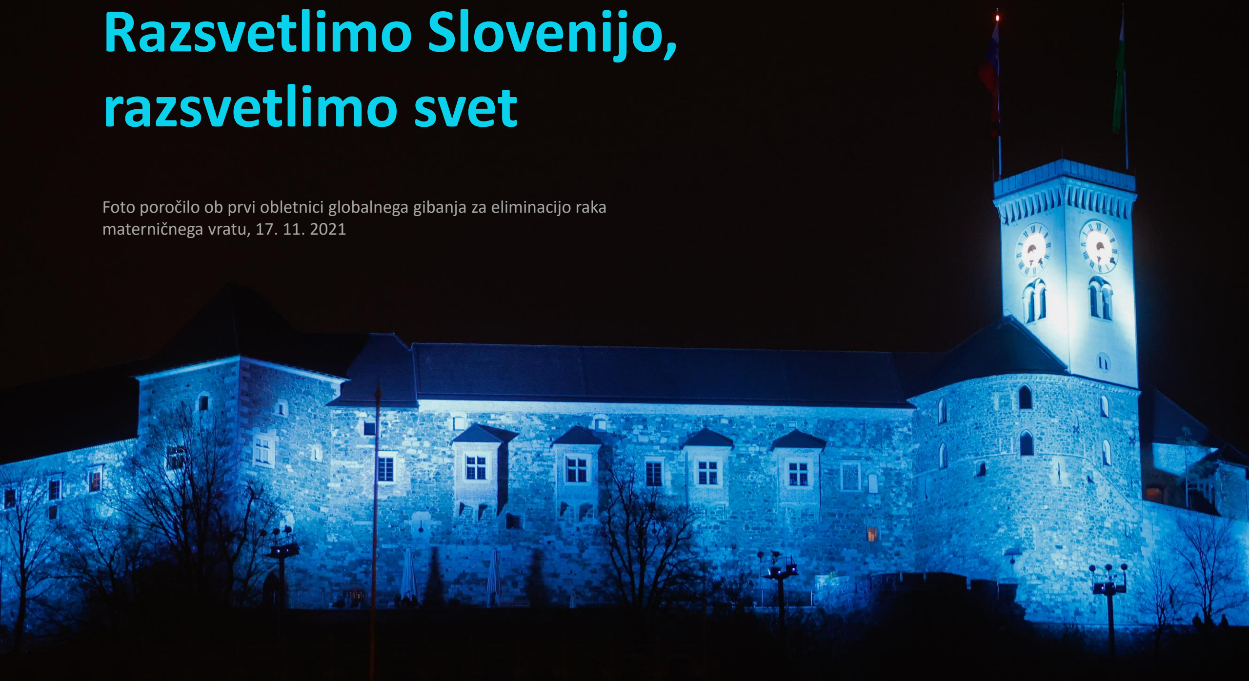
Foto poročilo ob prvi obletnici globalnega gibanja za eliminacijo raka materničnega vratu, 17. 11. 2021