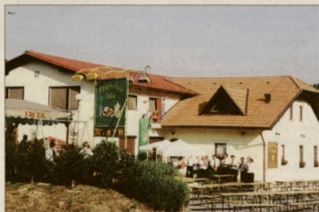
MG Okrepčevalnica Vrček v Sovičah vabi, da jih obiščete!