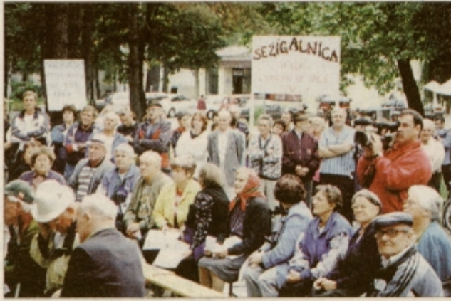
Udeleženci protestnega shoda so svoje nestrinjanje z nameravano sežigalnico izražali tudi s transparenti.

Protestnega shoda Civilne iniciative Kidričevega proti nameravani gradnji sežigalnice v kidričevskem Talumu se je v četrtek, 7. septembra, udeležilo okoli 200 krajanov, ki so s transparenti v rokah javno zahtevali, da občina in svetniki upoštevajo njihovo voljo, da sežigalnice v Kidričevem ne gradijo, ter da naj se o tem odločijo vsi občani na referendumu.