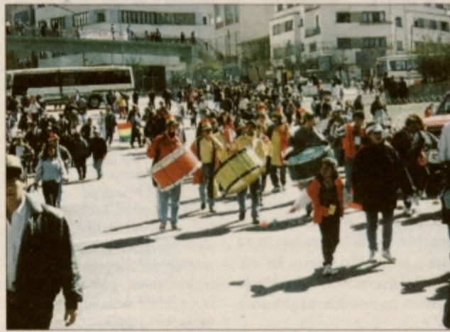
Tekma se je pričela mnogo pred pričetkom srečanja na igrišču in trajala še dolgo po končnem sodniškem žvižgu

La Paz je v nasprotju z drugimi tamkajšnjimi mesti nekoliko drugačen, saj Plaza de Armas ne predstavlja jedra, iz katerega se razvija večina drugih mest. Glavni del La Paza je Prado, ki je tudi najbolj komercialen del in središče blišča. Tam so vsi boljši lokali, trgovine, hoteli, pošta, stolpnice in se nam kaže kot kakšno evropsko ali severnoameriško središče. Mene ta del nekoliko spominja na La Rambla v Barceloni. Le nekaj metrov od Prada se kaže povsem druga slika, vidi se prava podoba in kontrast s prej ome-