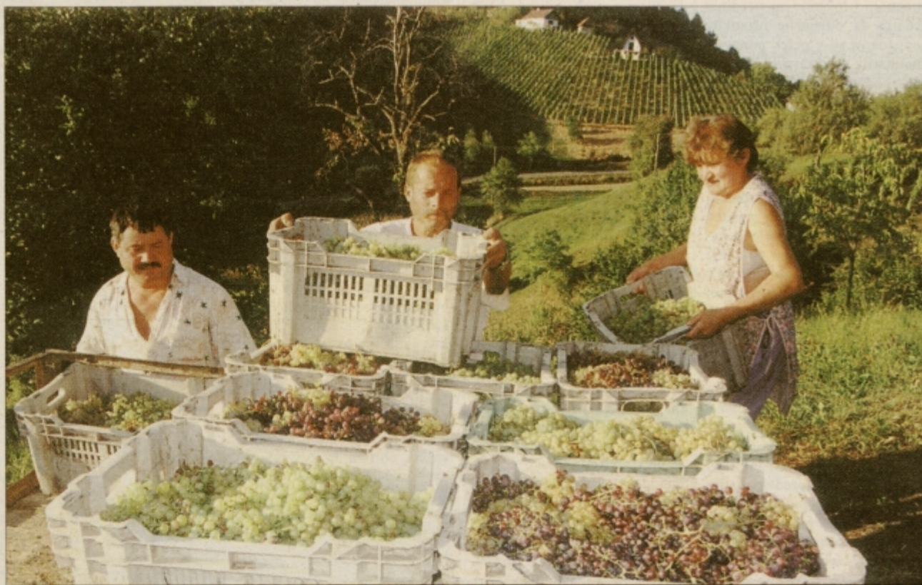
Vinogradniki so ga pridelali, vinarji ga bodo donegovali, mi ga bomo spili ...