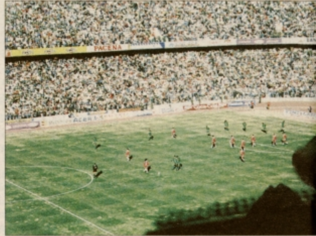
Na trenutke je bilo moč videti igrišče

Da so tamkajšnji ljudje neskončni optimisti, sem vedel že prej, o tem pa so pričali tudi številni transparenti in plakati, ki so jih nosili kar v rokah ali pa so bili nalepljeni po avtomobilih že nekaj dni pred tekmo. Bral sem lahko napovedi izjida tekme: 11:0 in podobne, seveda v korist domačinov. V množici