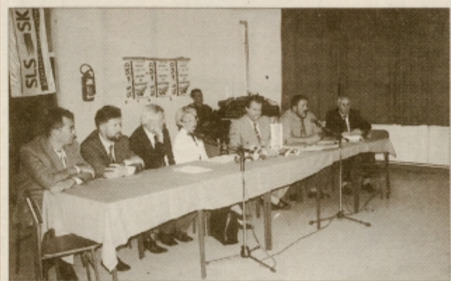
Udeleženci okrogle mize