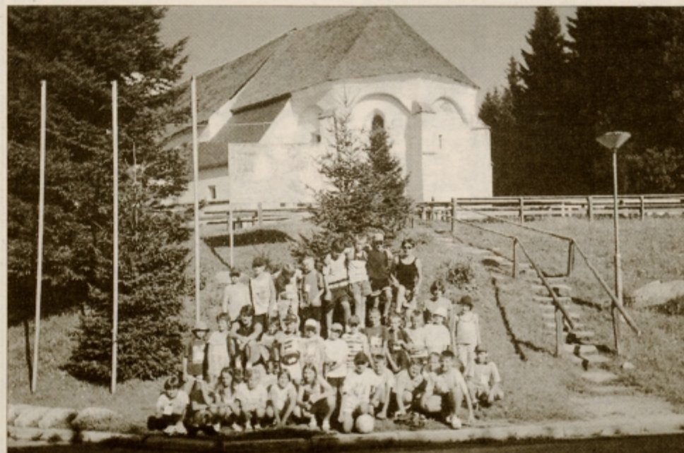
Pa še posnetek za spomin ...