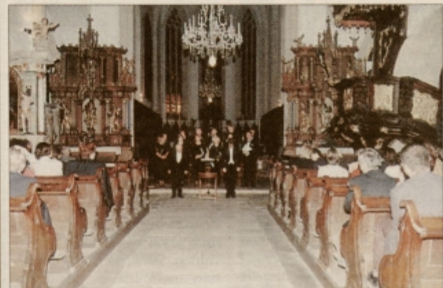
Koncert Glasbenega septembra 1997 v cerkvi sv. Jurija v Ptuj.