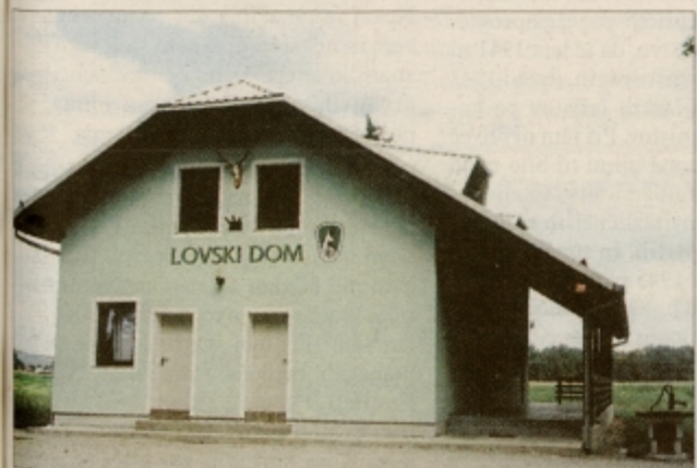
Gorišniški lovci so se dobro organizirali, ponos družine pa je tudi povsem nov lovski dom v Placerovcih.