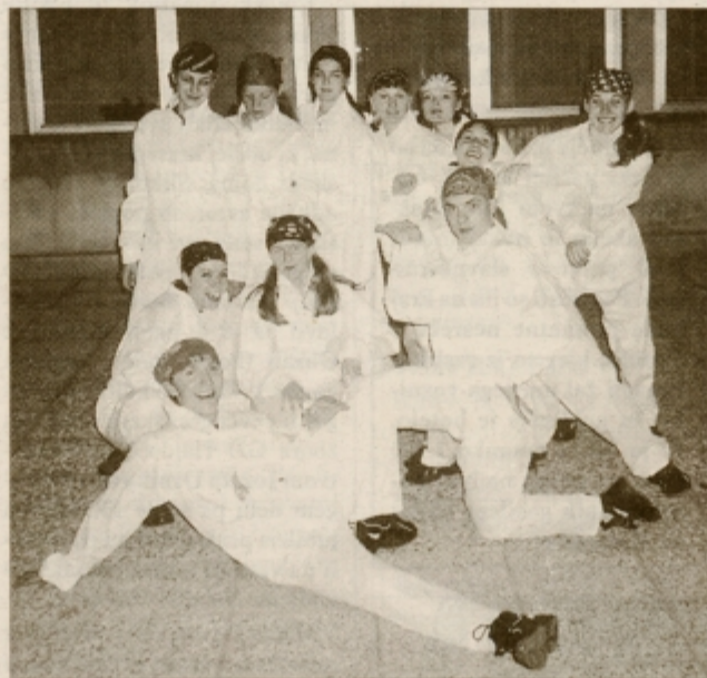
Hhipoperji plesnega centra Mambo

V dosedanjih plesnih letih je PC Mambo postal prepoznaven, utrdili smo svoj položaj in strokovnost. V novi sezoni želimo javnost z občasnimi časopisnimi novicami še bolj seznaniti s svojim delom, prizadevanji, ci-