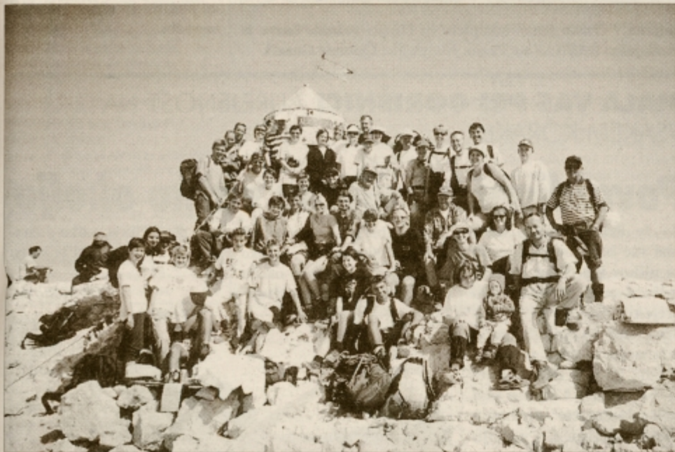
Ptujski planinci na vrhu Triglava