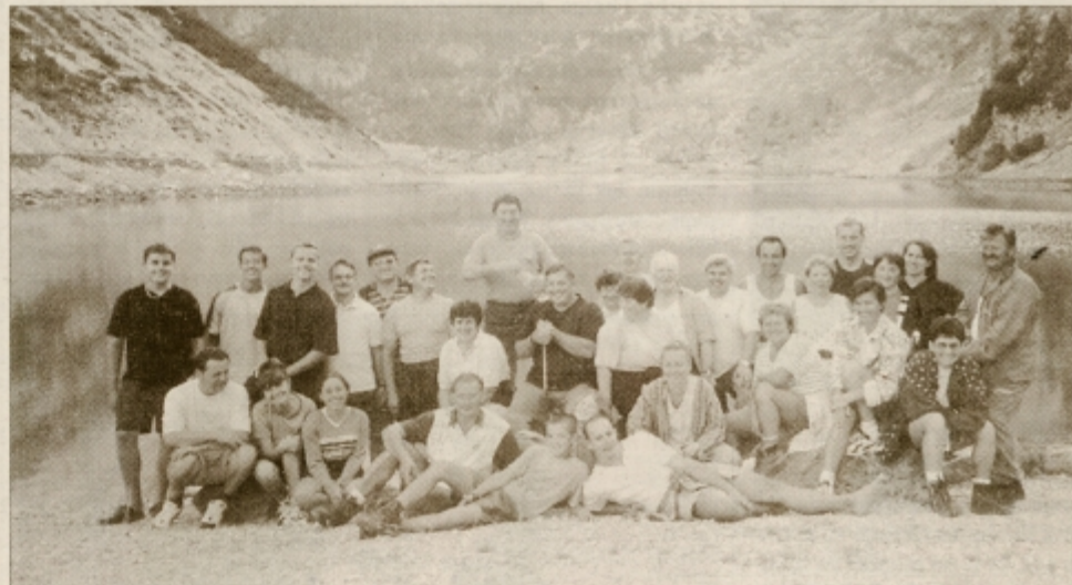
Ob Krnskem jezeru