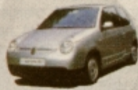
Lupo 3L TDI - skupna poraba 2,99l/100 km