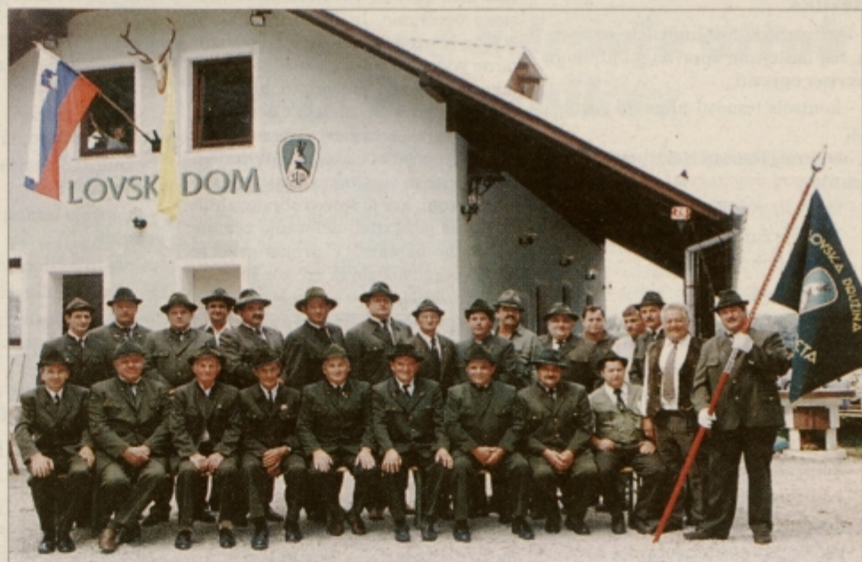
Zbrana lovska družina na slovesnosti v juliju.

naravo, želijo biti dobri gospodarji pri upravljanju z loviščem, gojitvi in lovu divjadi. Na žalost so njihova velika skrb divja odlagališča, ki tudi v gorišniški občini niso redkost, eno od teh pa so že uspešno sanirali in odpešali z zasaditvijo dreves. Starešina Jurič še pravi, da so prav