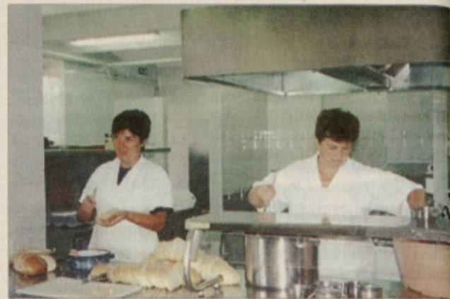
Jedilnica in kuhinja v Cirkulaneh

da je devetletka dobra sprememba in da z njo postane šola prijaznejša. Verjamem tudi, da bodo rezultati letošnjega šolskega leta pozitivni in da ne bo pomislekov za naprej ter da bomo postopno uvedli celoten program devetletnega šolanja."