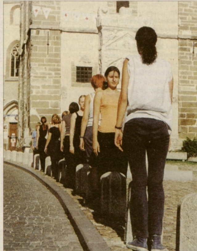
Plesalke plesne družine Gea med vajo za predstavo Velike mačke sanj.