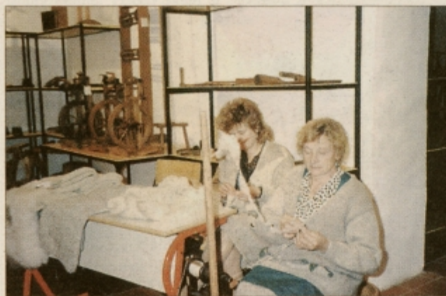
V Arkovi etnološki zbirki so se predstavile predice