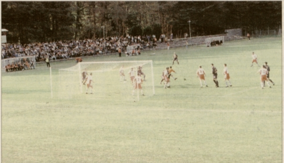
Tekma med Aluminijem in Mariborom je pritegnila veliko gledalcev

STRELCA: 0:1 N. Čeh /42/, 0:2 Ekmečič /70/