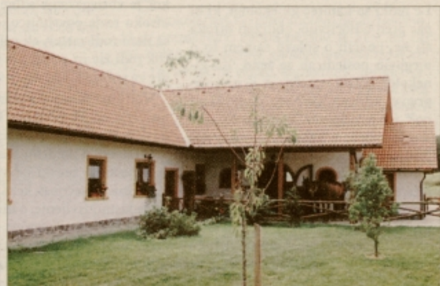
Kmetija Valerije Šaško, Janežovci 2