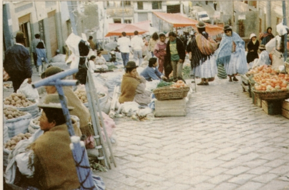
Večji del La Paza je ena sama velika tržnica