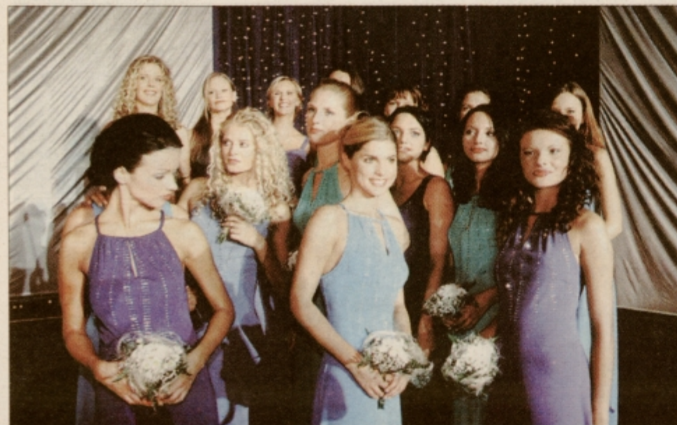
Šopek petnajstih deklet, ki se bodo potegovala za naslov miss Slovenije 2000 .