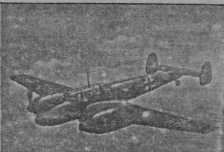
Najhitreje nemško lovsko letalo »Messerschmidt«. — Najhitrejši trimotorni nemški bombnik.

Pri teh besedah je glavico premaknil. Nato je nekaj časa gledal skozi povečevalno steklo. Potem je steklo izročil meni in dejal: