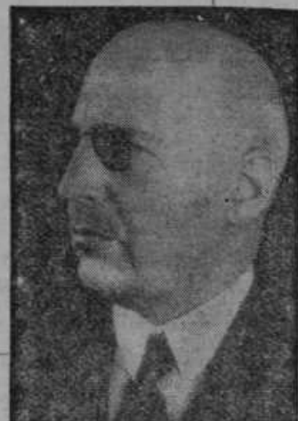
Dr. Ernest Wetter, novi predsednik Švice za 1941